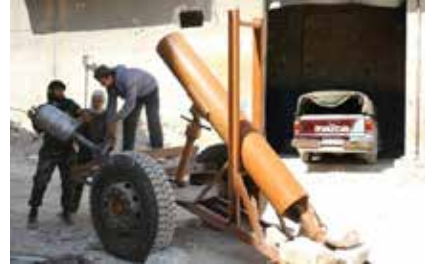
Ahrâru's-Şâm tarafından üretilen Cehennem Topu

eski silahlarla Irak ve Lübnan'dan silah tüccarlarının sahaya ulaştırdıkları Ak-47 tipi basit silahlarla el bombalarına dayanan hareket sonraki süreçte rejim güçlerinden büyük ganimetler elde etmiştir. Birçok rejim üssünü ele geçiren hareket tanklar, askeri araçlar, ağır makineli tüfekler, toplar, uçaksavarlar ele geçirmiş ayrıca kendi kurduğu atölyeler ve rejimden ele geçirilen fabrikalarda kendi havan ve toplarını üretmeye başlamıştır.