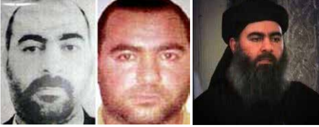
İŞİD lideri Ebûbekir el-Bağdadi

tur. el-Bağdadi 29 Haziran 2014 tarihinde kendisini Halife ilan etmiş ve Musul'da ulu camide hutbe vererek yüzünü medyaya göstermiştir.