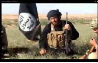
Örgütün Sözcüsü Ebû Muhammed el-Adnani

Sünnilerin Şiilerle savaşı mezhepçi bir savaş değildir... Mezhep bir şeyin parçasıdır. Şiilere gelince onlar bir dinin parçası değiller. İslâm ile alakaları yoktur. Onların kendi dinleri vardır bizim kendi dinimiz... Sünnilerin Şiilerle savaşı kutsal bir cihaddır, bir inanç savaşıdır. Putperestlik ile Tevhid arasındaki bir savaştır. Bu savaştan dönüş yoktur. 465