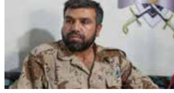
Cebhetu Suvvâr-i Suriya Lideri Cemal Maruf

Cephetü’s-Süvvâr Suriye olarak bilinen grup, İdlib’de, en büyük rejim üslerinden biri sayılan Vadi ed-Dayf üssünü 3 yıl boyunca kuşatma altında tutmasına rağmen, bilinçli olarak üssü ele geçirmemekle suçlanmıştır. Grubun, hem rejim, hem de ABD ile ilişki içinde olduğu ve daha çok rejimle çıkar ilişkileri nedeniyle aldığı paralar karşılığında, bu askeri üssü bilerek ele geçirmediği iddiâ edilmiş, nitekim bu askeri üs grubun tasfiyesinden kısa süre sonra, sadece bir günlük operasyon ile ele geçirilmiştir. Üssün ele geçirilmesi kısa süre içinde İdlib eyalet başkentinin muhaliflere geçişinin önünü açacaktır. Suriye Devrimciler Cephesiyle koalisyon kuran diğer bazı grupların Kuneytura ve Der’a bölgelerinde faaliyetler yürüttüğü ve rejime karşı ciddi saldırılarda yer aldığı bilinmektedir. Bununla beraber, bu grupların her ne kadar Cephetü’s-Süvvâr Suriye şemsiyesi altında savaşıyorlar da, kuşatılmış bölgelerde faaliyet göstermeleri dolayısıyla Cemal Maruf liderliğindeki İdlib grubuyla güçlü bir hiyerarşiye girmedikleri bilinmektedir.