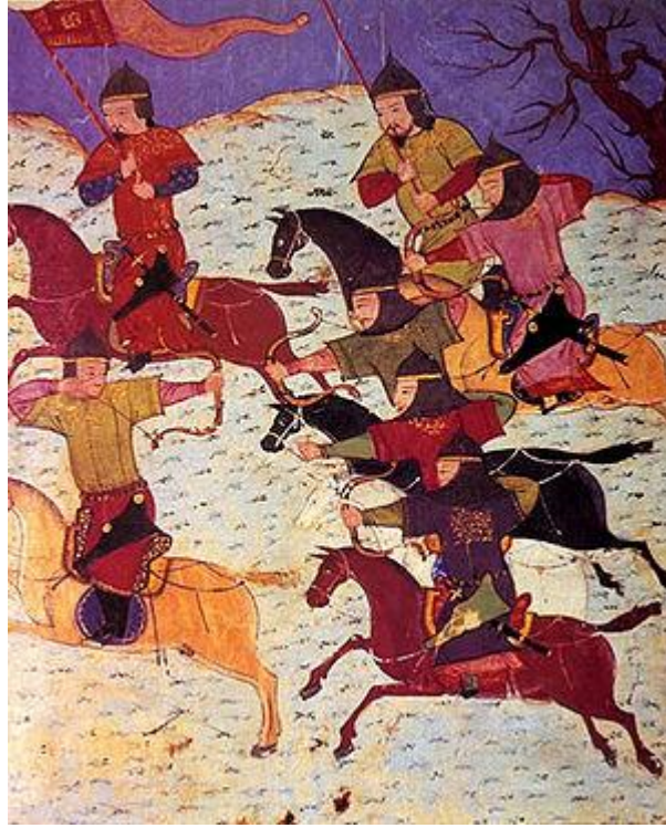
Kalka Savaşında Moğol Okçuları

knezliklerinde hüküm sürme şansı verilmiş ve bu durum yarlıklar ile güvence altına alınmıştır. Batu Han döneminde sorunsuz ilerleyen bu ilişkiler Berke Han döneminde yerini ayaklanmalara bırakacaktır.