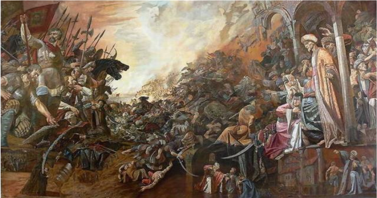
Korkunç İvan'ın Kazan'ı İşgal Ederken Yaptıklarını Anlatan bir Resim

Rusların Kazan'ı ele geçirmeleri kendileri için çok önemliydi. Çünkü Ruslar Kazan gibi bir kaleyi daha önce hiç hâkimiyetleri altına alamamıştı. Bununla birlikte Kazan düşse de halkı Ruslar için sorun teşkil etmeye devam etti. Rus tahakkümünü kabul etmeyen Kazanlılar birçok kez ayaklandılar. Ancak bunlar Ruslar tarafında şiddetle bastırıldı. Ruslar Kazan'ı işgal ederek kendilerine Türkistan'ın kapısını da açmayı başarmış oldular. Türkistan'da uygulayacakları zalim politikaların ilk ipuçlarını aslında Kazan'ın işgali sırasında vermişlerdir.