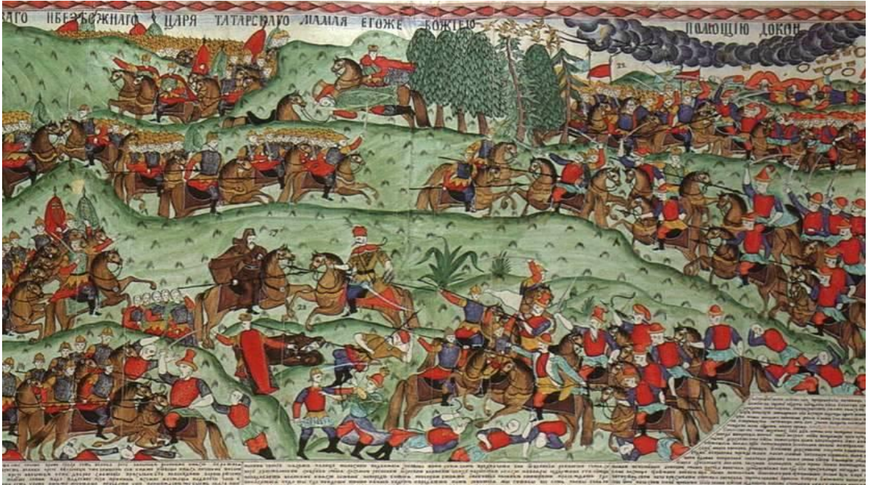
Kulikova Savaşı

1378 zaferi her ne kadar Rusları memnun etse de herkes Mamay'ın yeniden savaşmak isteyeceğinin ve mücadelenin yeni başlayacağını farkında idi. Gerçekten de Mamay, çok geçmeden Cenova, Çerkes ve Alan gibi halklardan oluşan bir ordu hazırlamıştır. Ayrıca Ryazan knezi Olge ve Litvanya Knezi Yagaylo ile de anlaşma yapmış ve Moskova'yı mağlup ettikleri takdirde onları vassal tayin edeceğini söylemiştir. Bütün bu hazırlıklardan sonra Mamay Dimitri'ye vermesi gereken vergilerin birkaç katını ödemesi gerektiğine dair haber göndermiştir. Dimitri zaman kazanmak için cevabı geciktirmiş Rus knezlikleri de Moskova Knezliği'ne yardım etmek için ordularını Kolomna'ya göndermişlerdir. 1380 yılında Mamay Mirza'nın ordusu Don Nehri ile Nepryadva arasındaki Kulikov düzlüğüne gelmişlerdir. Rus ordusu da Don Nehri'ni geçer geçmez Mamay'ın ordusu ile karşı karşıya kalmıştır. 1380 yılında vuku bulan savaşın başlarında Mamay Mirza üstünlük kurmuş ancak bunu iyi değerlendirememiştir. Rus ordusu da yeni katılan birlikler ile savaşa devam etmiş ve savaşın seyri Rusların lehine değişmiştir. Ancak Ruslar, bu muharebeden zaferle çıksalar da ordularının büyük bir kısmını ve en iyi knezlerini kaybettikleri için Altın Orda'ya vergi ödemeye devam etmek zorunda kalmışlardır.