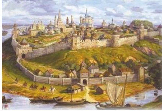
Kazan Şehri

Kazan hanlığının devlet teşkilat yapısında Bulgarların ve Altın Orda'nın izlerini görmek mümkündür. Devlet teşkilatı ekseriyetle Altın Orda'dan etkilenmiştir. Kazan Hanlığında da askerî kuvvete dayanan bir yönetim söz konusudur. Devlet'in başındaki kişiye "Han" unvanı verilmiştir. Ruslar hanlığın başındaki kişiye "Çar" unvanı vererek onları Bizans İmparatorları ile aynı seviyede görmüşlerdir. Kazan Han'ı olmak için iki şarta uymak gerekiyordu. Bunlardan birincisi Cengiz Han'ın soyundan gelmek, ikincisi de Müslüman olmaktı.