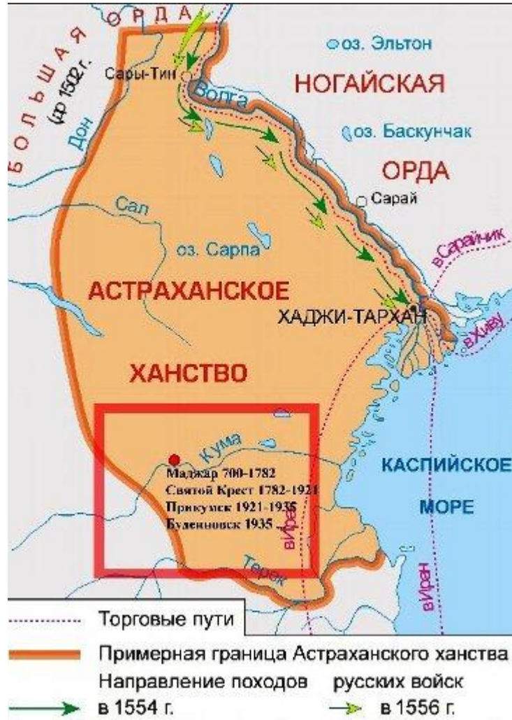
Astrahan Hanlığının Sınırları (www.ukhtoma.ru)

Astarhan bölgesi coğrafi özelliği ve jeopolitik önemi neticesinde bir ticaret noktası olmasının yanı sıra asırlarca Türk boylarının doğudan batıya doğru yaptıkları akınların merkezinde kalan bir bölge olmuş ve netice itibarı ile bu boylar tarafından birçok devlet teşkilatlanmasına sahne olmuştur. Sınırlarını belirleyecek olursak; araştırmacıların birkaç sonuca vardığı sınırlar konusunda L.E. Verein sınırları daha açık ve net bir şekilde vermektedir. Verein'e göre hanlığın sınırları şu şekilde belirlenmiştir: Doğuda Buzan Irmağı, kuzeyde Saray'a kadar, güneyde Terek Irmağı ve batıda Kuban'dan Don Nehri'nin yukarı kesimlerine kadar. Bu tarife eklenecek tek durum kuzey sınırının İdil ve Don Nehirlerinin en dar olan yerinde son bulduğunu belirtmek olacaktır.