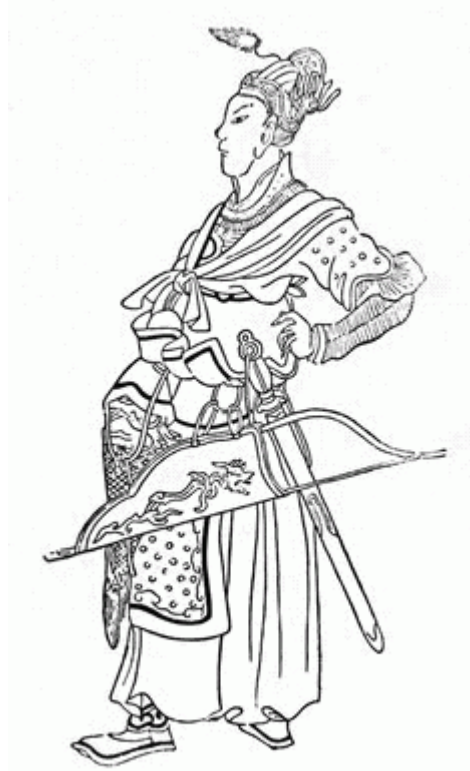
Batu Hanın Askeri Kıyafeti

Kaynaklardan anlaşıldığı üzere Moğol Yasası'nda ordu teşkilatına dair sert hükümler yer almakta idi. Meselâ eli silah tutan her Moğol, harp anında hangi onluk birliğe katılacağını bilmekte idi. Her asker kendilerine lazım olan silahlar temin etmekle görevli idi. Seferberlik hâlinde askerlikle mükellef olan her erkek orduya katılmak durumunda idi. Ordunun kural ve disiplinine riayet etmeyen her kimse -isterse Tümen beyi olsun- şiddetle cezalandırılırdı. Her asker ve komutan ait olduğu birlikte görevini ifa etmek durumunda idi. Başka bir birliğe geçmeye hakkı yoktu. Ayrıca asker her zaman yarı aç bir hâlde harbe gönderilirdi. Zira askerin tok olması onu gevşetir, harbin gidişatını değiştirebilirdi. Bu ifadelerden de anlaşılacağı üzere askerlikle ilgili hükümler yasaya göre düzenlenmiş ve hiçbir esneklik kabul etmeyecek şekilde disipline sokulmuştu.