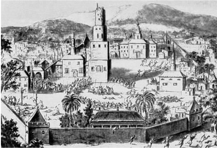
16. Yüzyılda Astrahan Şehri (www.uhktoma.ru)

Moğol istilası ile kurulan Altın Orda Devleti ve sonrasında bu coğrafyada kurulan Türk Hanlıklarının hiç biri Astarhan kadar çok muhtelif isimle anılmamıştır. Bunun sebebi tabii ki bölgenin Türkistan ile Güneydoğu Rusya bozkırları arasında doğal bir kavşak olması, önemli ticaret yollarının ortasında kalması ve önemini her daim muhafaza etmesi ile alakalıdır. Tüm ticaret unsurlarının yanı sıra şehrin adının farklı varyantlarının olmasının diğer sebebi ise Türkistan'dan gelen hacıların burada konaklamasıdır. Ayrıca 1556 yılında Astarhan hanlığının Rusya tarafından işgali ile Osmanlı-Rus-İran ilişkilerinde kilit nokta hâline gelmiş ve vesikalarda farklı biçimlerde zikredilmiştir. Astarhan ismi Türk lehçelerinde muhtelif şekillerde geçmektedir. Kazakçada "Aydarhan", Kırım ve Kazan Tatarcası'nda "Açtarhan", Çuvaşçada "Açtarkan, Açtarhan veya Açt'arhan", Arap ve Fars kaynaklarında "Hacc Tarhan" ve "Hacı Tarhan" şekillerinde geçmektedir. Bunların yanı sıra Batı dillerinde kullanılan isimleri de vardır. Axetrehan, Azetrechan, Agitarcam, Agitarcham, Astarchan vb... isimler öyle ya da böyle şehrin isminin Türkçe telaffuzu ile ilgilidir. Tüm bu varyantlar neticesinde şehri ya da hanlığı isimlendirirken Türkçeyi göz önünde bulundurarak "Astarhan" varyasyonu tercih edilmektedir.