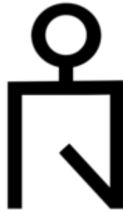
Mengü Timur’un Paralardaki Damgası

3- Yabancı ticaret erbabından alınan vergiler: Bu vergiler genellikle Venedikli ve Cenovalı ticaret kolonilerinden alınan vergilerden müteşekkildir. Bu vergiler zaman zaman özel anlaşmalar ile de desteklenebilmekte idi. Mesela Özbek Han zamanında 1333 yılında Venediklilerin kendilerine tahsis edilen depo ve Pazar yerleri için %3 üzerinden, ayrıca Kırım’daki limana gelen gemiler için yelken sayısına göre resim ödemedikleri bilinmektedir.