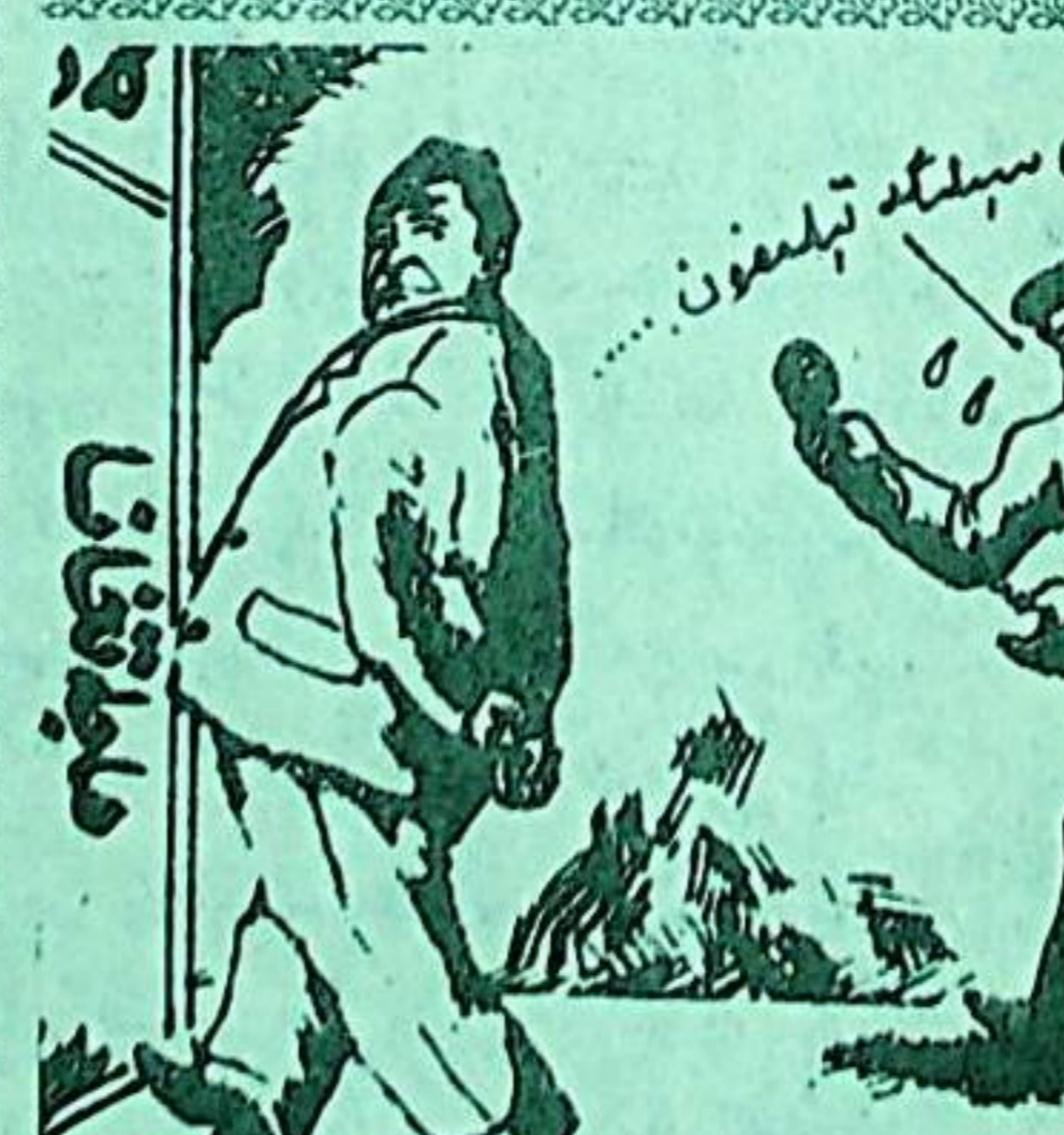
باشلىق سېلىم تېلېفون

رەسساملىرى پىشۋاسى پورتىندىلارنىڭ رەسساملىق سەنئىتىدىكى سەۋىيىسى گەۋدىلىك بولغانلىقتىن، ئاڭ سۇلالىسىنىڭ تەكلىپى بىلەن چاڭئەن شەھىرىدە مەكتەپ ئېچىپ، مىڭلارچە كەسپىي رەسساملارنى تەربىيەلەپ بەردى. بۇلارنىڭ ئۇسلۇب، ماھارەت ۋە دېتال تالاشنىكى تەسىر كۈچى تاكى ياپونىيە، چاۋشيەن، ۋېيتنام، كامبۇدجا قاتارلىق ئەللەرگىچە يېتىپ باردى. دەۋرىمىزگىچە يېتىپ بارغاندا قىزىقارلىق ھەشەمخورلارنىڭ قىزىنىڭ ھۇجرىسىنى جابدۇتۇشتىكى ھەشەمخورلۇقنى دېمەيدىغان تېخى: بىر يۈرۈش لۆم - لۆم ئورۇندۇق، ئالاھىدە بېزەلگەن قوش كىشىلىك لۆم - لۆم كارۋات، قوش قەۋەتلىك مېھمان شەھەرلىرى، قوش - قوش ئېسىل داستىخانلار، كىيىم ئىشكىلىرى، تۇرمۇش ئىشكىلىرى (بەرداز ئىشكىلى، تىزىندىلار ئىشكىلى...)، قوش تۇڭلۇق گاز ئۇچقى، دەزمال، دوخۇپكا، ھاۋا تەڭشەكچى، جۇپ - جۇپ تام گىلەملىرى، قۇچاق - قۇچاق يوقتان - كۆزپىلەر، تام تورۇش زىننەتلىرى (تام ساتتى، تام سۇرتىلىرى، ھەر خىل سىزمىلار، ئاسقۇنچىلار)، توڭلاق، رەڭلىك تېلېۋىزور، سىناقۇ، ئۇنىۋېرسال، كىرئالغۇ، فوتو ئاپپارات، بىرىكە ئاۋاز ساندىقى... لار - خۇددى يېقىن بۇرادىرىمىز «بەختەج ھاجى» دېگەندەك: «30 مىڭ يۈەن خەلپەنگەن يىڭى ئۆي» لەر ھەشەمخورلارنىڭ توي ھەشەملىرىدىن بىر ھاقتا بولۇپ تۇرۇپتۇ. بەزىلەرنىڭ: «بىزدە 100 مىڭ يۈەنلىك تويىلار پەيدا بولۇۋاتىدۇ...» دېگەن سۆزلىرى ئاساسىز ئەمەستەك قىلىدۇ.