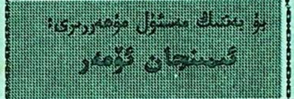
بۇ يىلنىڭ مەسئۇل مۇھەررىرى: گىيىنچان گۈمبەر

ئىختىيارىي مۇخبىرىمىز كېرەم قۇرسۇن خەۋىرى. يېڭى نۆۋەتلىك تۇرپان شەھەرلىك سىياسىي كېڭەش كومىتېتى تارىخ ماتېرىياللىرى خىزمىتىگە بولغان رەھبەرلىكنى كۈچەيتىپ، يۇقىرى دەرىجىلىك ئورۇنلارنىڭ تەستىقى ئارقىلىق تارىخ ماتېرىياللىرى كومىتېتى قۇردى ۋە مەسئۇل خادىملارنى بېكىتتى. يېقىندا يەنە ئىككى قېتىم يىغىن ئېچىپ تارىخ ماتېرىياللىرى خىزمىتى ھەققىدە مۇھاكىمە ئېلىپ باردى ھەمدە يىل ئاخىرىغىچە ئىككى كىتاب (خەنزۇچە، ئۇيغۇرچە) نەشر قىلدۇرۇشنى قارار قىلدى.