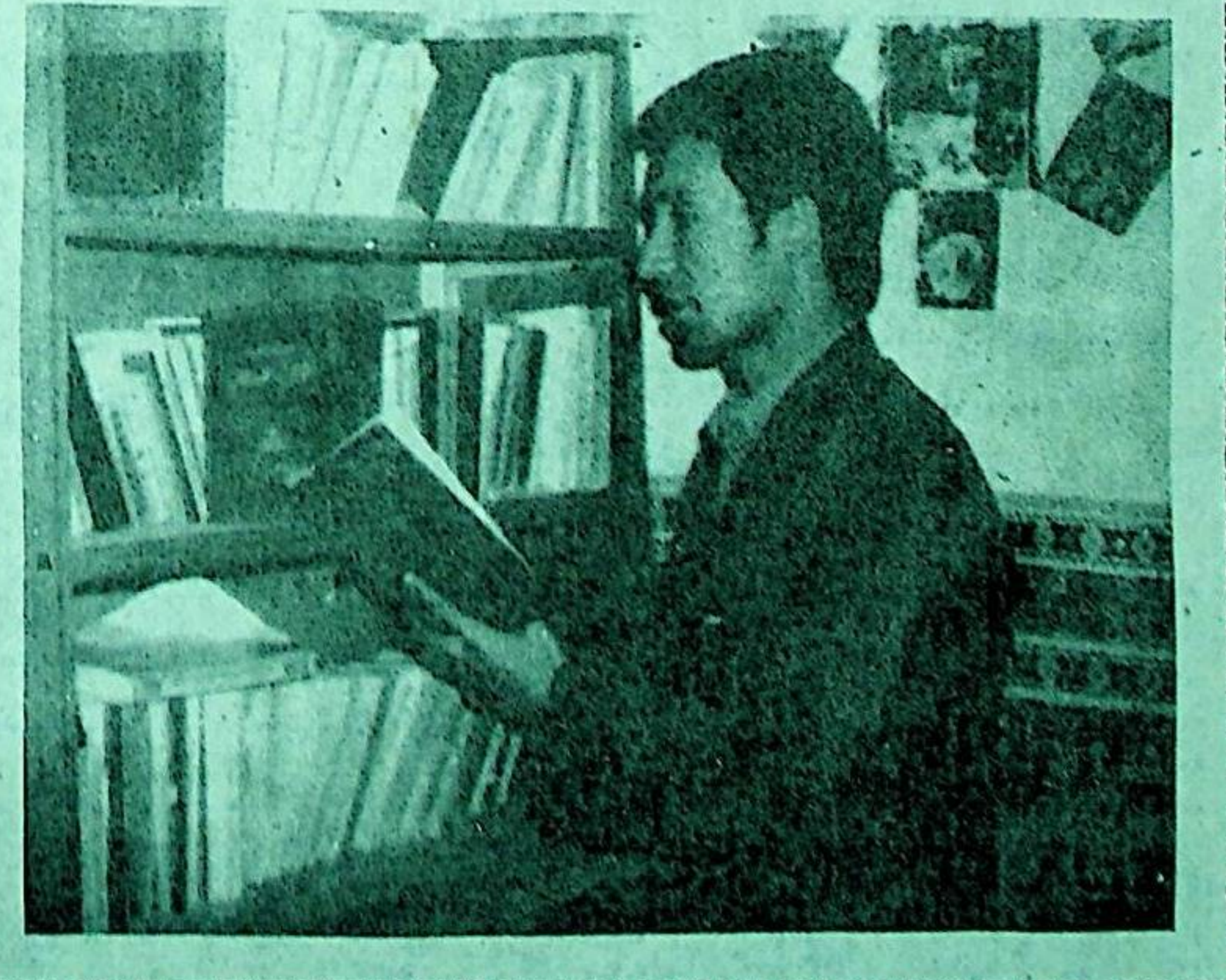
گابدۇلئەھمەت ئالىم فوتوسى

سىمۋولى سۈپىتىدە چۈشەننىش كەڭ دائىرىلىك ئەكس ئەتكەن. «ئېرىق بېنىك» (پالنامە)دە: «باتۇر بەگ يىلقىغا بېرىپتۇ، ئاق بېلىنى قۇلۇنلاپتۇ، ئالتۇن تۇپاقلىق ئايىزلىققا يارىقۇدەك، تۆگىلىرىگە بېرىپتۇ، ئاق ھىنگىنى بوتلاپتۇ، ئالتۇن پۇتلۇق بوغرالىققا يارىقۇدەك، تۆپىگە كېلىپتۇ، 3 - مەلىكىسى ئوغۇل تۇغۇنۇ، بەگلىككە يارىقۇدەك، خۇشال - خۇرام بەگ (باتۇر) ئىكەن! بۇ، ئېنىق ئەزگۈ: دېگەن چۈش تەبىرى ئۇچرايدۇ، بۇ چۈش تەبىرىدىمۇ ئوخشاشلا ئاق رەڭ ئەزگۈ (ياخشىلىق) بەختنىڭ نىشانى سۈپىتىدە ئېيتىلىدۇ. «كۈل تېكىن مەڭگۈ تېشى» دا كۈل تىكىنىڭ ھەر خىل رەڭدىكى ئاتلارنى سېپ جەڭگە كىرگەنلىكى، پەقەت ئاق ئات مىنگەن جەڭدىلا غەلبە قازانغانلىقى تەسۋىرلىنىدۇ، ئۇنىڭدىن باشقا بەزى ماتېرىياللاردا، ئۇيغۇرلار ناھايىتى بۇرۇنلا ئاق رەڭنى ئۇلۇغلاش ئاساسدا ئاق ئاتنى ئۇرۇش ئىلاھى قىلغانلىقى قىت قىلىنىدۇ. بۇنىڭدىن باشقا ئۇيغۇرلاردا ئەجدادلار روھىنى ئۇلۇغلاش ئاساسدا ئۆزلىرى مۇقەددەس بىلگەن ئاق رەڭ چۈشەنچىسى بويىچە مېيىت ئاق رەخت بىلەن كېپەتلىنىدۇ. قىسقىسى ئاق ۋە كۆك رەڭ خەلقىمىزنىڭ كۆزۈللىك ئادىتىدە ياخشىلىق، بەخت ۋە نۇسرەتنىڭ نىشانى، ئۇ يىراق قەدىمكى زامانلاردا شەكىللىنىپ، ھەرقايسى تارىخىي دەۋرلەردە تۈرلۈك دىنلارنىڭ تەسىرىدە كۈنمىرى بېسىپ بۈگۈنكىچە ئىزچىل ھالدا مىللەتنىڭ كۆزۈللىك قارشى ۋە مىللىي پىسخىكىسىنىڭ بىر تەرىپىدە گەۋدىلىنىپ كىشىلەرنىڭ ئېگىزلىكى، ئۆرپ - ئادەتلەردە شۇنداقلا دۇنيا قارىشىدا مۇئەييەن تەسىر كۈچىنى ساقلاپ، ئېتىقادىي ئىنسانلارنىڭ يالدامسى سۈپىتىدە مەۋجۇت بولۇپ تۇرماقتا.