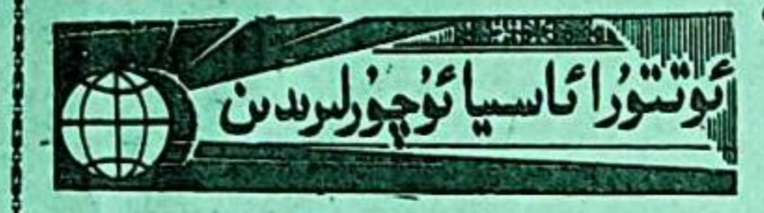
ئوتتۇرا ئاسىيا ئۈچۈن بىرىدىن

تاجىكىستان يىللىق مەھسۇلاتى ئون توننا ئالتۇن ۋە 40 توننا كۈمۈش ئىشلەپچىقىرايدىغان زامانىۋى خىمىيە سانائىتى زاۋۇتىدىن بىرنى قۇردى. تاجىكىستان يەر ئاستى بايلىقى مول دۆلەت بولۇپ، ئىلگىرى بۇ يەردىن چىققان ئالتۇن رودىلىرىنى روسىيەگە ئېلىپ بېرىپ پىششىقلايتتى. ئاندىن سوۋېت ئىتتىپاقىنىڭ دۆلەت ئامبىرىغا تاپشۇراتتى. ھازىر بۇ بايلىق 4 مىليوندىن كۆپرەك نوپۇسقا ئىگە بۇ دۆلەتنىڭ ئىقتىسادى ئۈچۈن مۇھىم بىر تۈۋرۈك بولۇپ، تاجىكىستاننىڭ نۆۋەتتىكى ئىقتىسادىي كىرىزىستىن قۇتۇلۇش ئۈچۈن كەم بولسا بولمايدىغان دەسايە بولۇپ ھېسابلىنىدۇ. ھازىر بۇ يەر ئىتالىيىدىن كىرگۈزۈلگەن ئۆسكۈنىلەردىن قۇرۇلغان زىننەت بۇيۇملىرى ياسايدىغان ئىش ئورنىدىن بىرى قۇرۇلدى. (ماتېرىيالدىن)