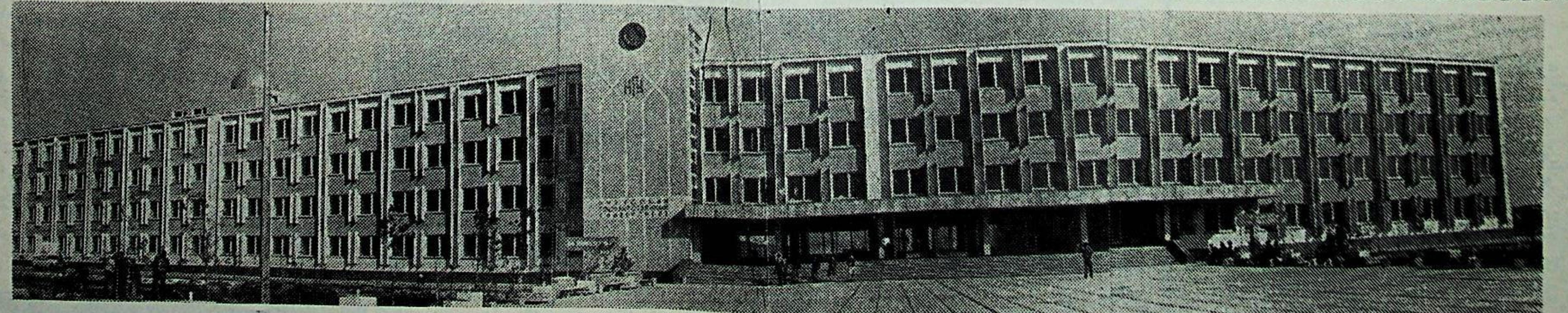
صورتده: قاره قلیباستان مختار جمهوریتیدگی نوقوس دولت اوتیورسیتیتی

آرتیق آی بونده کی کته ایشانچ که قنده ی سزاوار بولدی، یعنی خلق اونی اتقاق عالی سویتیکه دیپوتات قیلیب سه یله هدی؟ آرتیق آی شیرعلی آکه نینک تونغیچ قیزی. ۱۹۵۰ یلده توغیلکن ۱۹۶۵ یلده سه کیز یللیک مکتبنی بیتیرکچ، بیر یل دوامیده کولخوز چی بولیب ایشله دی. شوندن کین میخانیک لر تیارله دیدکن ۶ آیلیک کورسده تعلیم آلدی... کورسنی موفقیتلی ادا ایتکچ ۱،۲