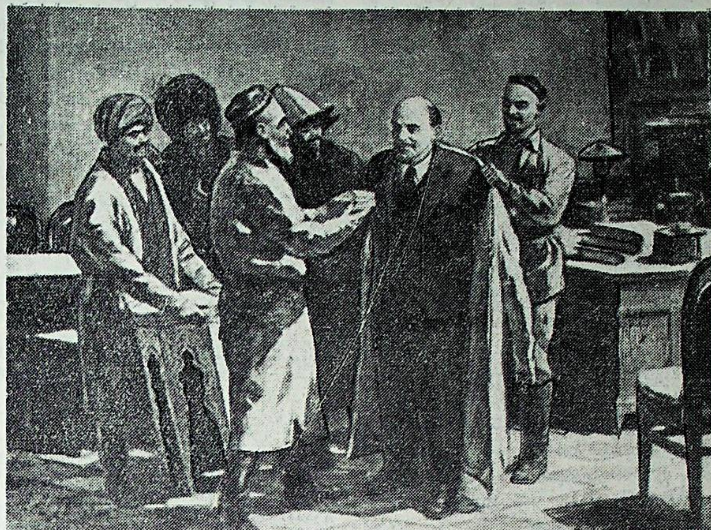
صورتده: اورته آسیا خلقلری وکیل لری لینین حضوریده.

بو یل بیز لینین تولدی نینک ۱۰۸ یل لیگینی نشانله ماقده میز. نشانله کنده هم تاریخده اوچمه س ایز قالدیرکن عالم شمول واقعه لر بیلن نشان له ماقده میز. سویت کیشیلری فراوان حیات و بخت - سعادت رمزی بولکن ینگی کانستیتوسییه نی کته خورسندچی لیک، زور افتخار بیلن کوتیب آلدیلر. منه یریم یلدرگه، بو کانستیتوسییه دلیمیزگه قوت، کوزیمیزگه نور بغیش له ب توریددی. خلقلریمیز سویت اتفافی کوچ - قدرتی نی آشیریش، مملکت اقتصاد یاتینی یوکسه لتیریش، فن و تیخنیکه نی ینه هم رواجله تیریش بابیده مثل سیز موفقیته لرگه ایریشدیلر.