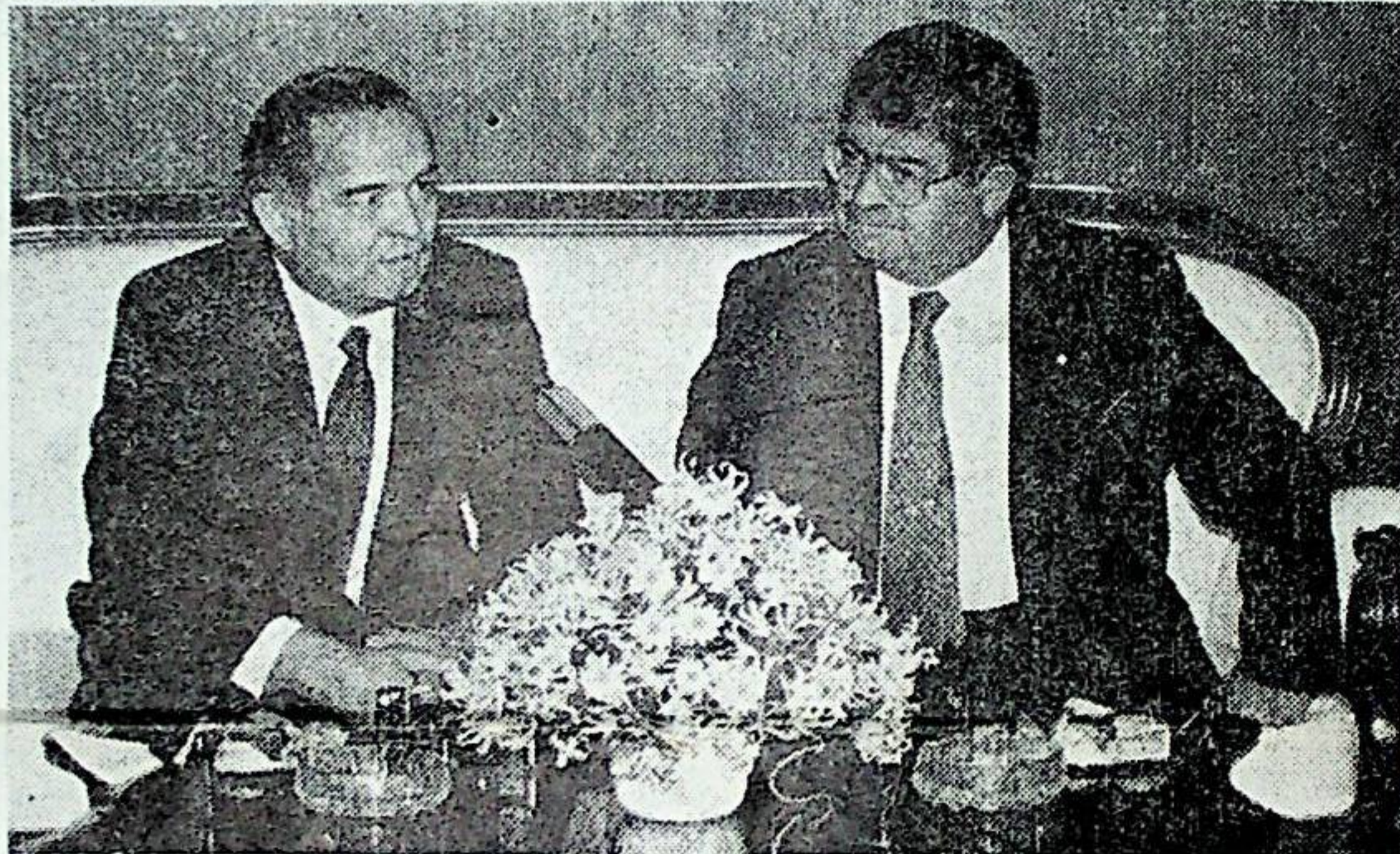
ترکیه جمهوریتی پرزیدنتی تورغوت اوزال و اوزبیکستان جمهوریتی پرزیدنتی اسلام کریموف صحبت چاغیده

اوزبیکستان یازوواچیلر او- یوشمه سینینک بیرینچی کاتبی، شاعر و ترجمان جمال کمال ترکیه جمهوریتیده اوج مراتبه بولکن. مخریمینینک مذکور صحتیده شاعر نینک ترکیه گه قیلکن اوچینچی سفری خصو- صیده گپ باره دی.