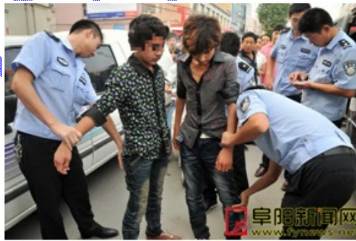
رەسىمدە: ئىچكىرىدە يانچۇقچىلىق قىلىپ تۇتۇلۇپ قالغان ئۇيغۇر بالىلىرى

“مىنى چاقىمىغان يىلان مىڭ يىل ياشسۇن” دىگەن ماقال - تەمسىللەرنىڭ تەسىرىدىن بولسا كىرەك، مەن گەرچە بەزى قارا نىيەت كىشىلەرنىڭ ۋە قارا جەمئىيەتنىڭ يىشىغا يەتمىگەن نارسىدە ئۇيغۇر بالىلىرىنى ئىچكىرىگە ئالداپ كىرىپ، ئوغرى يانچۇقچۇلۇق ۋە باھىشە ئىشلىرىغا سېلىۋاتقان ئىشلارنى ئەينى ۋاقىتتا ئۆز كۆزۈم بىلەن ئاز تولا كۆرگەن ۋە چەتئەلگە چىققاندىن كېيىنمۇ ھەر خىل ئۇچۇر ۋاسىتىلىرى ئارقىلىق، بۇ خىلدىكى ئۇچۇرلارنى كۆپ كۆرگەن ۋە ئاڭلىغان بولساممۇ، بىراق مەن بۇ جەھەتتە بىرەر نەرسە يىزىپ باقمىغان ئىدىم. يېقىندا ئۆز ئائىلەمدە يۈز بىرگەن بىر كىلىشىمەسلىك، مىنى “مىنى چاقىمىغا يىلان، بەزىدە قېرىندىشىمنى چىقىپ قويىدىكەن” دىگەن ئويغا كەلتۈرۈپ قويدى. شۇ سەۋەبتىن، مەن گەرچە بۇ جەھەتتە ئالاھىدە كۆپ نەرسىلەرنى بىلىپ كەتمىسەممۇ، بىراق بىلگىنىم بويىنچە تۆۋەندىكى بۇ يازمامنى يىزىش قارىدىغا كەلدىم. مەن بۇ يەردە بۇ ئىشنىڭ سەۋەپ نەتىجىسى توغرىسىدا يەكۈن چىقىرىش نىيىتىم يوق. مەن پەقەت بۇ يازمام ئارقىلىق، ئۇيغۇر جەمئىيىتىنىڭ بۇ مەسىلىگە بولغان دىققەت ئىشبارىنى قوزغاش ۋە شۇ ئارقىلىق بۇ مەسىلىنىڭ تېخىمۇ يامراپ كېتىشىنىڭ، بۇ زەھەرلىك يىلاننىڭ كۈنلەرنىڭ بىرىدە ھەممىمىزنى چىقىپ كېتىشىنىڭ ئالدىن ئىلىش ئۈچۈن ئىزدىنىشكە تۈرتكە بولۇشتىن ئىبارەت.