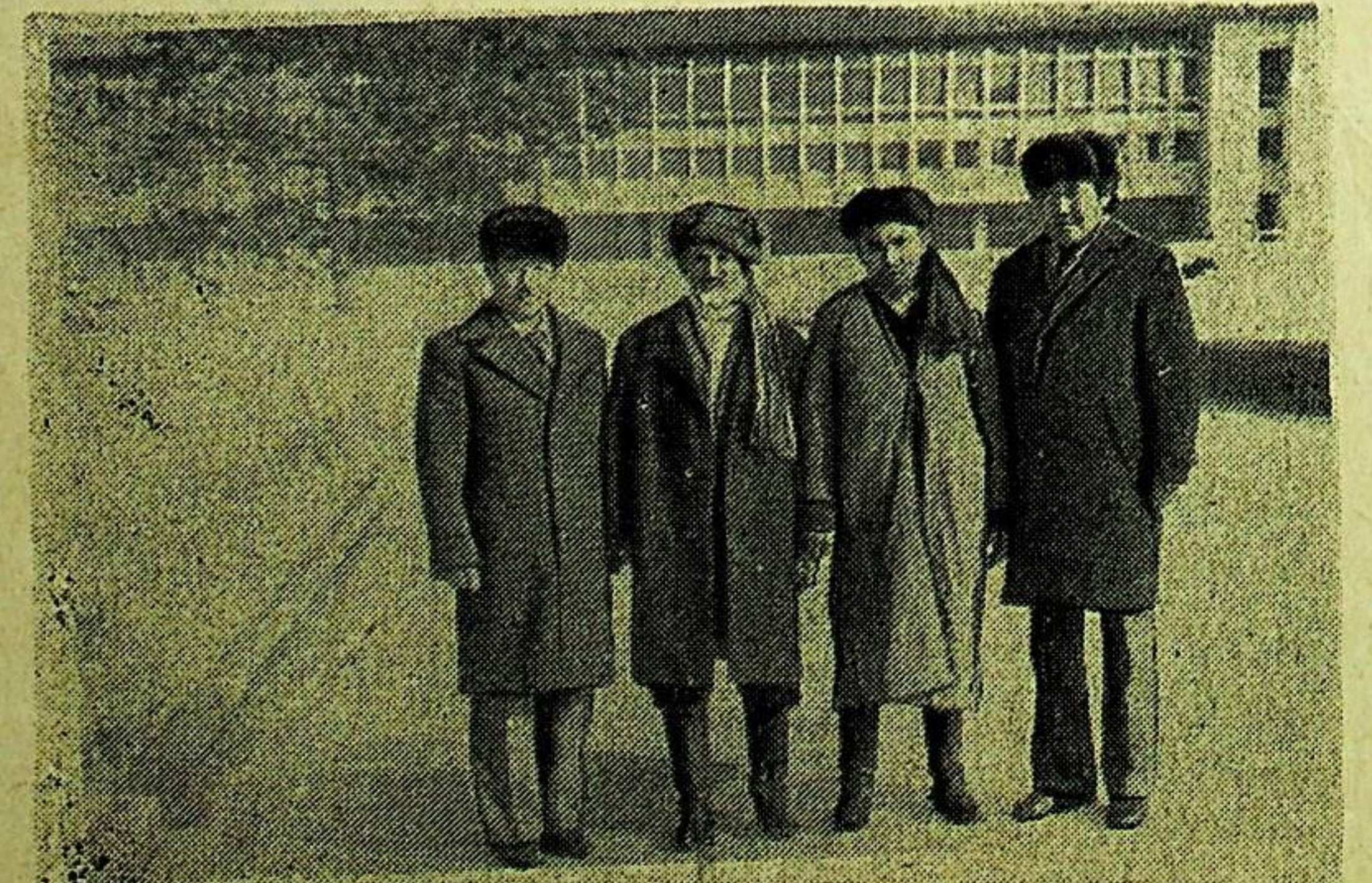
سۈرەتتە: ئاۋغانىستانلىق مېھمانلار ئۇ لۇق قازاق شائىرى ئابىي ھەيكىلى ئالدىدا.

يېڭى ئاپتورۇرگىزىل قازاقىستان پايتەختىنىڭ مەركىزىي كوچى- لىرىنىڭ بىرسىدە شەھەرلىك ئاپتورۇرگىزىل ئىشقا چۈشۈرىلدى. يولۇچىلار بۇ جايدىن خالىغان ۋاقىتتا بىلەت سېتىۋېلىش ئىمكانىي- تىگە ئېگە. ئۇلارنىڭ ۋەزىپىسى تاقىلىرىنى روي- رويخەتكە ئېلىش ۋە ئۇلارنى سامولىوتقا جۈنئىتىش يولغا قويۇلغان. بىزنىڭ مېھمانلىرىمىز يېقىندا ئاۋغانىستاندا ئىستىقامەت قىلغۇ- چى ۋە تەنداشلىرىمىزدىن كۆشپەر ئاشۇر نوغ- لى ۋە تاللاپ ئىسمائىل نوغلى ئاتا ماكانى چىم- كەنت ئوبلۇسى، چاردارا رايونىدا تۇرۇش- لۇق تۇققانلىرىغا مېھماندارچىلىققا كەلدى. ئۇلار ئەل- ۋىتىنى زىيارەت قىلىپ، جۈم- ھۇرىيىتىمىزنىڭ پايتەختى ئالمۇتقا قەدەم تەشرىپ قىلدى. قازاقىستان «ۋەتەن» جەم- يىتىدە مېھماندا بولدى. «بىزنىڭ ۋەتەن» گېزىتى خادىملىرى بىلەن سۆھبەتلەشتى ۋە ئاۋغانىستاندا ئىستىقامەت قى- لىدىغان ۋە تەنداشلىرىمىزنىڭ سوغال- سالام، ئارزۇ- تىلەكلىرىنى يەتكۈزدى. مېھمانلار پايتەختىمىزنى بىر قانچە كۈن ئارىلاپ، ئۇنىڭ كۆركەم پەزىلىتىنى، گۈزەل كوچا- مەيدانلار، ئىمارەتلەرنى، مەدەنىيەت مەھكىمىلىرىنى كوردى.