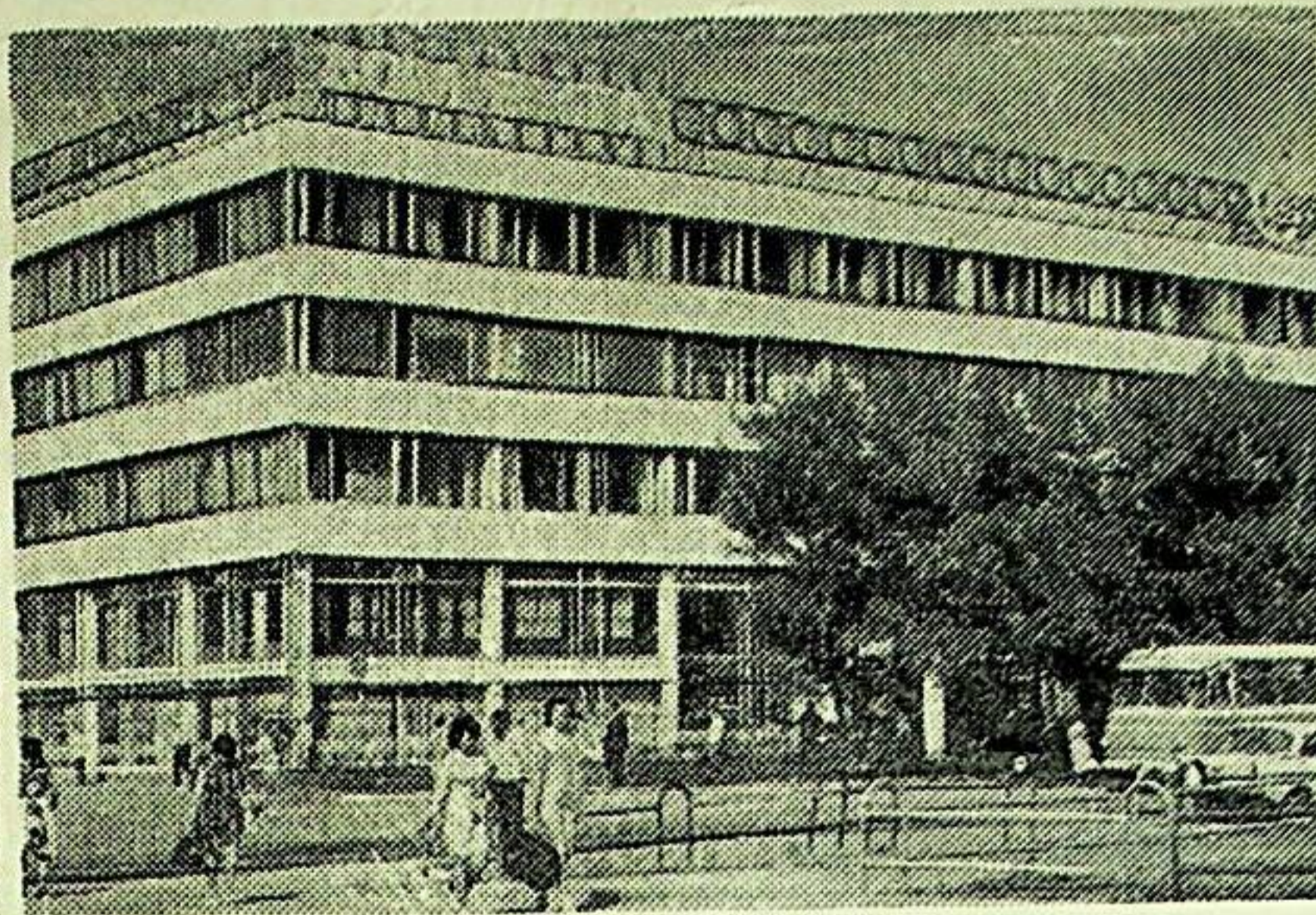
ئوسكېمېن شەھىرىدىكى مەيىشى خىزمەت ئويى ۋە تۇرۇشلۇق ئويلەر.