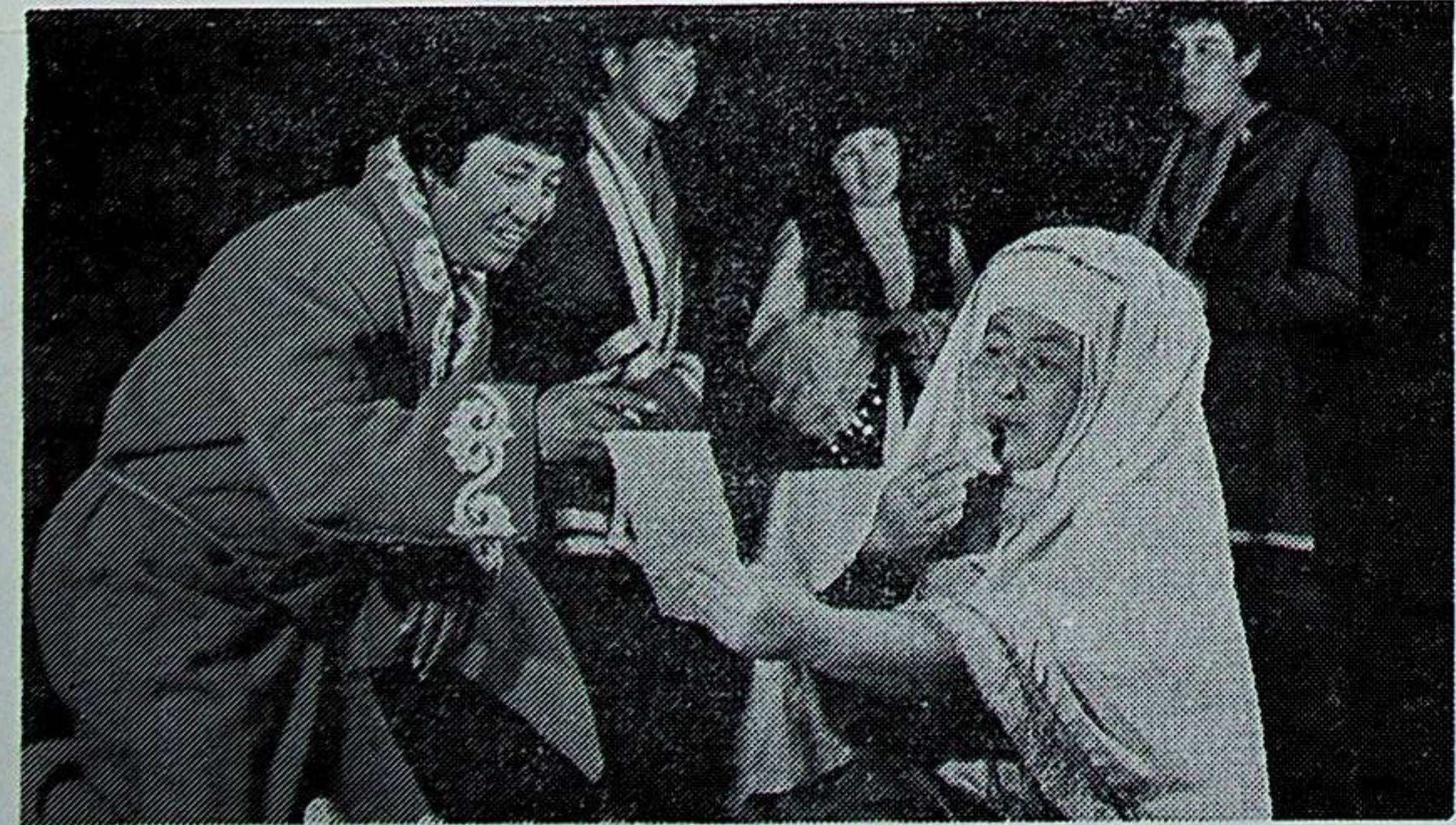
شېمالىي قازاقىستان ئوبلاستى، «ئارال ئاغاچتىكى» خەلق تېئاترى ئارتىستلىرى

لغا ئالدى. شۇنىڭ بىلەن بىرگە مىللىي ئەپلىشىش ھەققىدىكى تەكلىپنى ھېچ كىم خوشالمىق بىلەن قارشى ئېلىۋاتقىنى يوق، ئەكسىچە ئۇنى ئىنكار قىلغانىمىش، دېگەن مەزمۇندىكى تەبىرلەر بېرىلگەن ماقالىلار چىقىشقا باشلىدى. جاھانگىرلار ئاۋغانىستان ھۆكۈمىتىنىڭ سەياسىتىگە تەشۋىقات ۋە ئىستىلا بىلەنلا قارشىلىق قىلىپ قالماستىن، بەلكى ئامېرىكا قوشما شتاتلىرى تەتۈر ئىنقىلاپچىلارغا ھەر ۋىلى يېرىم مىللارد دوللارغا يېقىن ئىختىسات ئاجرىتىپ، ئەتراپلىق ياردەم بېرىپ تۇرىدۇ، دەپ ئېلان قىلدى. جاھانگىرلارنىڭ ۋە ئۇلارنىڭ ئەگەشكۈچىلىرىنىڭ سەياسىتى ئاۋغان خەلقىنىڭ ۋە نازىيە قىتئەسىدىكى باشقىمۇ خەلىقلەرنىڭ مەنپەئەتلىرى بىلەن؛ دۇنيادا تېجىل مەنپەئەتلىرى بىلەن چىقىشالمايدۇ. شۇڭلاشقا، مۇ، ئۇلار تەبىي ھالدا تۇيۇق يولغا كىرىپ قالىدۇ.