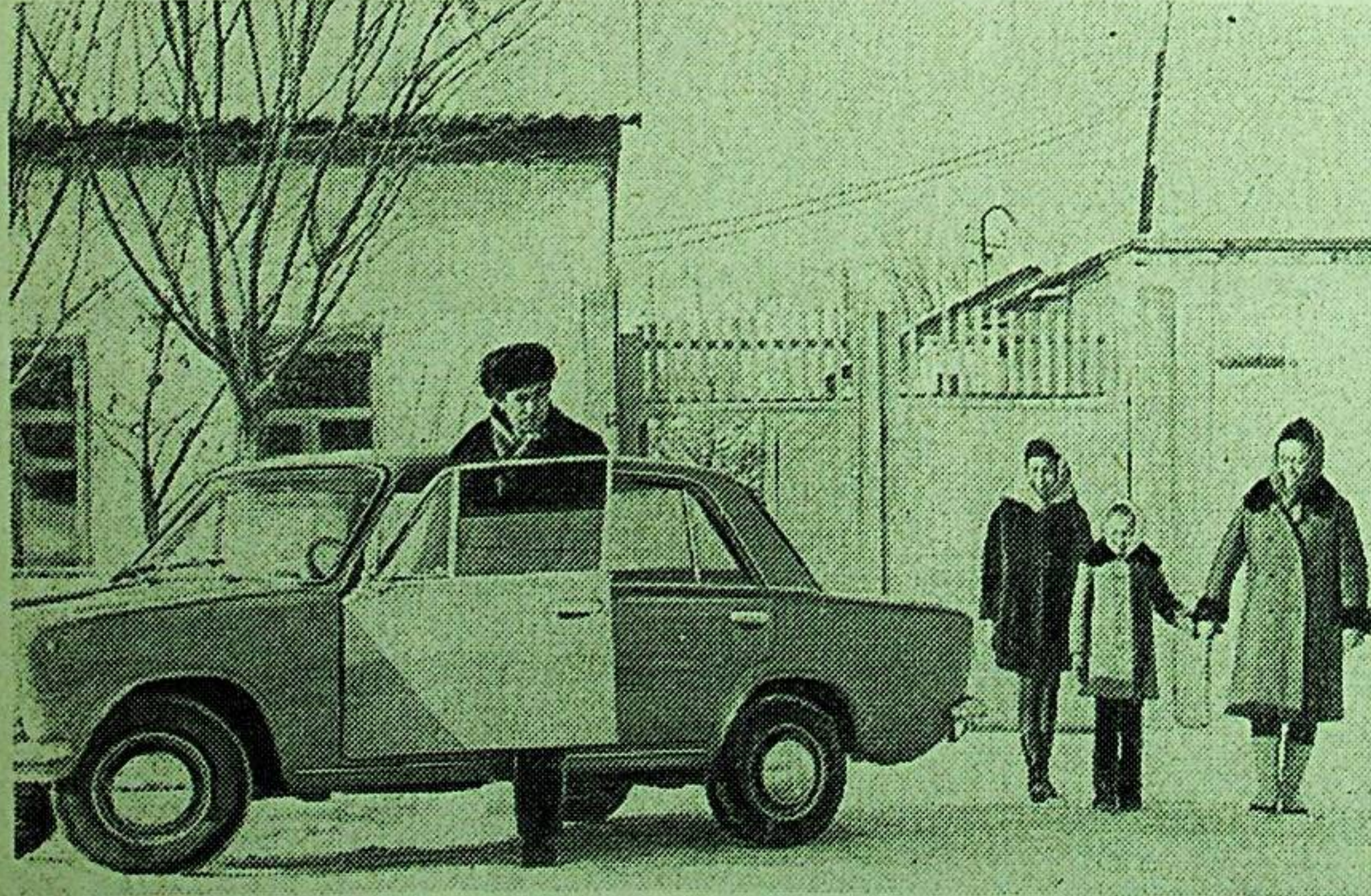
خۇسۇسىي «ئىگۈلى» بولۇپمۇ سەيلىگەنەپلىك.

ئەمگىكىمىز ئېتىۋارسىز قالمىدى. بىر نەچ-چە ئوردېن ۋە مېداللارغا سازاۋەر بولۇق. ئوزەمنىڭ چوڭ خۇسۇسىي ئويۇم، «ئىگۈ-لى» ماشىنام بار. پاراۋەن تۇرمۇش كە-چۈرمەكتىمىز. ئۈچ بالام مەكتەپتە تېكىن ئوقۇپ بىلىم ئالماقتا، ئەڭ كەنجىمىز بالىلار باغچىسىدا تەربىيلىنىۋاتىدۇ. تورت بولۇم-لۇك قوتلۇق-خانمىز ھەر خىل بېسات-