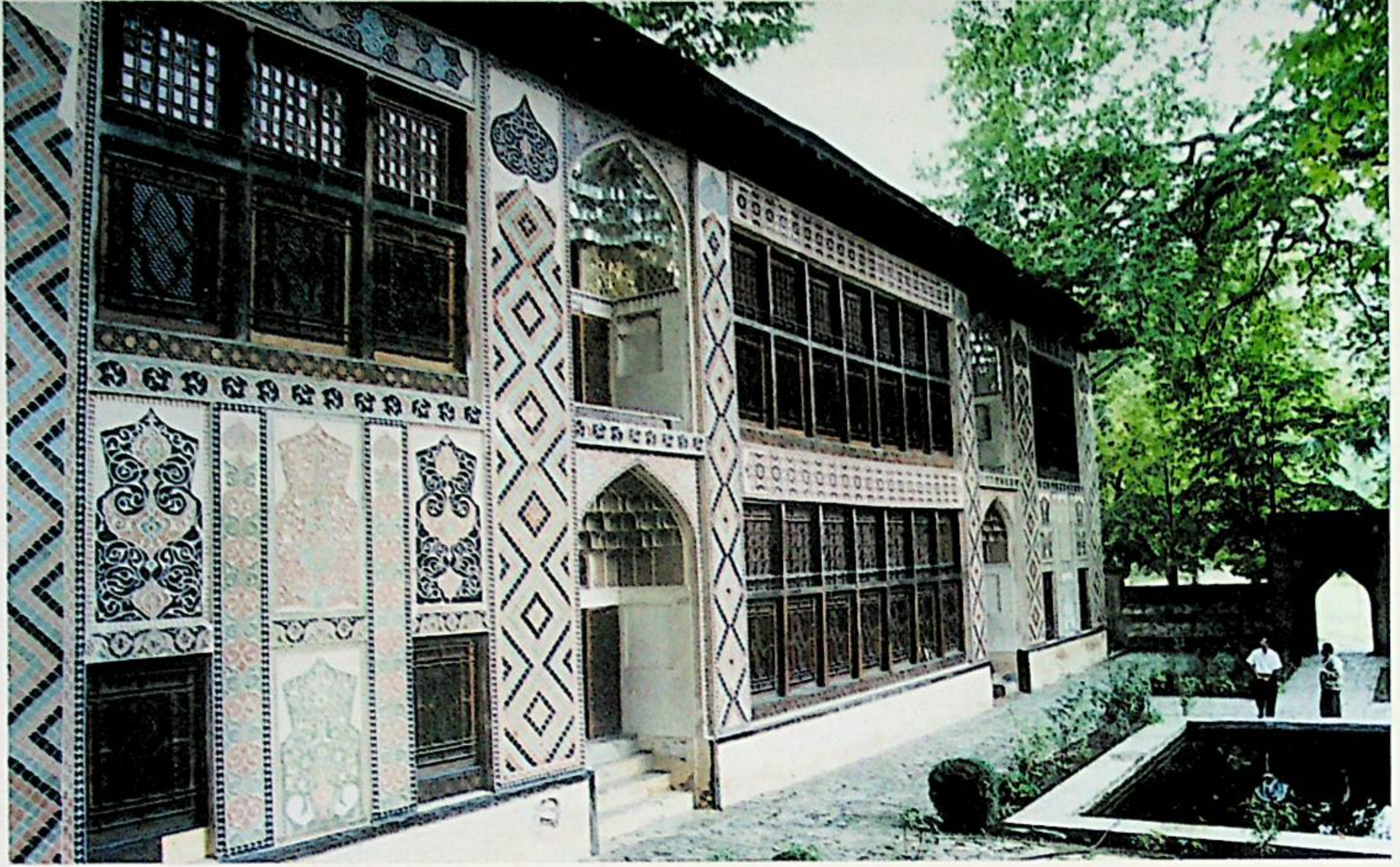
ŞƏKİ XAN SARAYI (XVIII əsr)