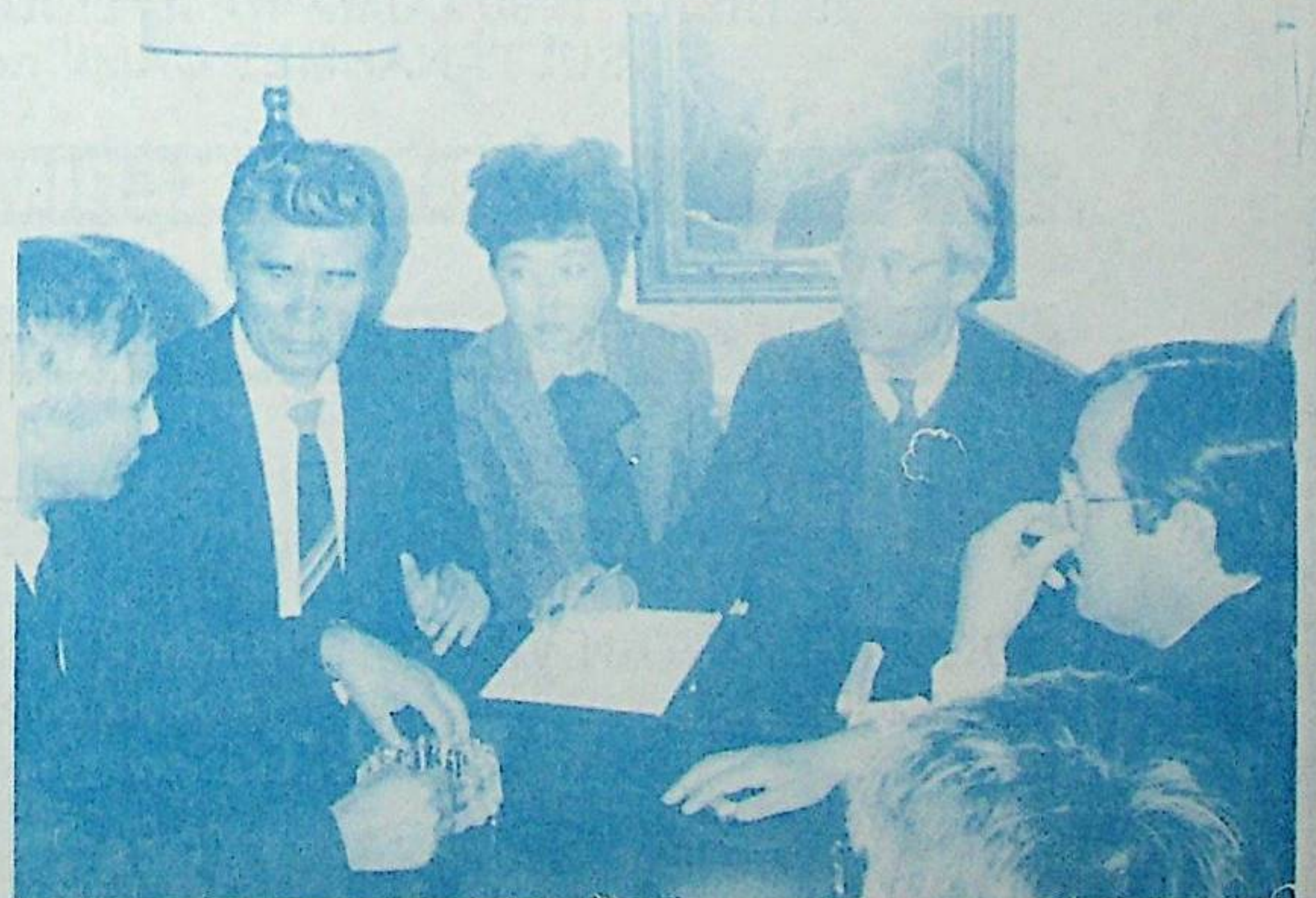
Nevada Semey Teşkilatı'nın temsilcileri Sağlık Bakanımız ile görüşürken