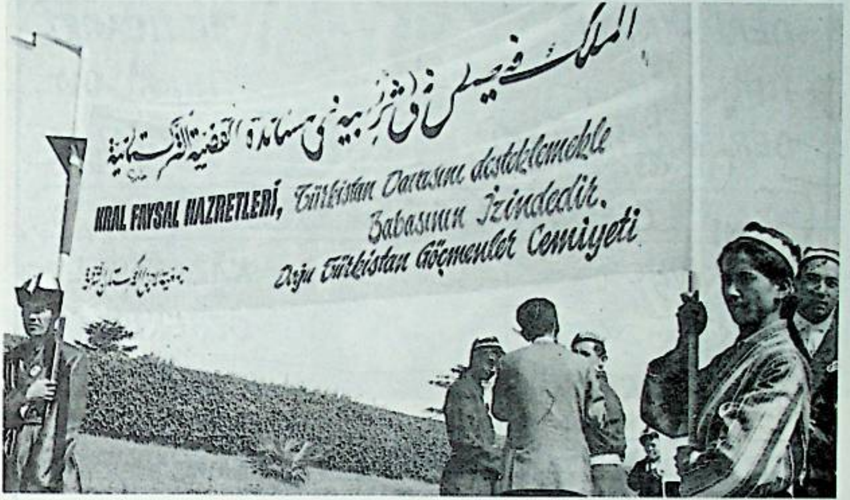
1966 yılında ülkemizi ziyaret eden Suudi Arabistan Kralı Faysal, derneğimiz tarafından törenle karşılanırken.