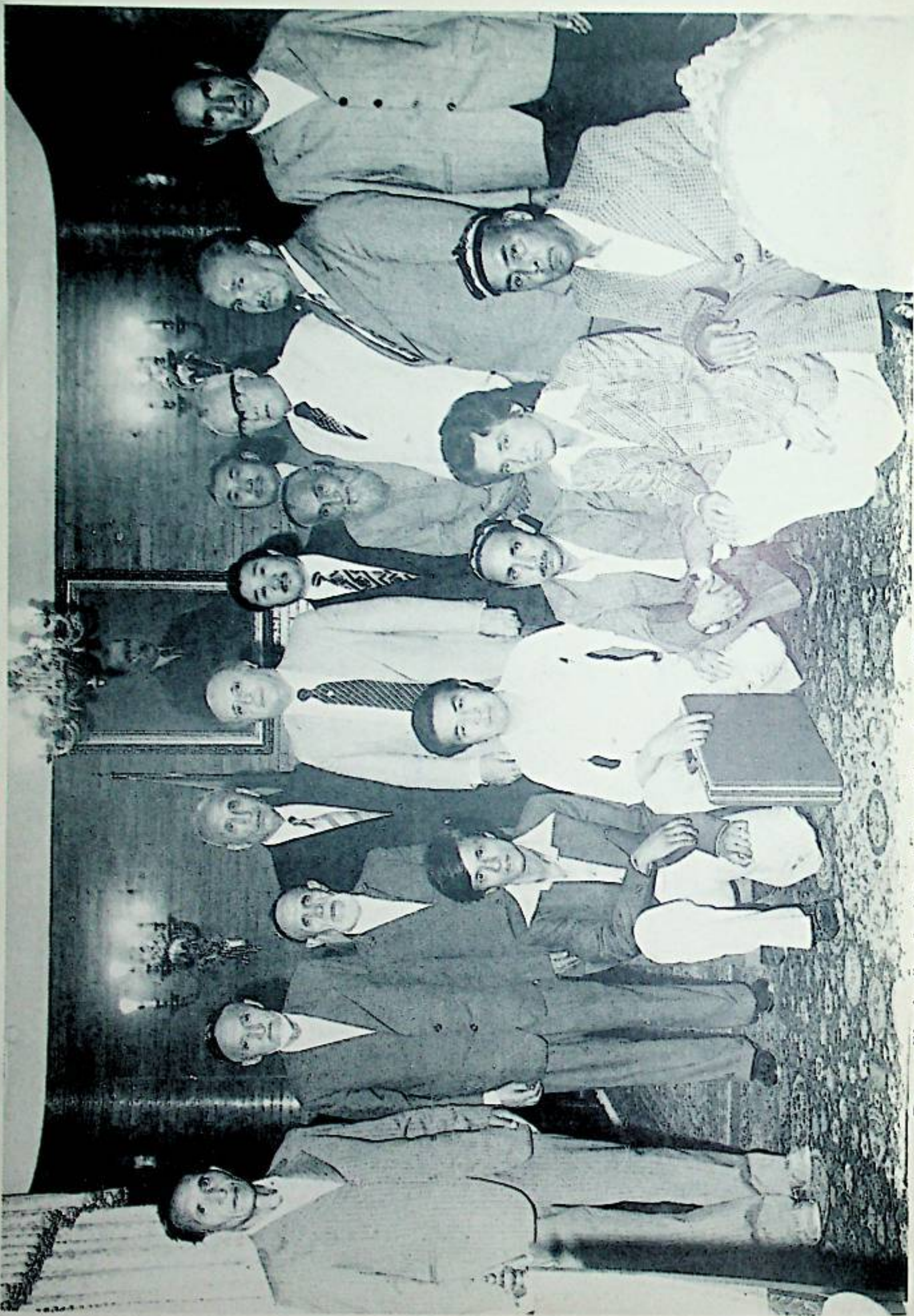
Demegimlz uyeeler Bařbakanlıkta Sayın Suleyman Demirel ile birlikte goruluyor.