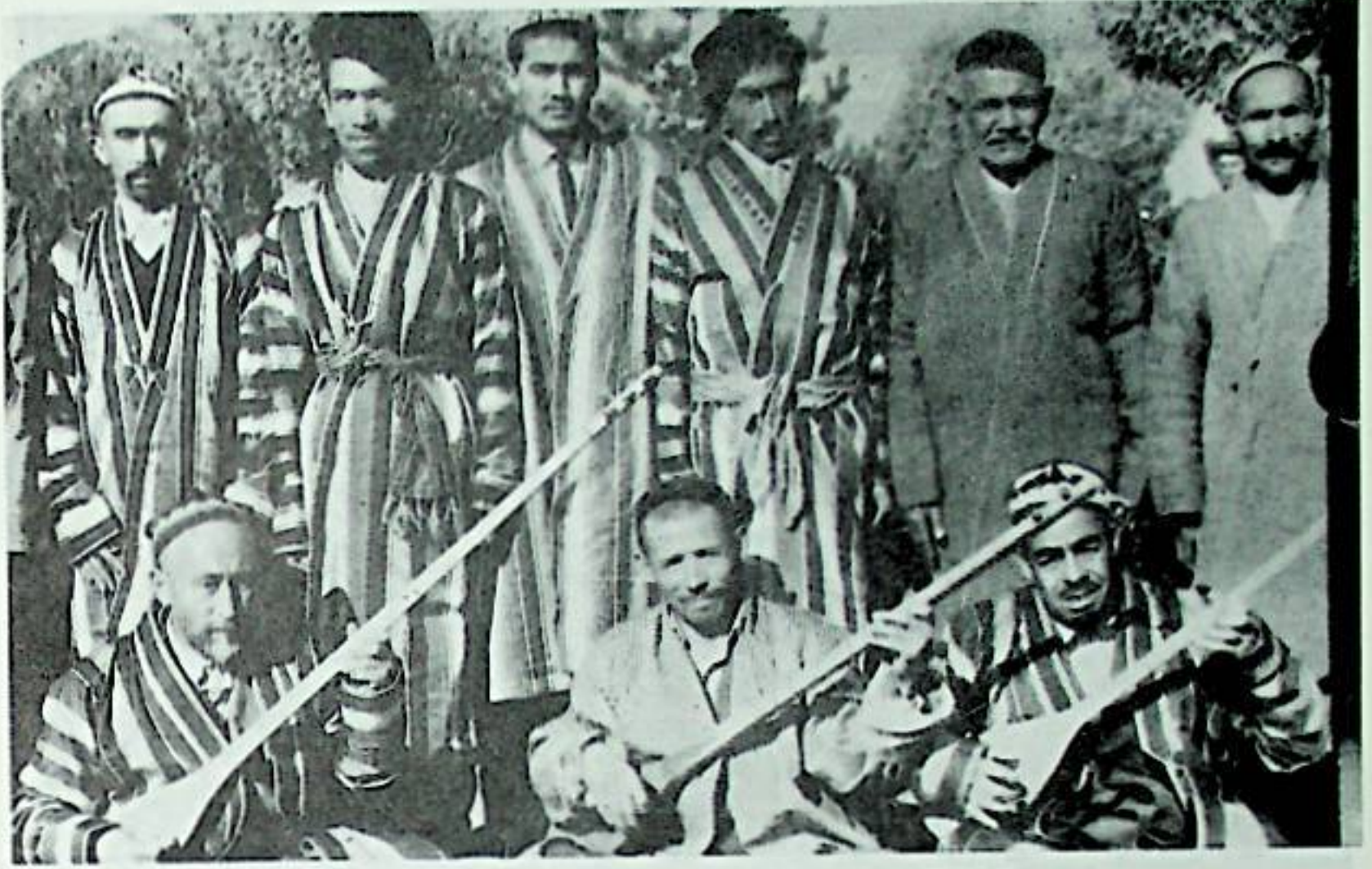
Türkiye'de oluşturulan İlk Doğu Türkistan Folklor Ekibi