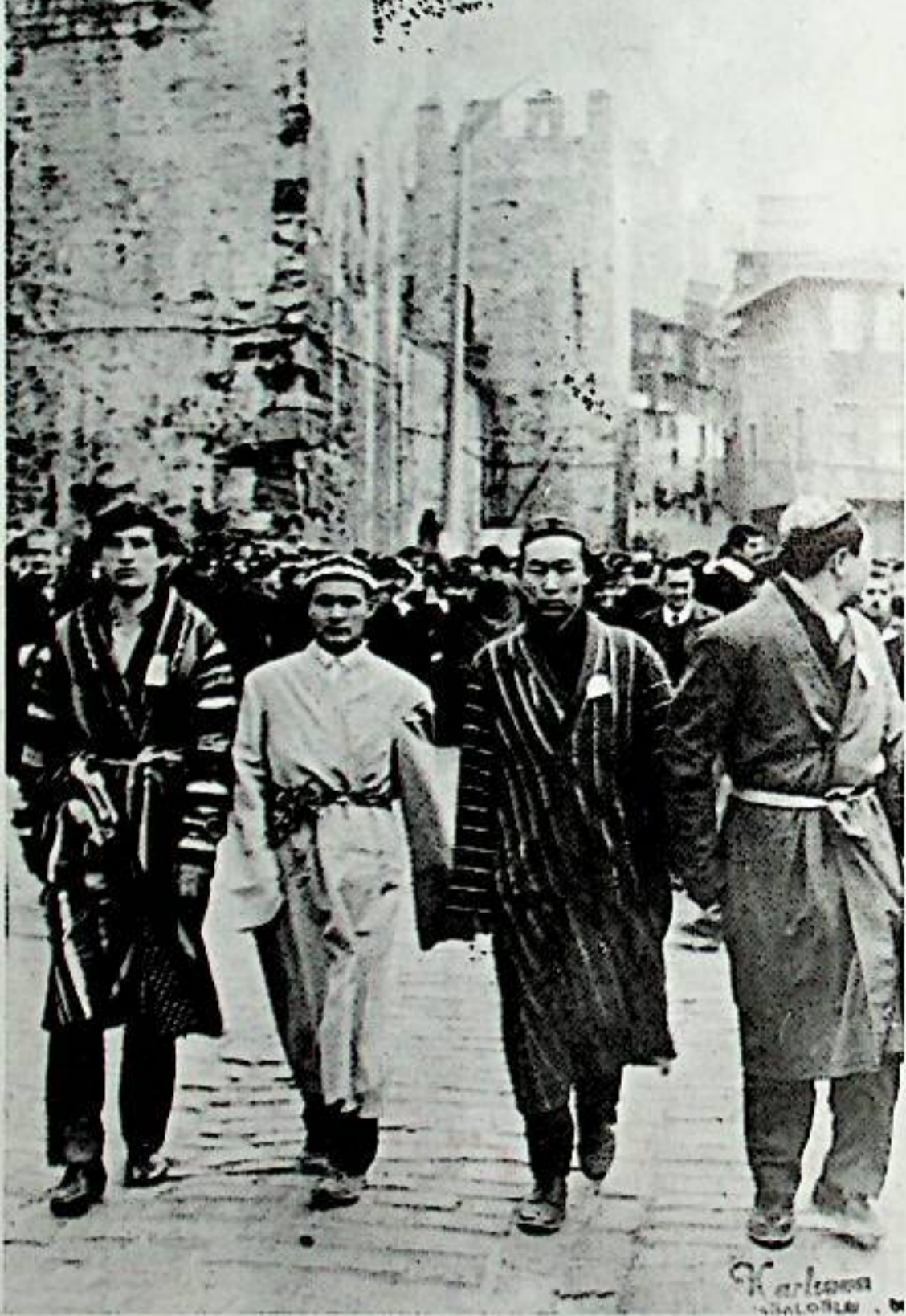
Derneğimiz üyeleri 25 yıl önce İstanbul'da Şahlanış Miting'inde Komünizmi tel'in ederken

Parkistan'lılar Şahlanış Mitingi - de Komünizmi tel'in ederken.