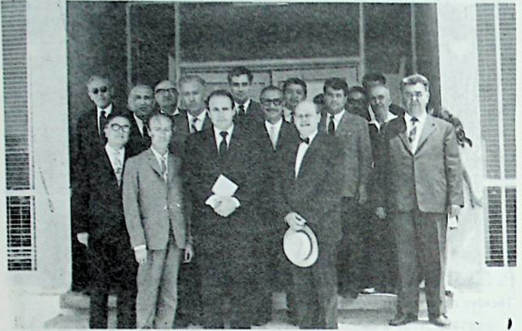
Demeğimiz tarafından İstanbul'da karşılanan Ağa Han ve üyelerimiz