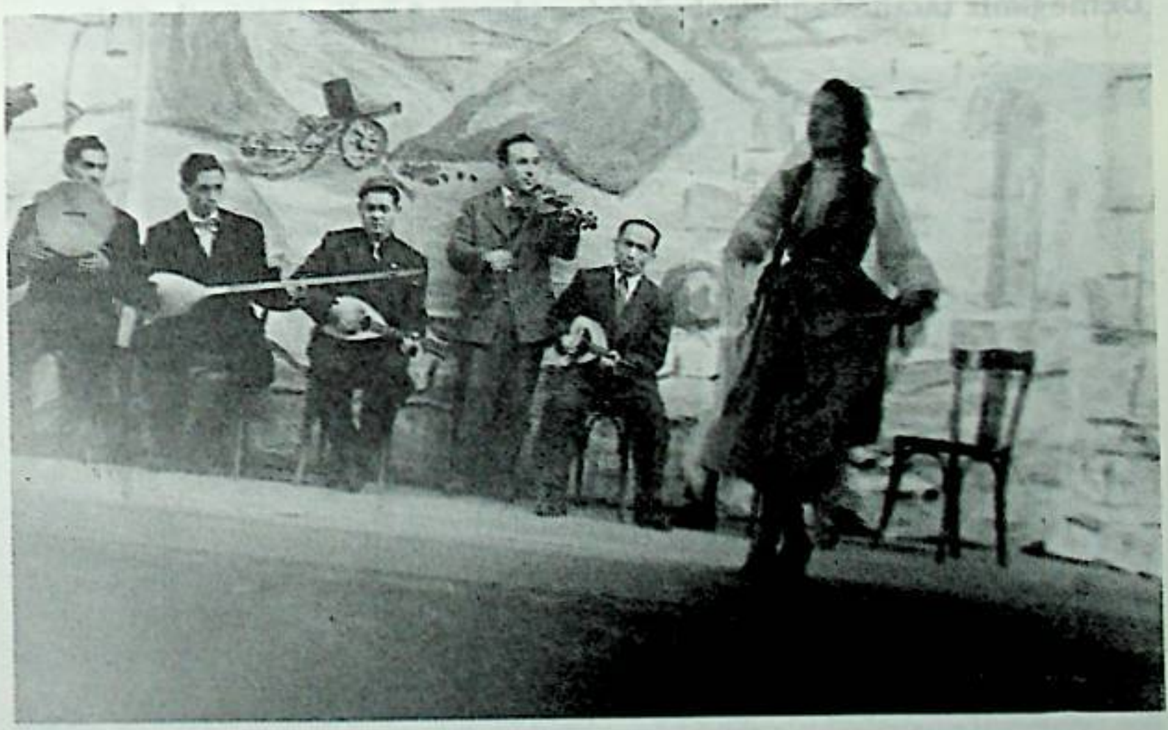
Doğu Türkistan Folklor Ekibinin bir gösterisi