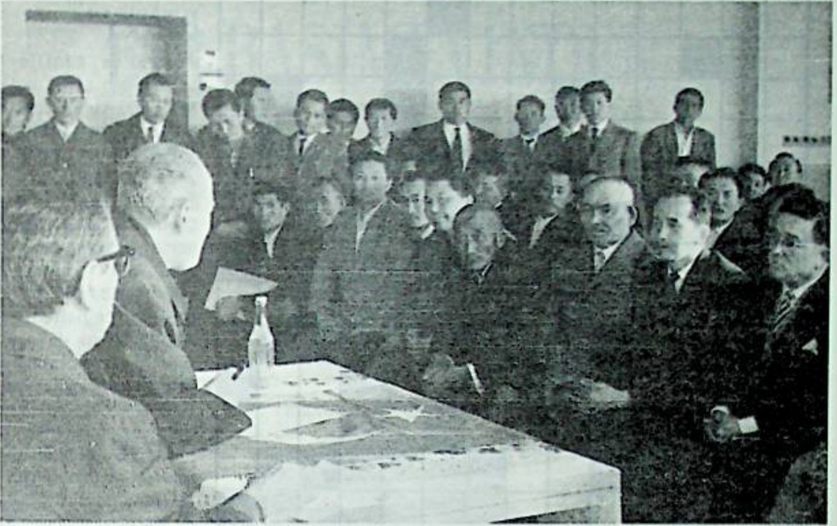
Ağa Han, Derneğimiz üyeleri ile sohbet ederken...