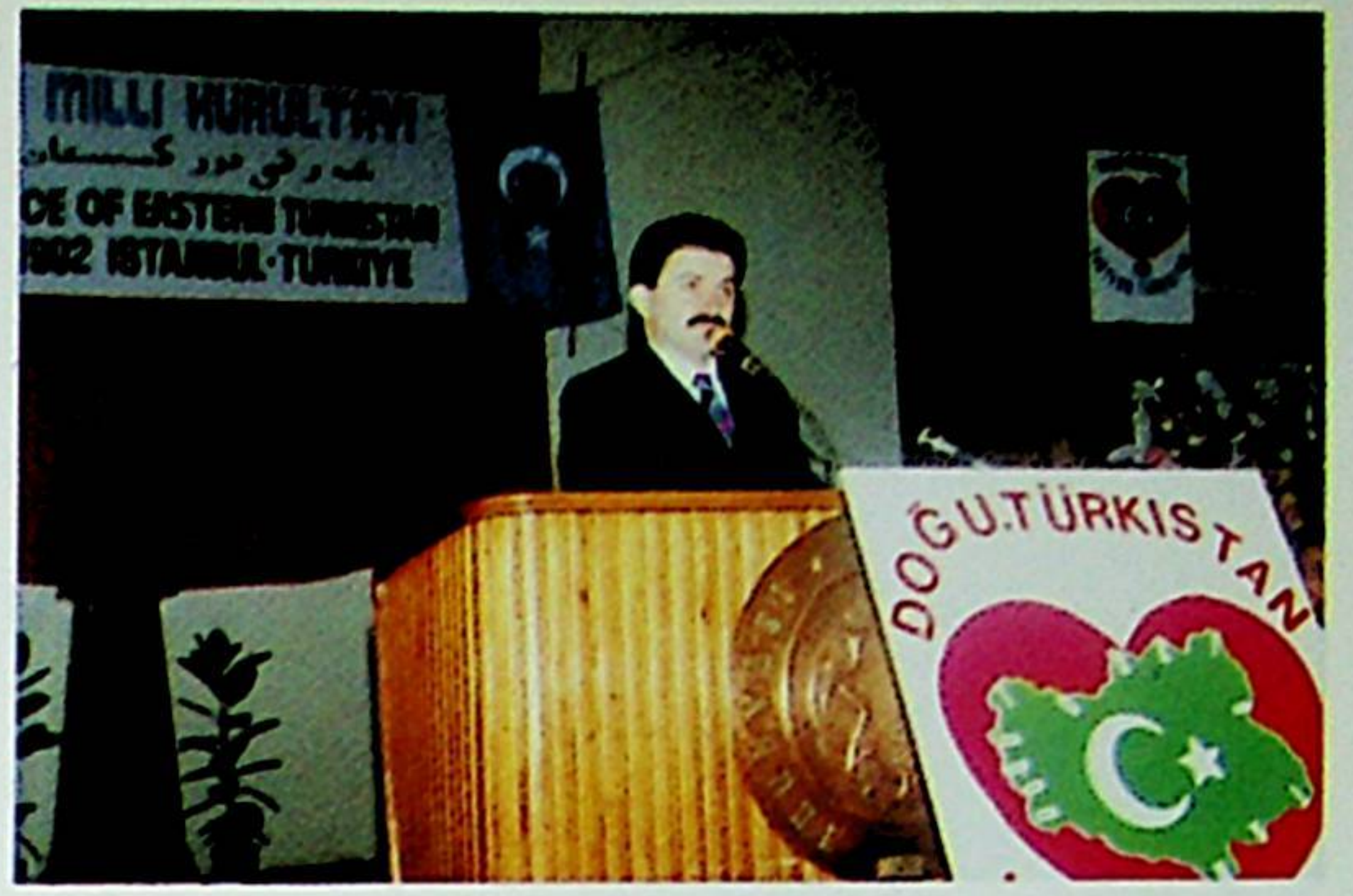
Başbakanlık Baş Danışmanı Büyükelçi Namık Kemal Zeybek