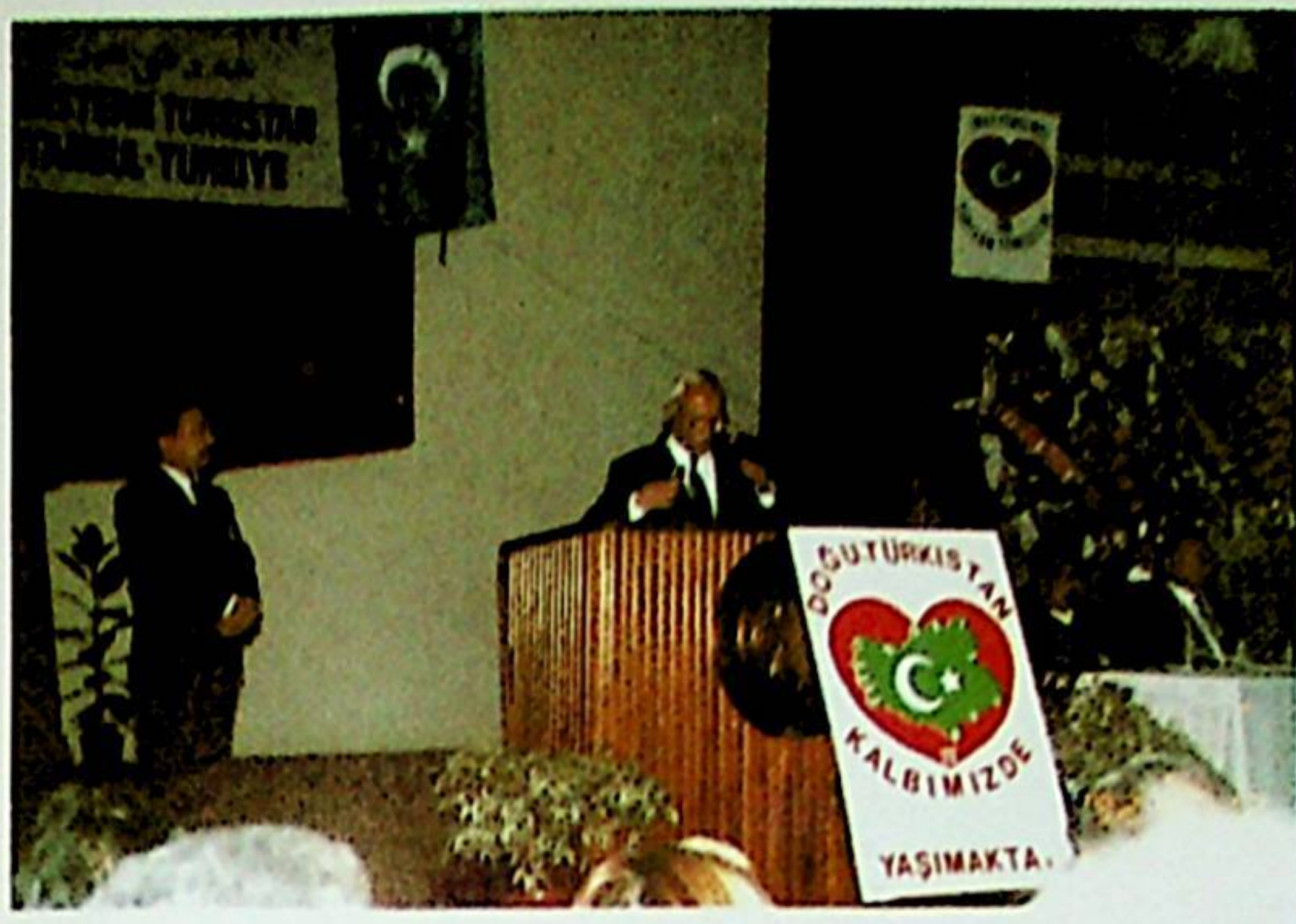
Vakıf Başkanı Em.General M.Rıza BEKİN