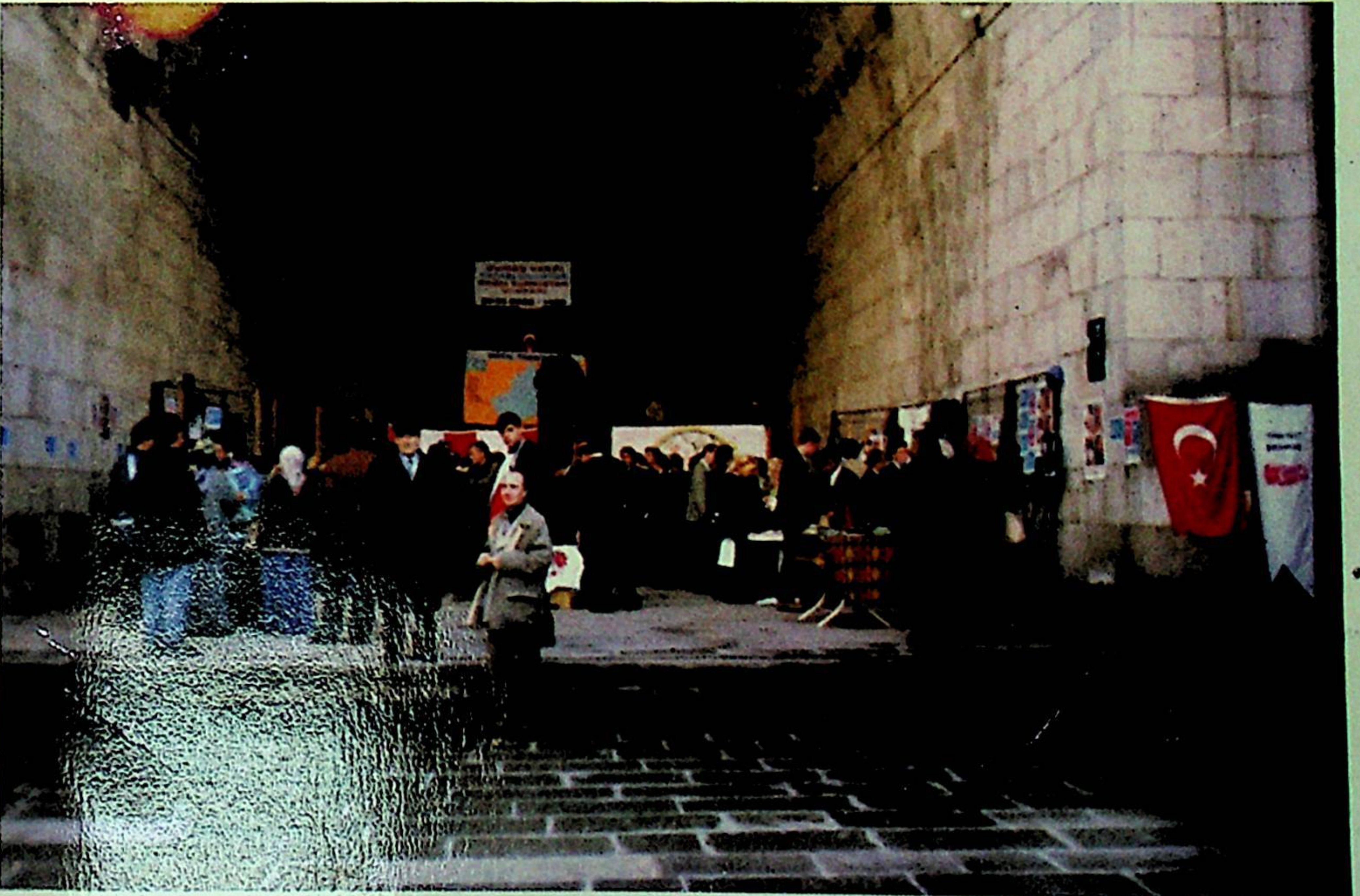
Doğu Türkistan Günleri Kültür ve Sanat Etkinlikleri çerçevesinde Doğu Türkistan Sergisi açıldı. Çifte Minareli Medrese Erzurum.