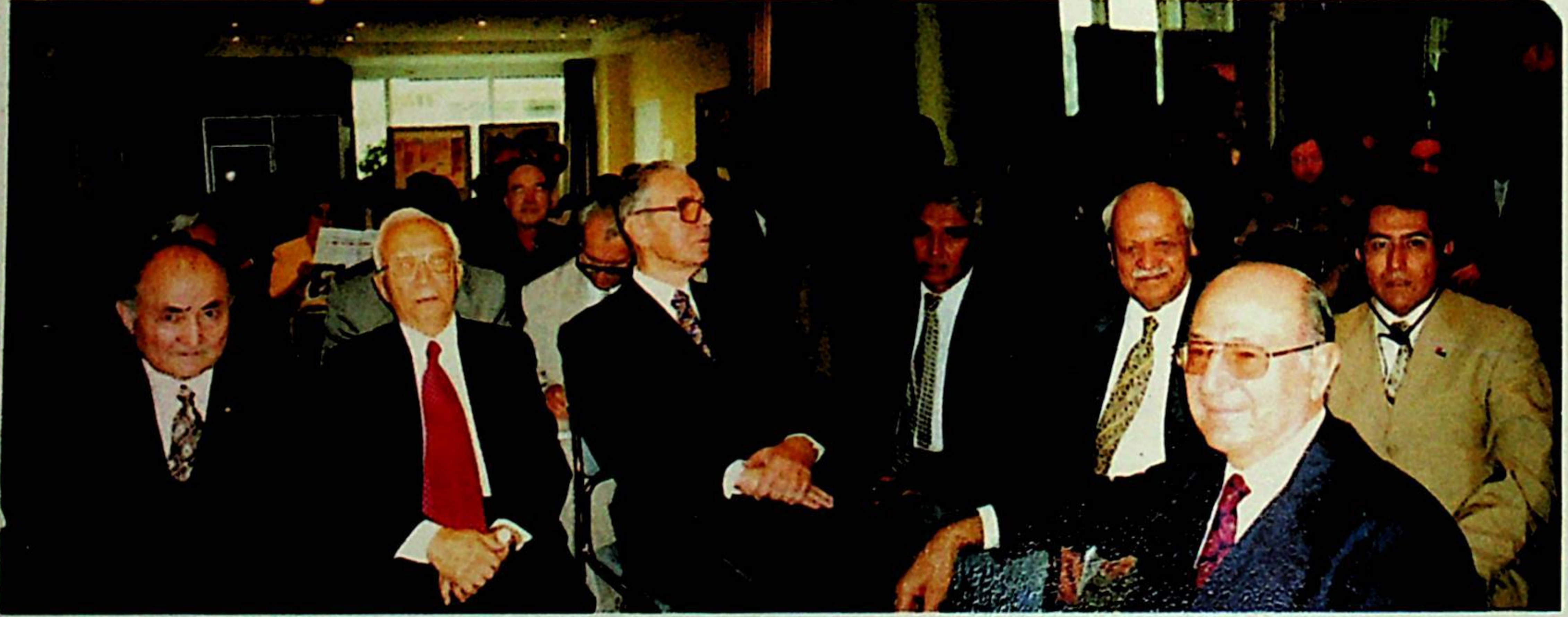
Doğu Türkistan Milli Kurultayı'ndan görüntüler.