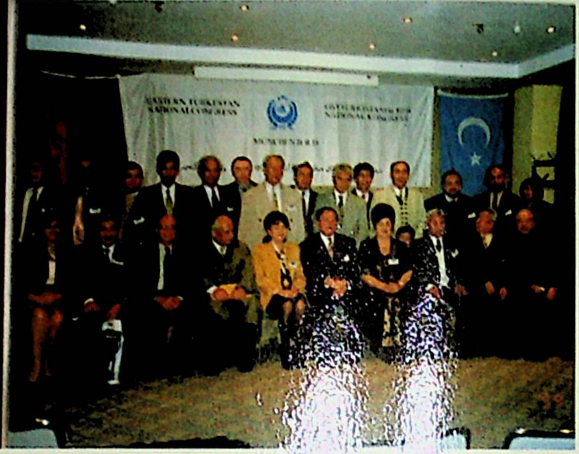
11 Ekim 1999 tarihinde yapılan Doğu Türkistan'da İnsan Hakları İhlalleri Sempozyumu ve II. Doğu Türkistan Milli Kurultayı'na katılan delegeler