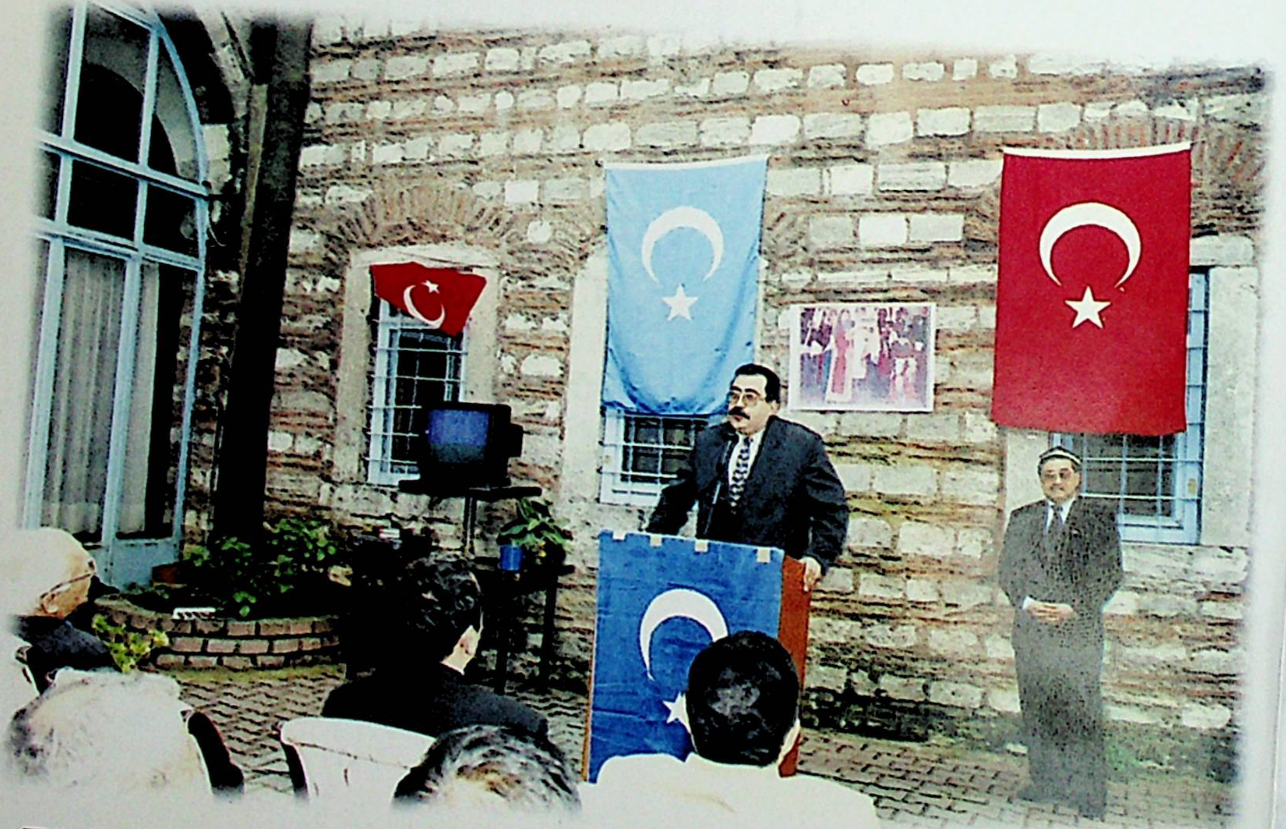
Türk Ergenekon-Nevruz Bayramı Doğu Türkistan Vakfı'nda coşku ile kutlandı.