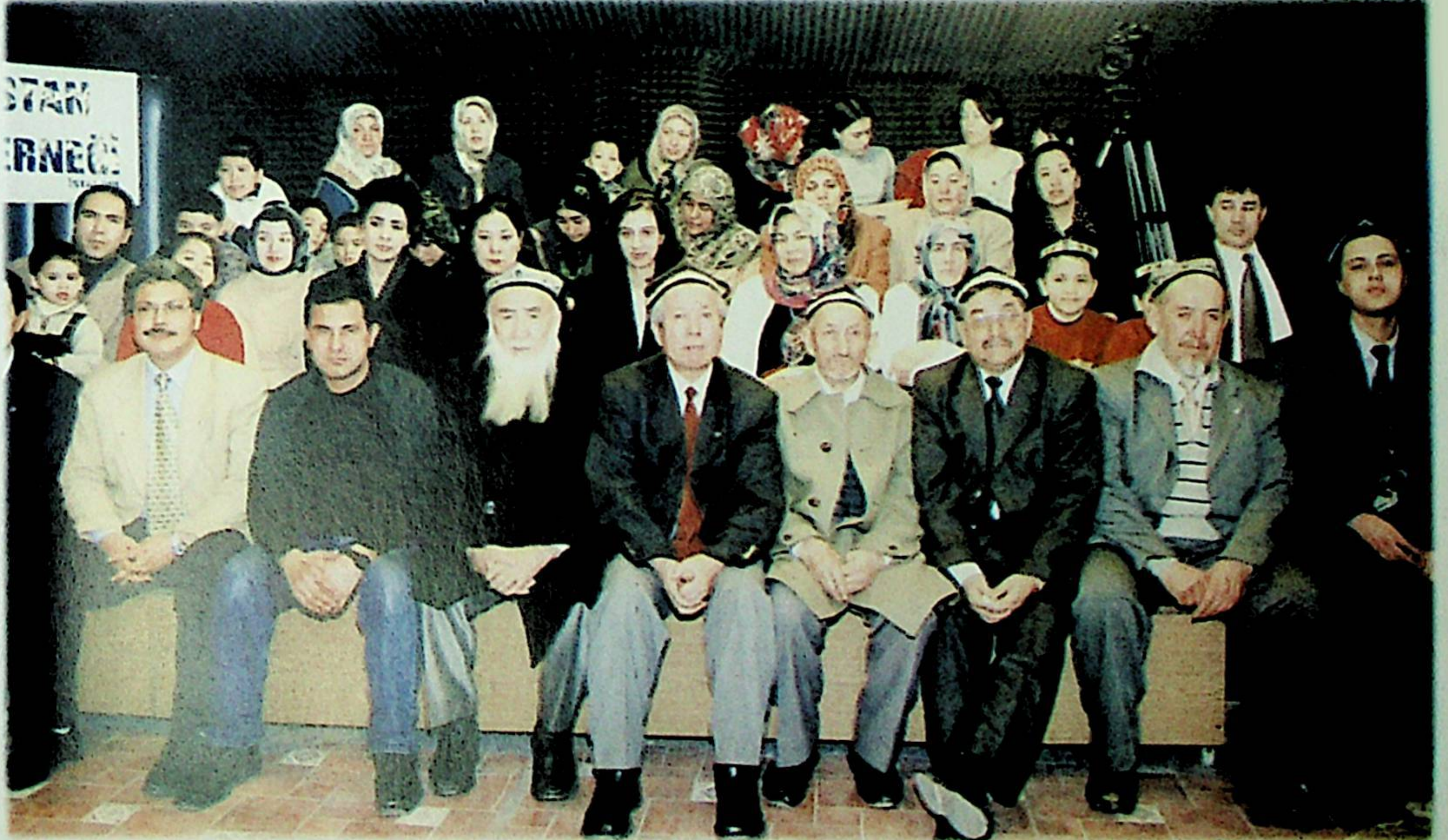
Doğu Türkistan davası Meltem TV'de yayınlanan "Tuna Boyları" programında bir kez daha gündeme getirildi.