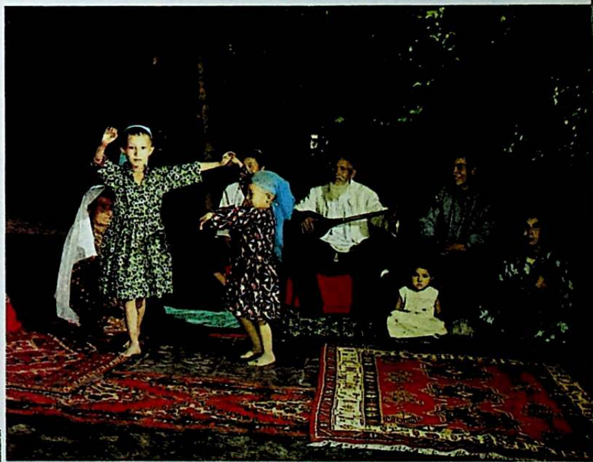
عائلة ويغورية يغمرها الفرح والسرور