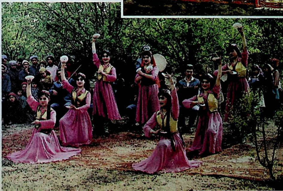
الرقص والغناء بين الاشجار