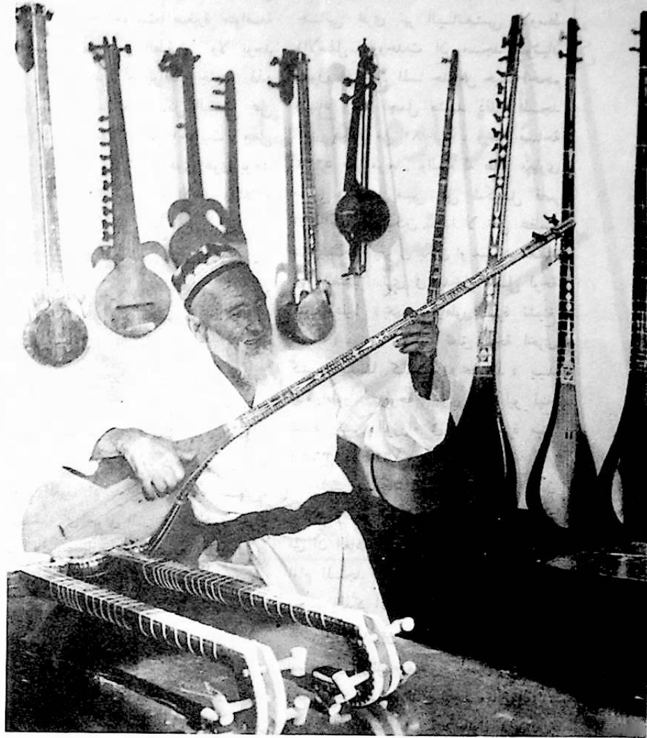
مطرب مسن يفتي «موكام»

وذكائهم . كما ابدعوا فنون الرقص والغناء المتنوعة المبهرة التي ذاع صيتها داخل الصين وخارجها ، مع اصوات جرس الجمل التي كانت ترن على طول طريق الحرير القديم . لقد بدأ تبادل رقص وغناء شنيجيانغ مع مناطق الصين الاخرى منذ زمن بعيد ، حيث انتشر رقص يونيتان الذي تصحبه الموسيقى الى سهوب اواسط الصين في اسرة هان في القرن الثاني قبل الميلاد وعرض في البلاط الامبراطوري . وفي القرن الرابع ، انتشر الرقص والغناء في منطقة قويتسي