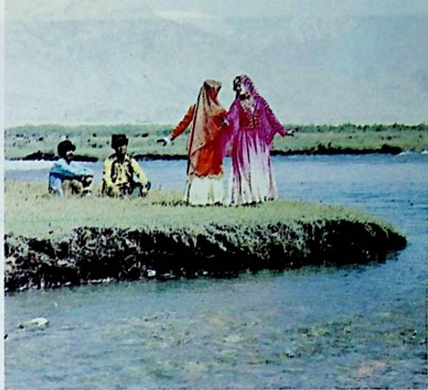
الشباب التاجيكون يعبرون عن افتخارهم ببلدهم الشهير بالغناء