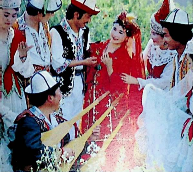
ممثلون شبان من قومية القوزاق