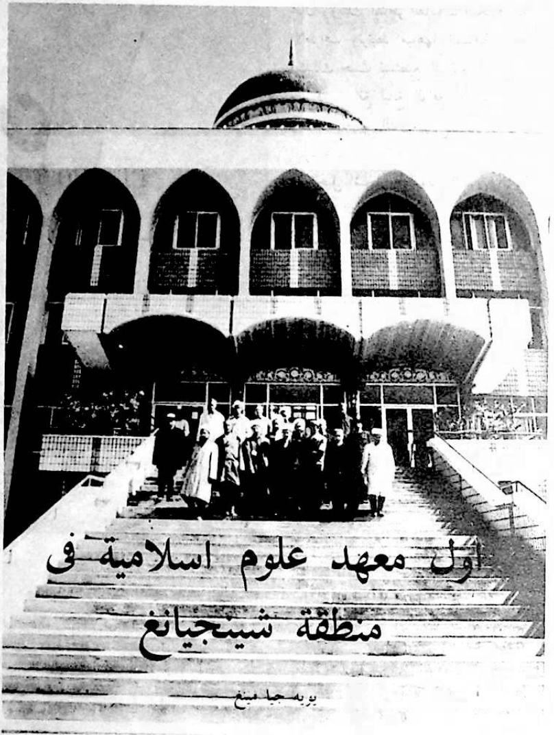
صورة تذكارية لبعض المدرسين والطلاب امام باب المعهد