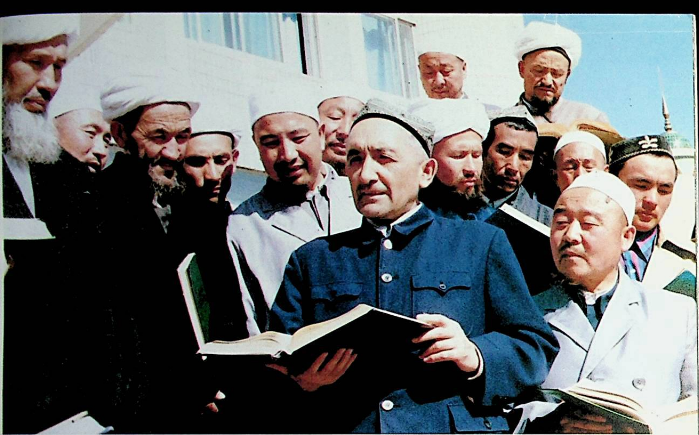
مدير المعهد (الوسط) يساعد الطلاب في فهم القرآن الكريم