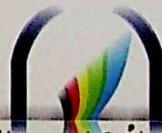
المركز الأكاديمي للأبحاث