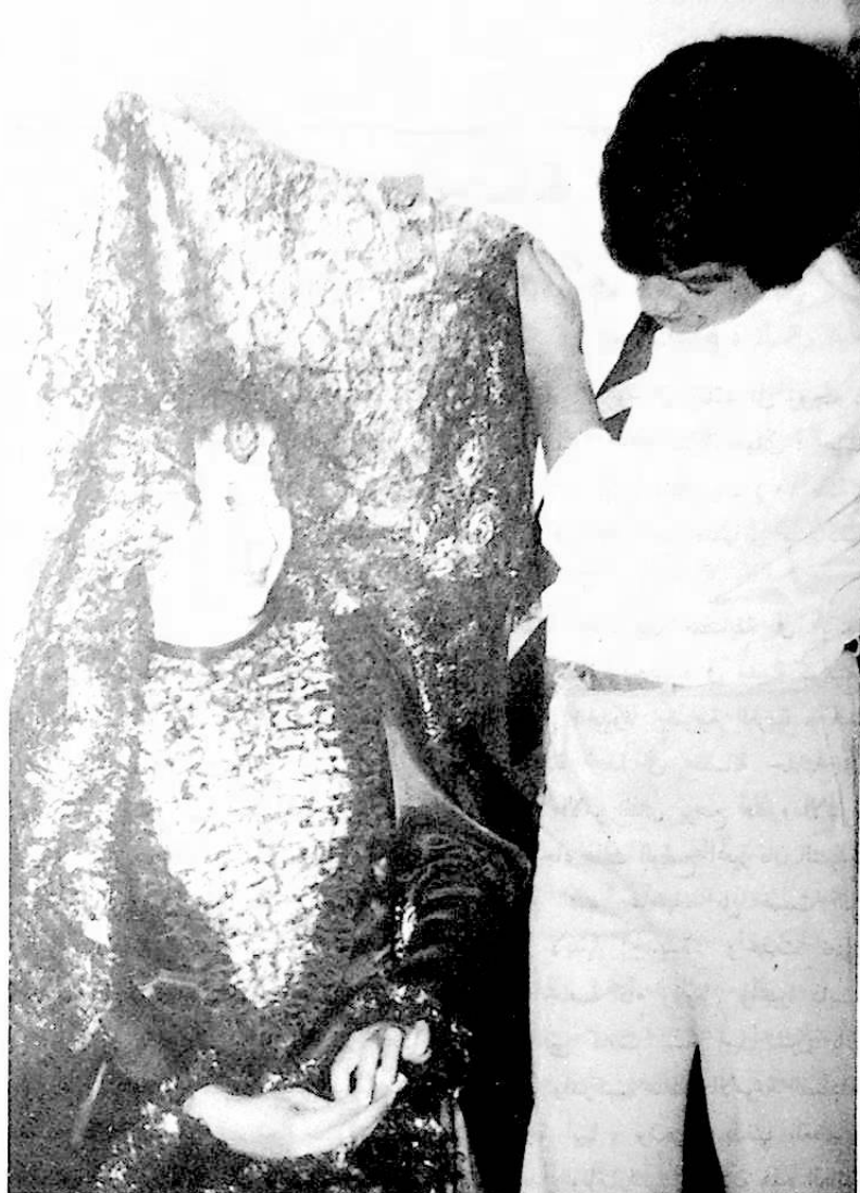
العريس يرفع «الطرحة» على وجه العروس

الاختيار. ويعتبر الويغوريون انه اذا كانت الام جيدة فابنتها ستكون جيدة مثلها ، فالبنت صورة عن أمها. وبعد اختيار العروس يذهب اقرباء والد العريس او الاصدقاء الى بيت العروس. وتجرى مراسم الزواج اذا وافق اهل الفتاة.