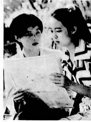
طالبان في المرحلة الثانوية