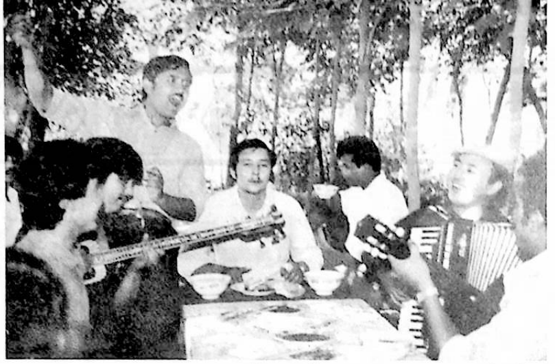
اصدقاء العريس يعبرون عن فرحتهم بالرقص والغناء

امام من قومية الويغور يتلو آيات من القرآن الكريم عند عقد القران