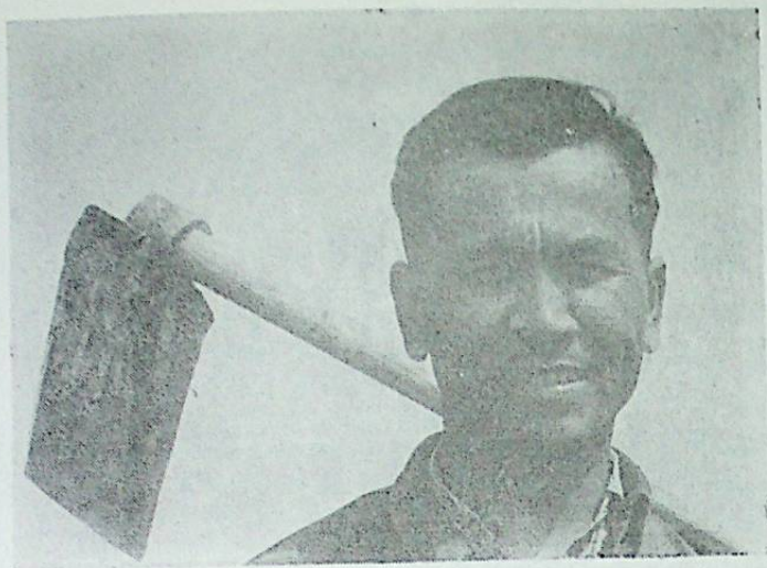
ئاپتور ئەمگەككە كېتىۋاتىدۇ.