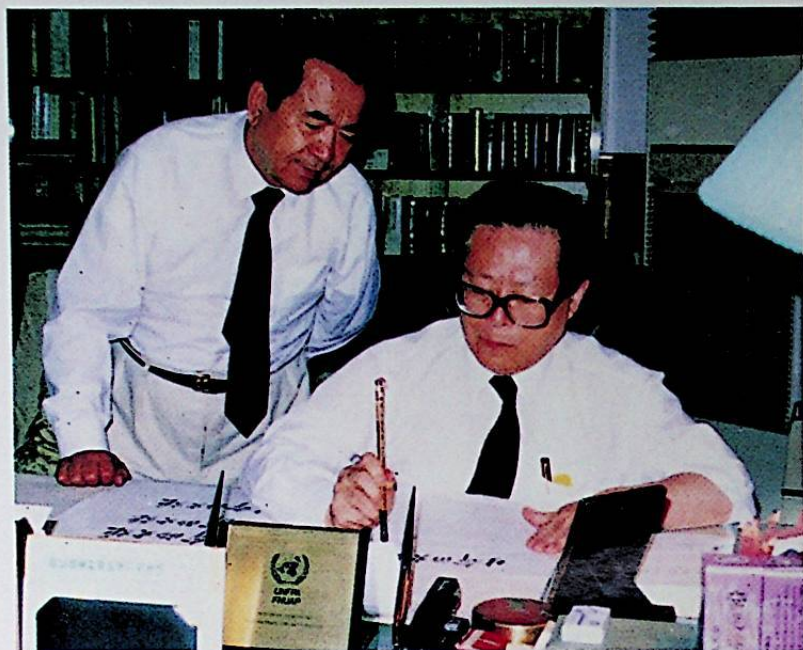
باش شۇجى جياڭ زېمىن ئاپتورغا مۇشۇ كىتابنىڭ ئىسمىنى يېزىپ بەردى.