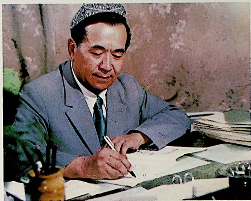
مۇشۇ كىتابنىڭ ئاپتورى تۆمۈر داۋامەت