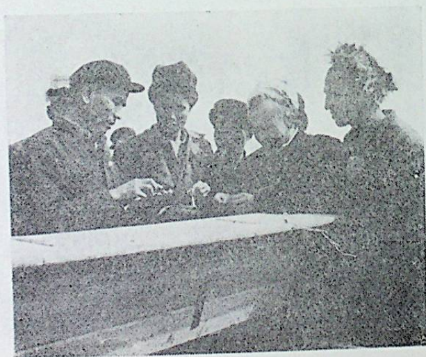
ئاپتور دېھقانلار بىلەن بىللە.