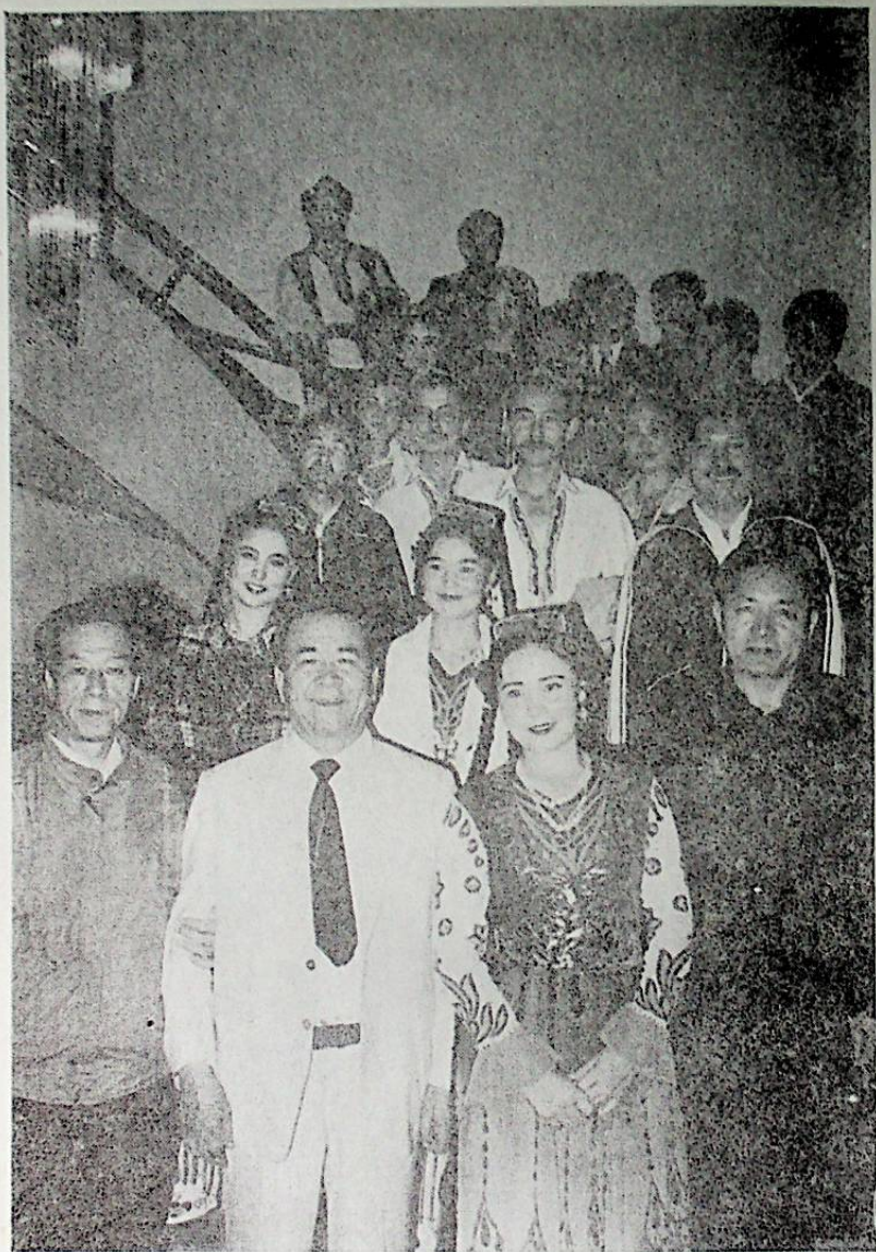
ئاپتور ئارتىسلار بىلەن بىللە (جۇخەي شەھىرىدە)