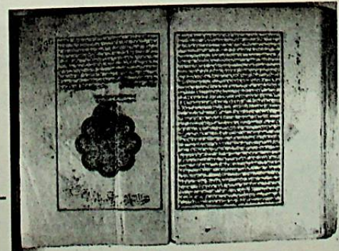
صورة الصفحة الأخيرة من مخطوط النسخة المعتمدة