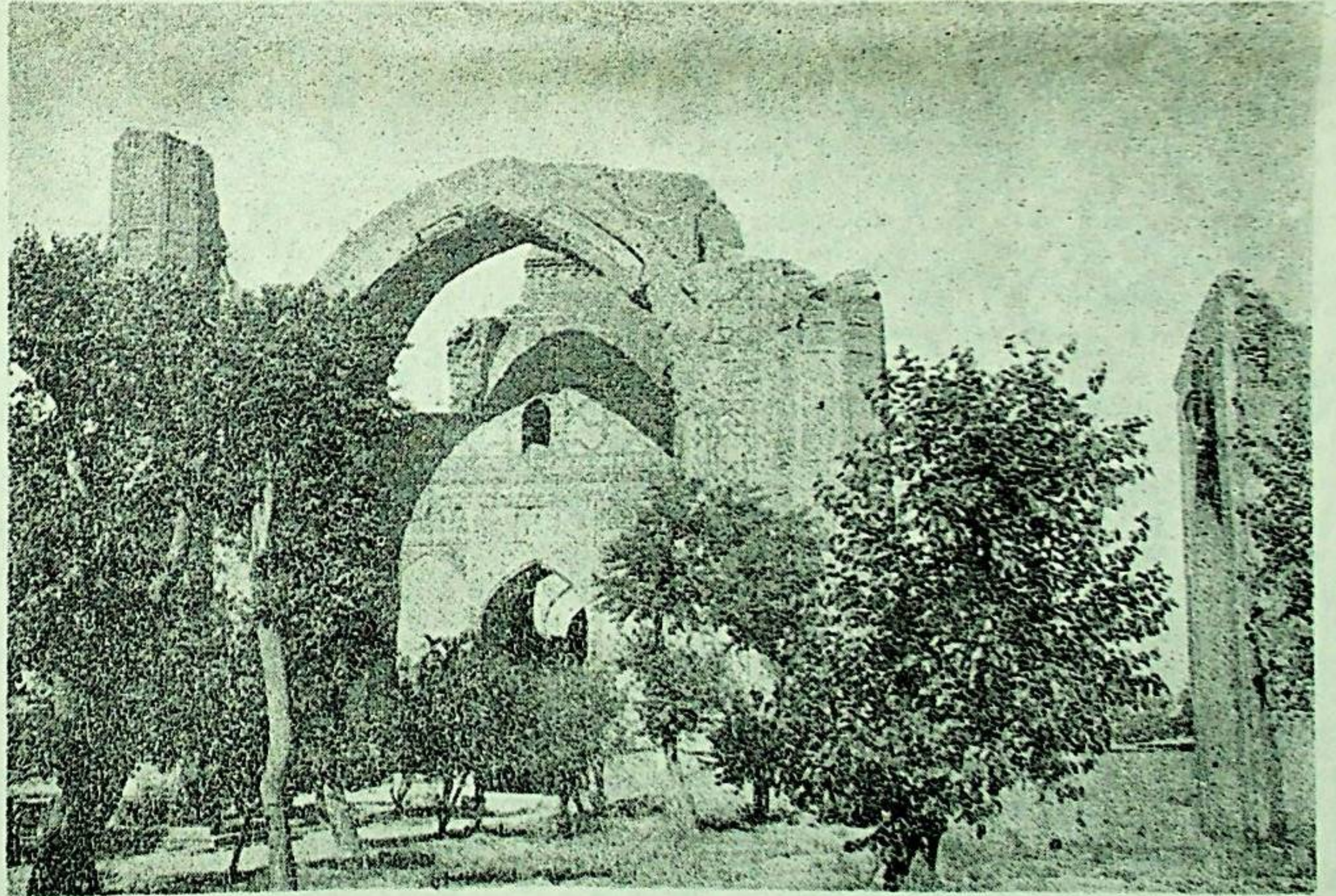
Zelzelelerden büyük zarar gören tarihi binalardan bir görünüş (Samarkant — Bibi Hanım)