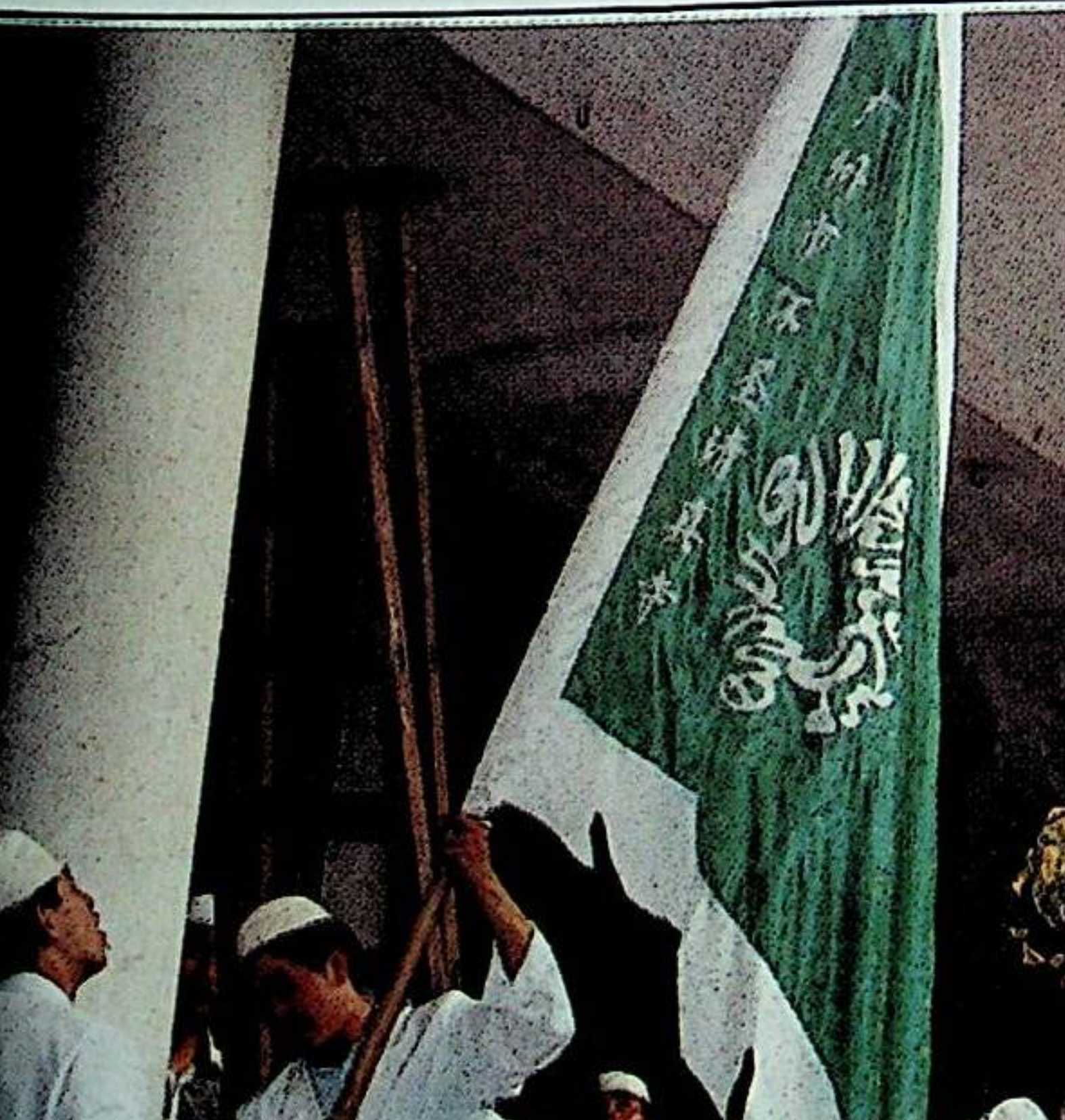
ختاينىڭ ئىچكى ئۆلكىلىرىدە (رەسىمدە گۇاڭجۇدا) تۇڭگانلارنىڭ ئەرەپچە بايراقلىرىنى كۆتىرىپ مەسجىدلەردە پائالىيەت قىلىشىغا قاراپ تۇرغان خىتاي ھۆكۈمىتى شەرقىي تۈركىستاندا ناماز ئوقۇغان ئۇيغۇرلارنىمۇ تۇتۇپ قاماپ جازالمىدا.

باشتۇرۇشتا قولغا ئېلىنغانلار ھەققىدە ناھايىتى ئاز خەۋەرلەر بېسىۋاتىدۇ. غەيرىي رەسمىي ماتېرىياللارغا قارىغاندا، ئۇلارنىڭ كۆپىنچىسى گۇمانلىق ئىسلام مۇخلىسلىرىنىڭ تۇققانلىرى ۋە مىللىي ھىداشلىق قىلغۇچى دەپ گۇمانلانغانلار ئىكەن. ئۇلارنىڭ كۆپىنچىسى نەچچە ئايلاپ ھىج سوراق قىلىنمىغان. قولغا ئېلىشلار 1997 - يىلىنىڭ ئاخىرىدىمۇ داۋاملاشقان. ئۇلارنىڭ بىرى غۇلجا ئىسلام جەمئىيىتىنىڭ باشلىقى، ئۇيغۇر مىللىتىدىن بولغان، 40 ياشلىق ئابدۇشۈكۈر ئابلىز بولۇپ، 1997 - يىلى مارتتا قولغا ئېلىنغان. فۇرال ۋەقەسى بىلەن چىقىشلىق دەپ گۇمانلانغان بۇ كىشىنىڭ ھازىر نەدە ۋە نەمەش قىلىۋاتقانلىقى ھېچكىمگە مەلۇم ئەمەس.