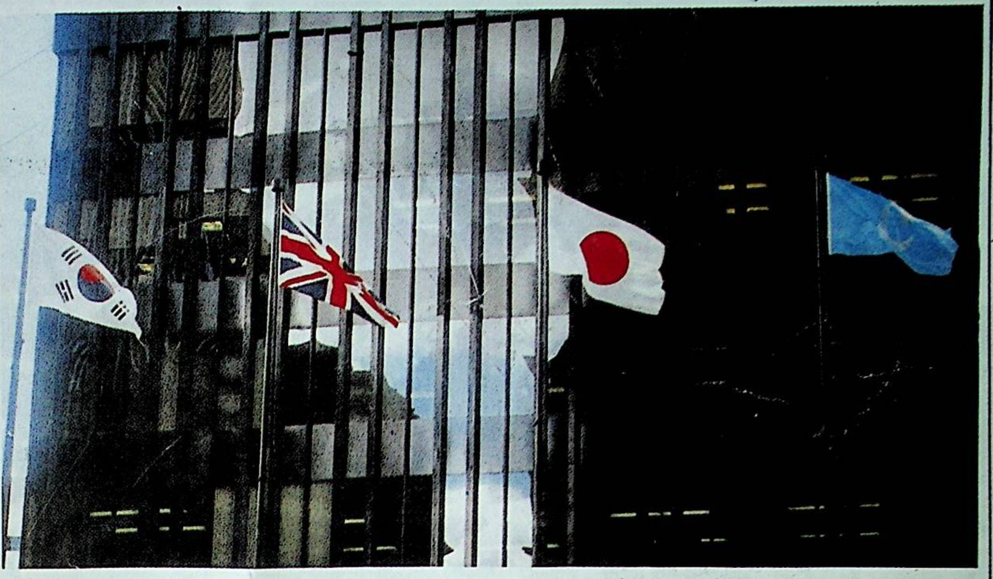
ئامېرىكىنىڭ نېيويوك شەھىرىدىكى دۇنيا تىجارەت مەركىزىنىڭ بىناسى ئالدىدىكى بايراق خادىسىدا شەرقىي تۈركىستاننىڭ ئاييولتۇزلۇق كۆك بايرىقى ئون نەچچە كۈنگىچە لەپىلدەپ تۇردى.

ھىداشلىق قىلغۇچىلار، ئىسپاتلىمىغان دىنى گۇرۇپپا ئەزالىرىنى قاتتىق باستۇرۇش ئىشلىرى ئىلى ۋە شىنجاڭدىكى باشقا رايونلاردا ئىلىپ بېرىلدى. رەسمىي دوكلات ۋە باياناتلاردا باستۇرۇشنىڭ قاتتىقلىقى دەرىجىسى قەيىت قىلىنغان. 1997 - يىلى ئىيولغىچە، 260 ئىنسانى قاتلام كادىرى تازىلاندى ۋە 100 دىن كۆپ دىنى مەكتەپ تاقالدى. رەسمىي گېزىت شىنجاڭ گېزىتى 21 - ئىيول خەۋىرى: ئىلى رايونىدا قانۇنسىز دىنى پائالىيەتلەر يىزمۇ - يىزا، كەنتىمۇ - كەنت ئالا قويماي تازىلاندى ھەمدە 40 تىن ئارتۇق كىشى قانۇنسىز دىنى پائالىيەتكە قاتناشقانلىقى ئۈچۈن قولغا ئېلىندى، دەپ يازدى. 1997 - يىلى 28 - ئىيولدىكى شىنجاڭ گېزىتى خەۋىرىگە قارىغاندا: ساقچىلارنىڭ باستۇرۇشى ئاساسەن غۇلجا، قەشقەر، ئاقسۇ، خوتەن ۋە پايتەخت ئۈرۈمچى قاتارلىق جايلارغا مەركەزلەشكەن.