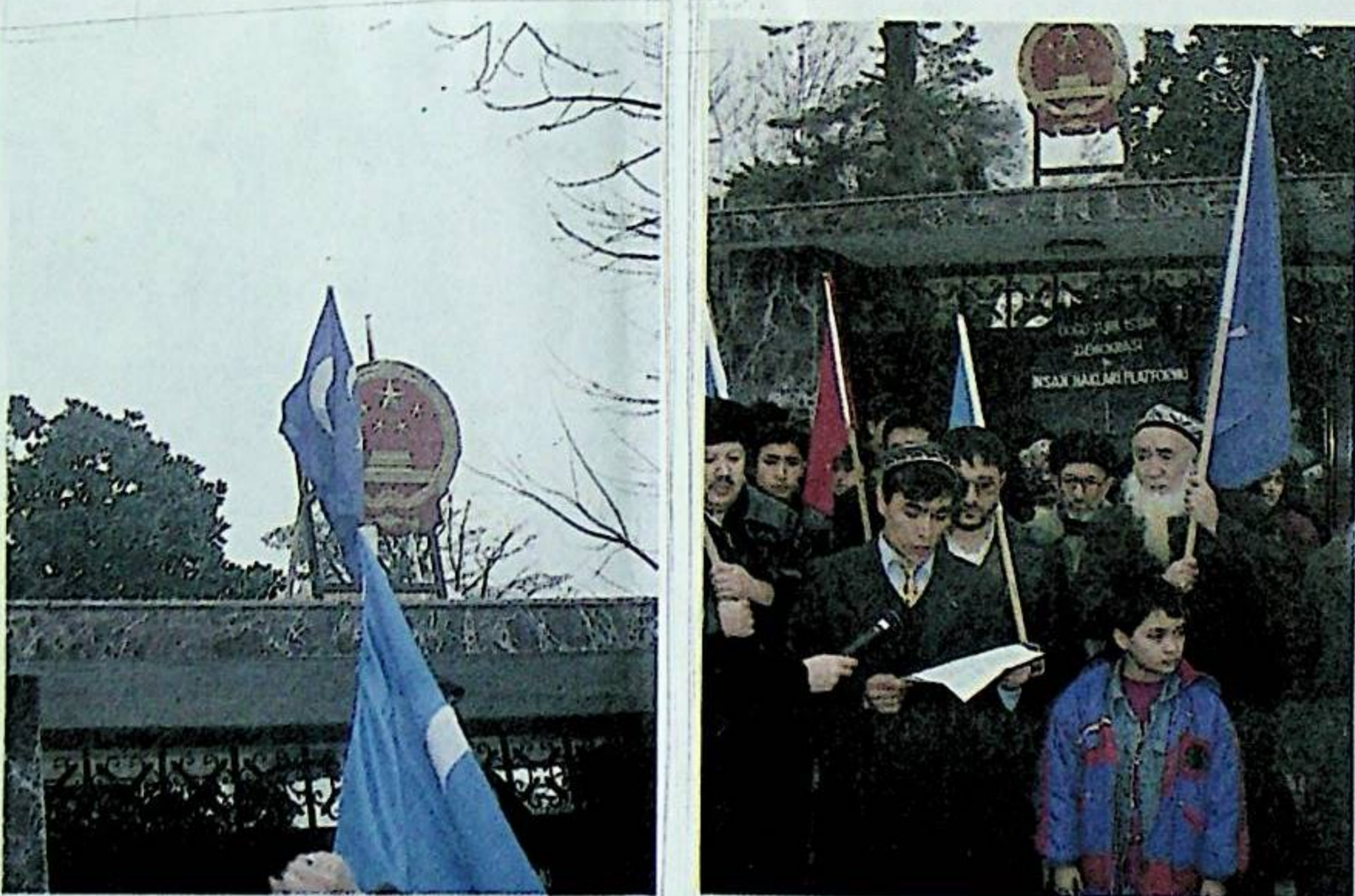
ئىستانبۇل خىتاي كونسۇلىغا قالدالغان شەرقىي تۈركىستان كۆك بايرىقى.

بۇ قېتىم مەخسۇس شەرقىي تۈركىستان ھەققىدە چىقىرىلغان 6 بەتلىك بۇ دوكلات، ئۇيغۇرلار مەسىلىسىنىڭ دۇنيا سەھنىسىدە مۇھىم ئورۇن ئىگەللىگەنلىكىنى كۆرسىتىپ بېرىدۇ.