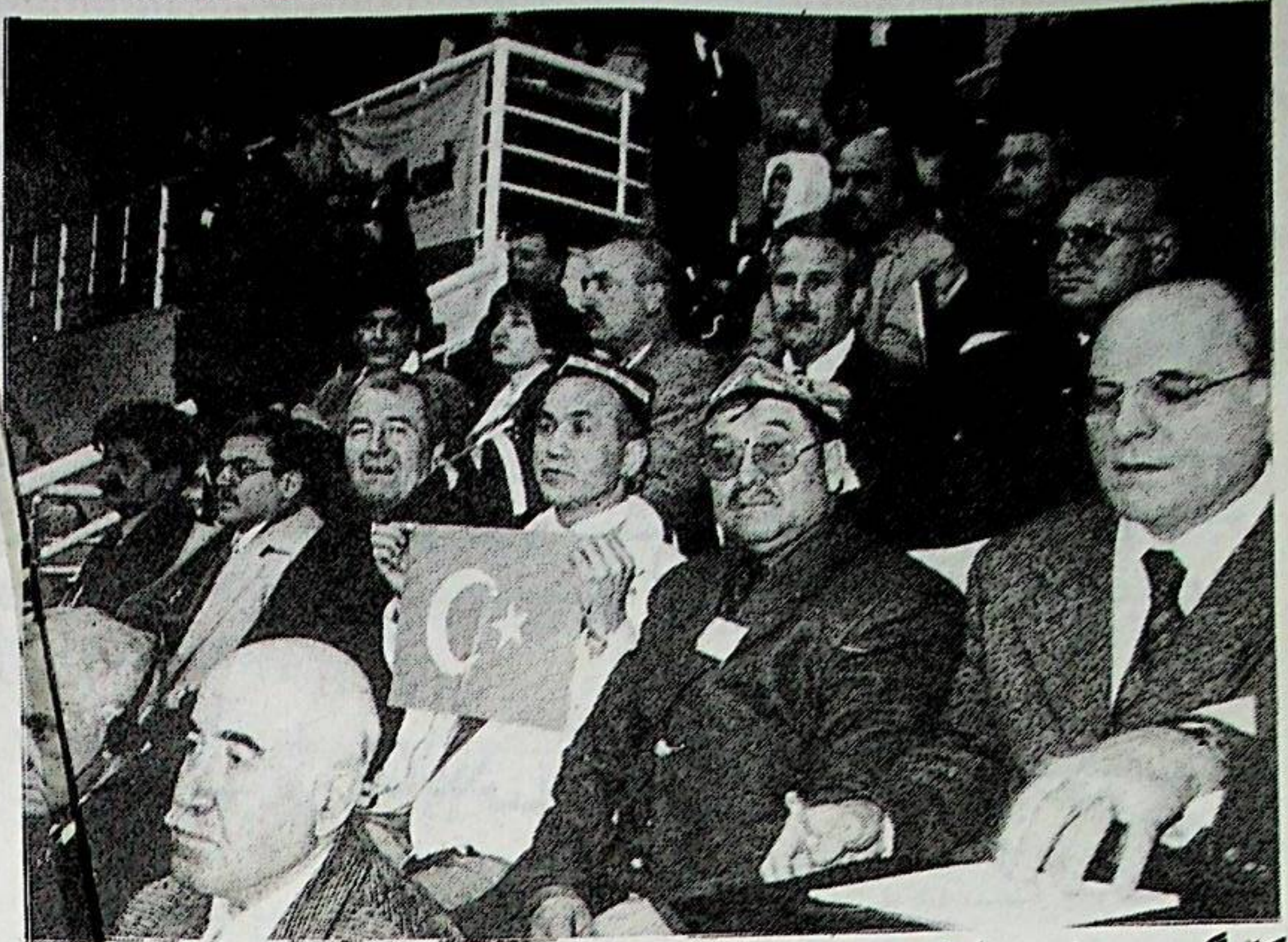
كۆرگەن يىغىن ۋە كىلىلىرى چاۋاك چېلىپ قىزغىن ئالاقىش ياكېتىپ، ئۆزلىرىنىڭ شەرقىي تۈركىستان خەلقىگە بولغان چوڭقۇر مۇھەببىتى ۋە ھېسداشلىقىنى ئىزھار قىلىشتى.

بۇقېتىمقى ئۇچرۇشۇشتىن كېيىن مىللىي قۇرۇلتاي ۋە كىلىلىرى، خىتاي رەھبەرلىرىنىڭ تۈركىيە بىلەن يېقىنلىشىشتىكى تۈپ مەقسەتلىرى ئىلمىي يوسۇندا ئانالىز قىلىنغان 4 بەتلىك بىر دوكلات ھازىرلاپ، ئۇنى تۈركىيە پارلامېنتىنىڭ بىرقىسىم ئەزالىرىغا ۋە پارلامېنت قارمىغىدىكى بەزى كومىتېتلارغا تەقدىم قىلدى.