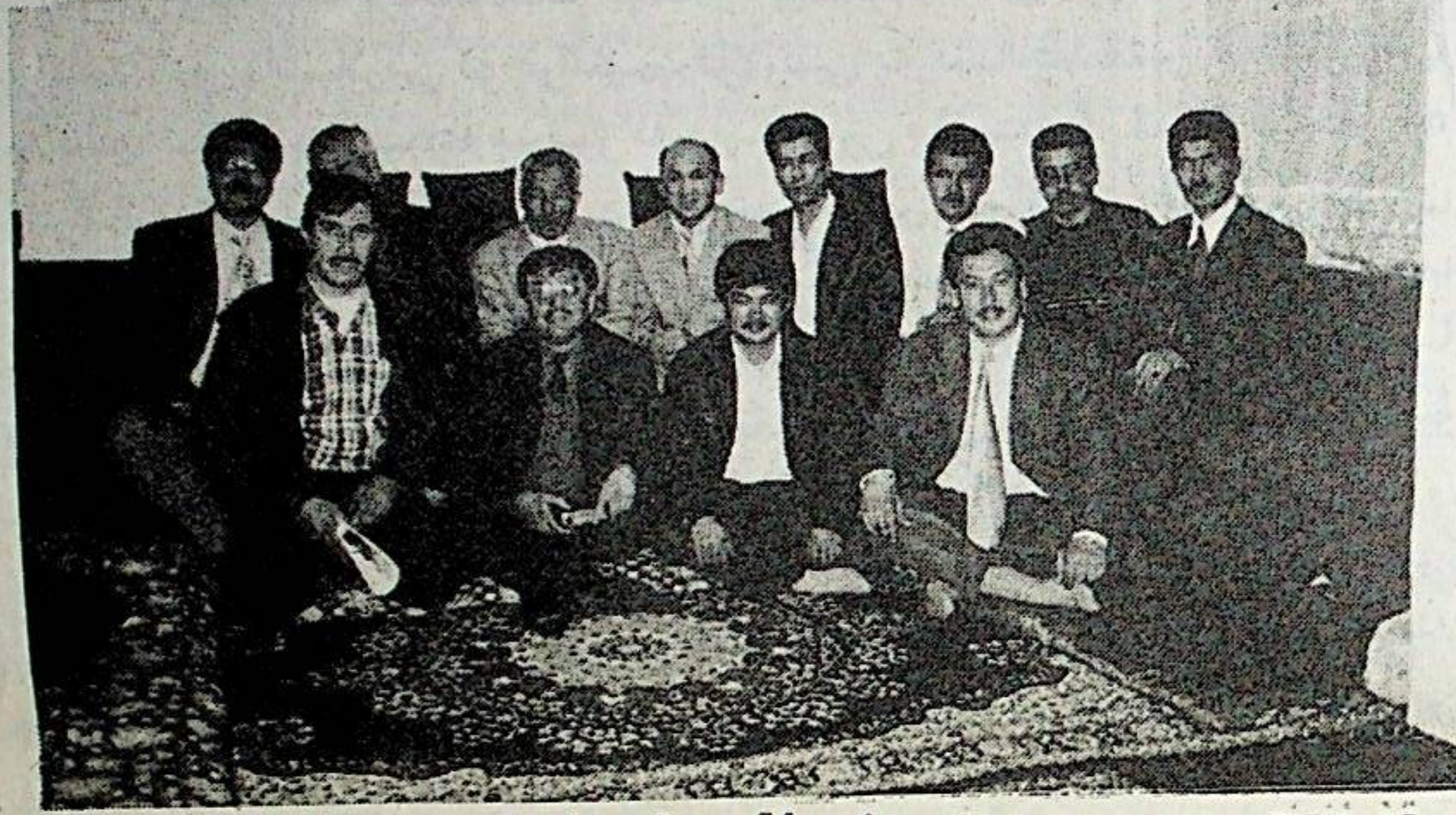
قورۇلتاي رەئىسى نەبۋەر جان بۇقېتىمقى ئەنقەرە سەپىرىدە يەنە بۇ شەھەردىكى ئۇنىۋېرسىتېتلاردا ئوقۇۋاتقان ئۇيغۇر ئوقۇغۇچىلار بىلەن مەخسۇس ئۇچرۇشۇپ، ئۇلار بىلەن ۋەتەن - مىللەتنىڭ تەقدىرىگە مۇناسىۋەتلىك مەسلىلەر ھەققىدە كەڭ دائىرىدە پىكىر ئالماشتۇردى.

ئالاھىدە تىلغا ئېلىشقا ئەرزىيدىغىنى شۇكى، ئەنئەنەۋىي جەھان باشچىلىقىدىكى قۇرۇلتاي ۋە كىلىلىرىنىڭ تۈركىيە دۆلەت ئىشلىرى كومىسسارى سادى سامونجۇ ئوغلى بىلەن تۈركىيە پارلامېنتىدا ئۆتكۈزۈلگەن سۆھبىتى بىرسائەتكە يېقىن داۋام قىلدى. سابىق باش مىنىستىر مەسۇت يىلماز ھۆكۈمىتى تەرىپىدىن شەرقىي تۈركىستاننىڭ بايرىقىنى ئېشىنى چەكلەش ھەققىدە چىقىرىلغان ئۇختۇرۇش تاكى ھازىرغا قەدەر ئىجرا قىلىنىۋاتقان ۋە تۈركىيەنىڭ