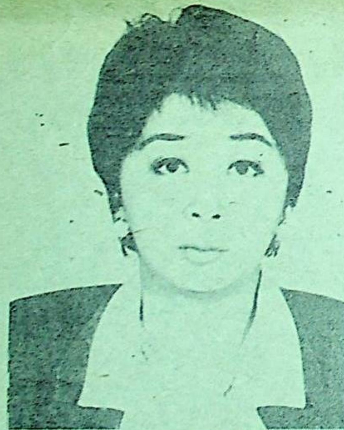
кандидат в депутаты Законодательного собрания Жогорку Кенеша Кыргызской Республики по Токолдошскому избирательному округу №2

Камвольно-суконный комбинат стал известным предприятием не только в г. Бишкеке и республиках Средней Азии и Казахстана, но и в странах СНГ и некоторых государствах дальнего зарубежья, особенно в Италии. Он выпускает более 50 видов тканей с самой разнообразной гаммой расцветок и оттенков. Каждый второй житель Кыргызстана одет в ткани камвольного комбината.