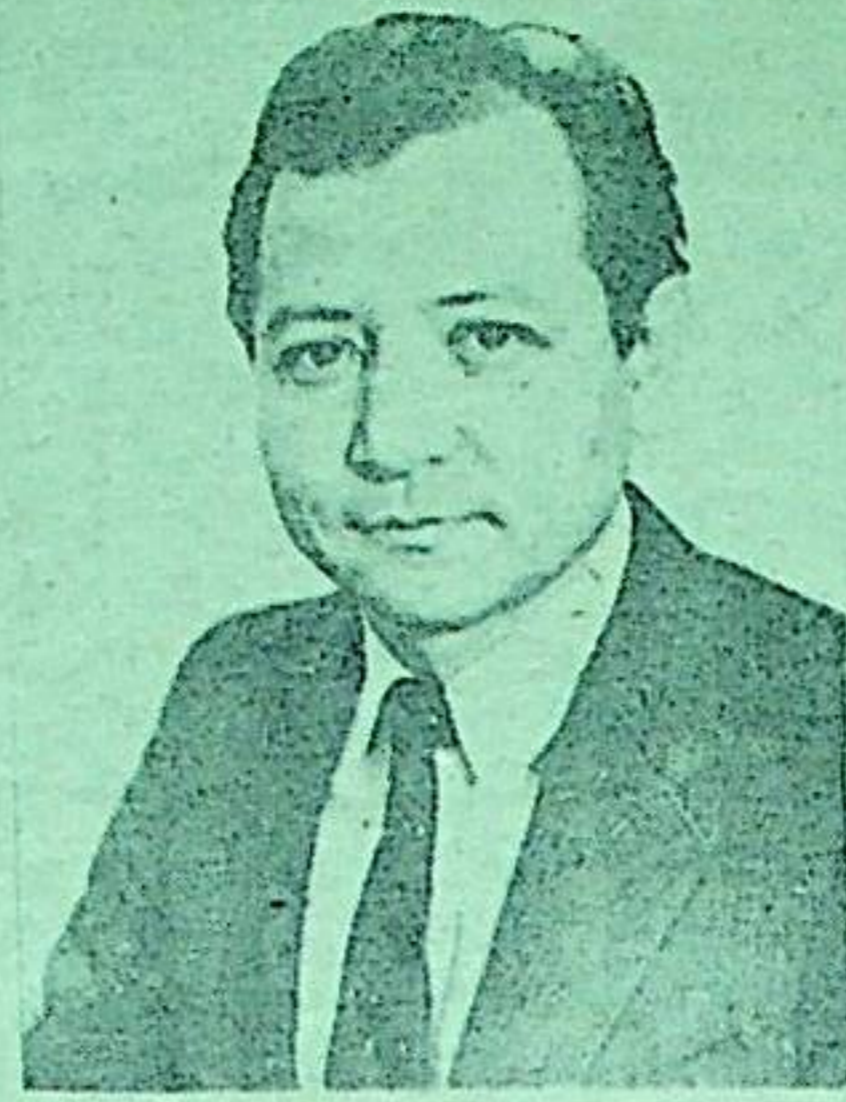
Кандидат в депутаты Собрания народных представителей Жогорку Кенеша Кыргызской Республики по Осмонкуловскому избирательному округу № 62.

Особенно большой интерес к тканям комбината проявляют Узбекистан и Россия. В Узбекистан, например, направляются ткани в оплату за газ, поступающий к нам в республику.