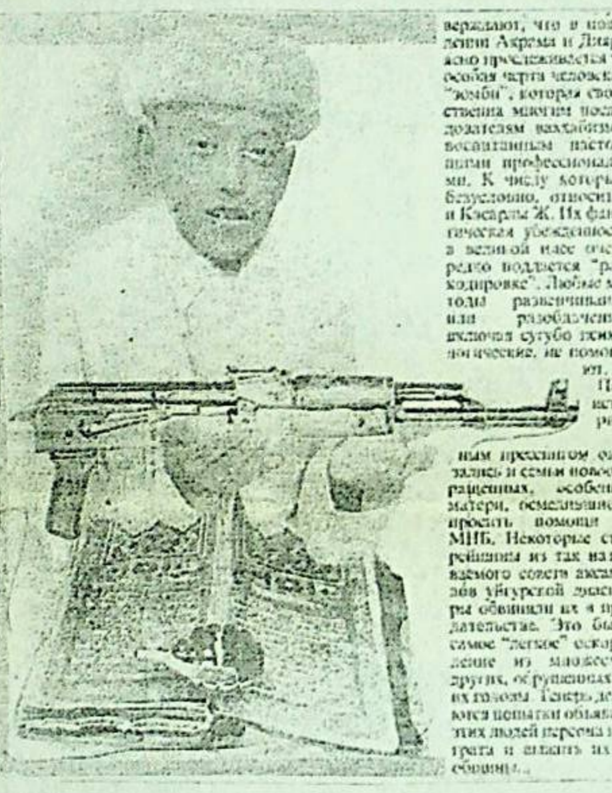
بىر ئىككى كۈندىن كېيىن ئوپېراتىۋ خادىملار تۇرپىمىنى ئېنىقلاپ چىقتى. بۇ بالىلارنى پاكىستانغا ئېۋەتكەنلىكىنى بالىلارنىڭ تەغدىرى ھەققىدە ھېچ نەرسە مەلۇم ئەمەس ئېدى. سوراق قىلىنغان تۇرپىمىنىڭ خادىملىرى، بىر نامەلۇم كىشىنىڭ ھېلىقى كۆدەكلەرنى پاكىستانغا ئېۋەتتى. رەسمىيەتلىرىنى ئۆتكەن كىشىنىڭ سۆزىنى تەسۋىرلەپ بەرگەن بولسىمۇ، لېكىن تەكشۈرگۈچىلەرگە تېخى نېمە ئۇچۇن پايتەختتىكى “ئاق جۇلتاي” دىگەن پىرىمىنىڭ قانۇنى بۇزۇپ نېمە ئۇچۇن بۇ نامەلۇم كىشىنىڭ تېكىستلىك كۆۋلۈك ئىلىرىنىڭ بۇ خىل ناھۇللاردا ئاتا-ئانىلارنىڭ 15 ياشقا توشمىغان بالىلارنى چەت ئەلگە ئېۋەتتە رازىلىق بىلدۈرۈپ تۇرىدىغان رەسمىيەتلەرنى تەلەپ قىلمىغانلىقىنى ئىنىقلاش لازىم ئېدى. تەشۋىرلەپ بېرىلگەن بالىلارنى ئېۋەتكۈچى كىشىنىڭ سۆزىنى چېكىستلارغا ياخشى تونۇش بولۇپ چىقتى. ئۇ كىشىنىڭ كېلىپ چىقىشى خىتاي ئۇيغۇر بولۇپ يېشى تەخمىنەن 36-38 ياشلاردا م. ب. م. مەلۇماتى بويىچە بۇ كىشى، بۇنىڭدىن 3 يىل بۇرۇن بىشكېككە كەلگەن ۋە ئۆزىنىڭ ۋاھابىلىق

تېخى، ۋاھابىلەر گراۋدانلىق، زامانەۋى جەمئىيەتنى قابۇل قىلمايدۇ. كۆپلىگەن دۆلەتلەردە ھازىر مەۋجۇد، دىن بىلەن دۆلەتنىڭ ئايرىملىق پىرىنسىپىغا يول قويمايدۇ. بۇ ئىقىم ئەكسلىكى، ۋە تەجەۋۋۇز چىلىقى بىلەن پەرىقلىنىدۇ. ۋاھابىلەر تەشۋىقاتنىڭ قىرغىزىستان تەۋەسىدە ئاكتىۋلىق بىلەن يولغا قويۇۋاتقانلىق توغرىسىدا مەلۇمات م. ب. م. 91-يىللاردا كېلىپ يەتكەن ئېدى. ئېنىقلىنىشىچە ئۆزىنى قەيسەرلى ئاتىۋالغان شەخىسنىڭ ئۈچ پاسپورتى بولۇپ، يەنى خىتاي، تۈركىيە، قىرغىز ئۇنىڭ ئېتىشىچە ئەسلى، بىر نەچچە ۋىل خىتاي ھۆكۈمەتنىڭ شىنجاڭ ئۇيغۇر ئاپتونوم رايونىدا ۋۇرگۇز ئۆلكىسى سىياسىتىگە ئارازى بولۇپ خىتايدىن تۈركىيەگە يۆتكەلگەن. شۇندىن بېرى ئۆزىنىڭ ئاساسى مەخسىتى ئۇيغۇر ستانىنى (شەرقى تۈركىستاننى) ئازات قىلىپ مۇستەقىل دۆلەت قىلىپ قۇرۇشنى مەخسەت قىلغان. ئۇ قانداق قىلىپ، ئۇ بىزنىڭ جۈمھۇرىيىتىمىزگە كېلىپ ئولتۇرا-قىلىشىپ قالدى، تېخى نامەلۇم. جەقەيسەرلى ئاللىقاچان قىرغىزىستان گراۋدانغا ئۇيۇلۇپ، نوۋوپاكرۇۋىدا ئۆي-جاي “مېرىيەس” ماشىنا، يۈز لۈك تېلېفون ئېلىپ ئۆلگۈرگەن ئۇنىڭ قاناتىملىق، ۋاھابىلىق ئىستىقادىغا بىشكېك ۋە جۇي ۋادىسىنىڭ نەچچە يۈزلىگەن مۇسۇلمانلىرىنىڭ دىققىتىنى قوزغىغان، دىنى قاناتىك جەننىڭ قولىغا ئېلىشقا نەق ئاشۇ ۋۇقىرىدا ئېتىلغان بالىلارنىڭ ۋۇتتىشى سەۋەپ بولۇپ، چېكىستلارنىڭ نوۋوپاكرۇۋىدا بېرىپ ئۇلارنى قولىغا ئېلىشقا ۋاھابىلەر تەشكىلاتىنىڭ تىرىشچان ئەزەلىرى قەيسەرگە ۋە-م. ب. م. نىڭ تېررورلۇققا قارىشى تۇرۇش قالغان كۆپىنچىسى ئېۋەتلىگەن ئېدى.