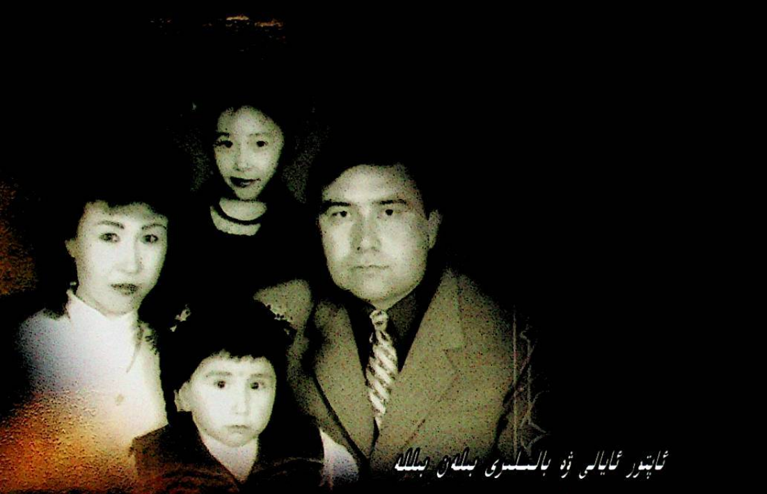
ئاپتور ئايالى ۋە بالىسى بىلەن بىللە