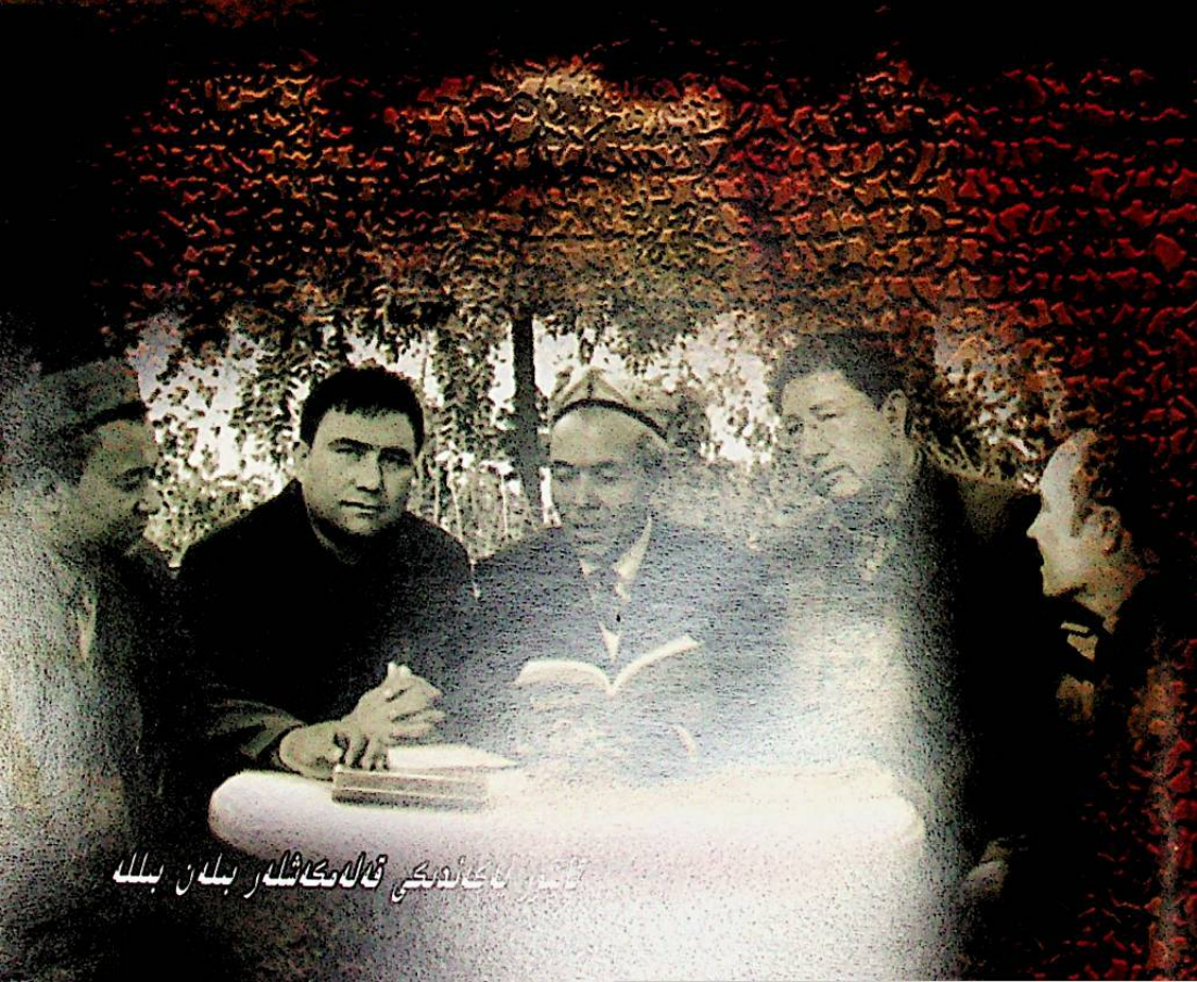
ئاپتور لىك ئىدىكى قىلغىنى بىلەن بىللە