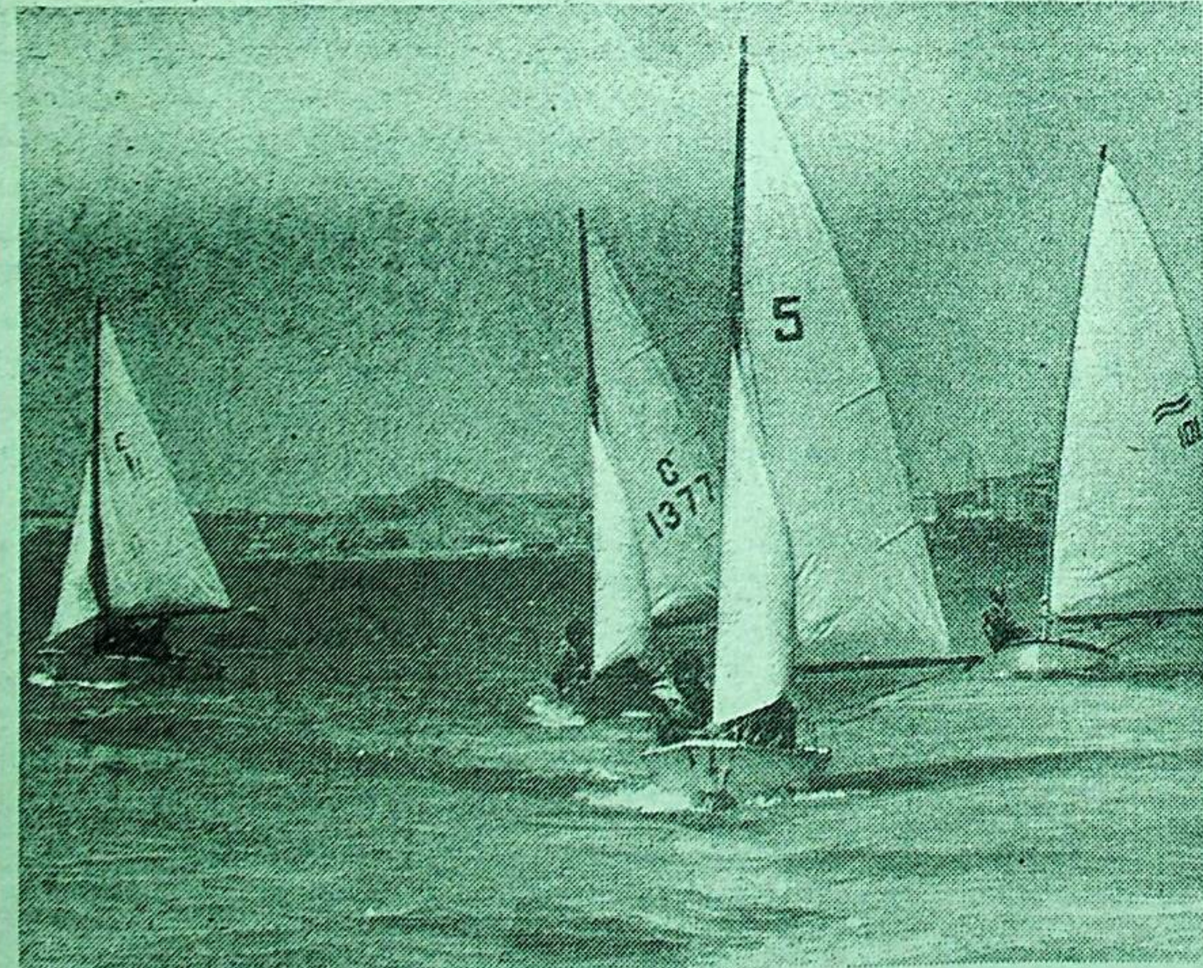
كاسپىي دېڭىزى دولقۇنلىرىدا.