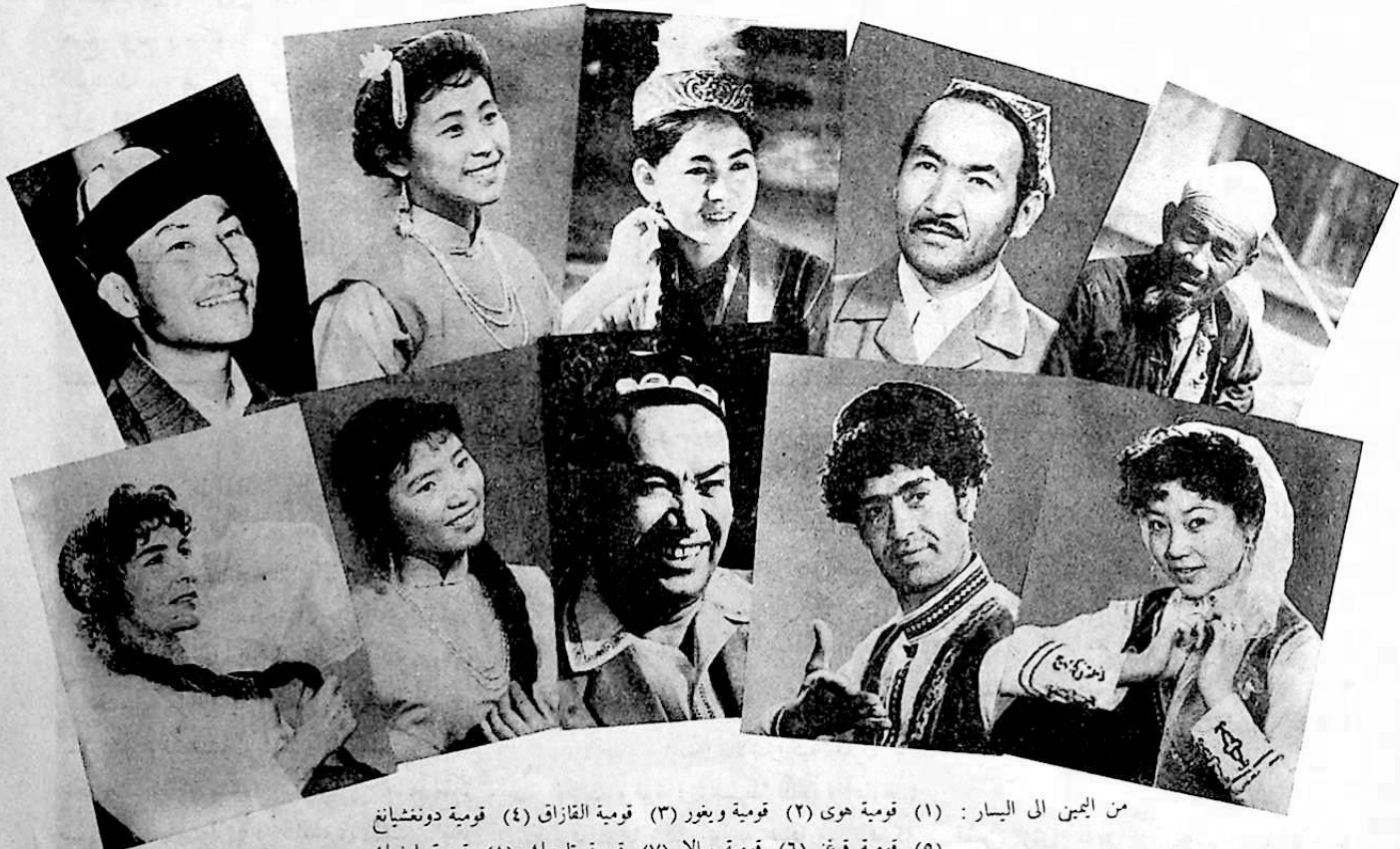
من اليمين الى اليسار : (١) قومية هوي (٢) قومية ويغور (٣) قومية الفازاكي (٤) قومية دونغشيانغ (٥) قومية قرغز (٦) قومية سالا (٧) قومية تاجيك (٨) قومية اوزبك (٩) قومية باوآن (١٠) قومية تانار

ترددت اقاويل كثيرة حول تقدير عدد المسلمين في الصين من ضمن القوميات الصينية العشر التي تعتق الدين الاسلامي . وفيما بين هذه الاقاويل نذكر «الكتاب السنوي» الذي نشرته المطبعة التجارية باللغة الانجليزية في عام ١٩٣٥ . وقد كان لهذا الكتاب تأثير كبير في حينه . اذ زعم ان عدد المسلمين في الصين بلغ ٤٨ر١٠٤ر٢٤٠ نسمة وبها ٤٢ر٣٧١ مسجدا . ونتيجة لذلك شاع في العالم ان عدد المسلمين الصينيين ٥٠ مليوناً . لم تتوقف الحكايات والاقاويل عند هذا الحد ، بل أخذ البعض يزيدون في العدد . . . .