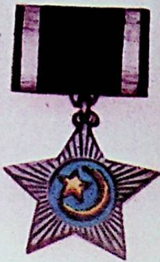
شہرہ جی توڑکستان ہندوستان 2 - 1944