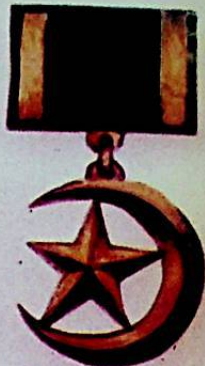
شہرہ جی توڑکستان ہندوستان