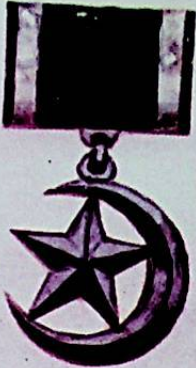
شہرہ جی توڑکستان ہندوستان