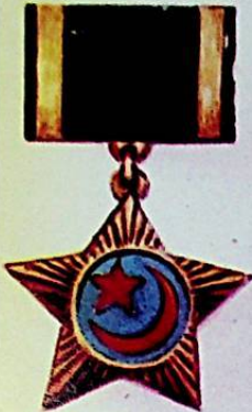
شہرہ جی توڑکستان ہندوستان 1 - 1944