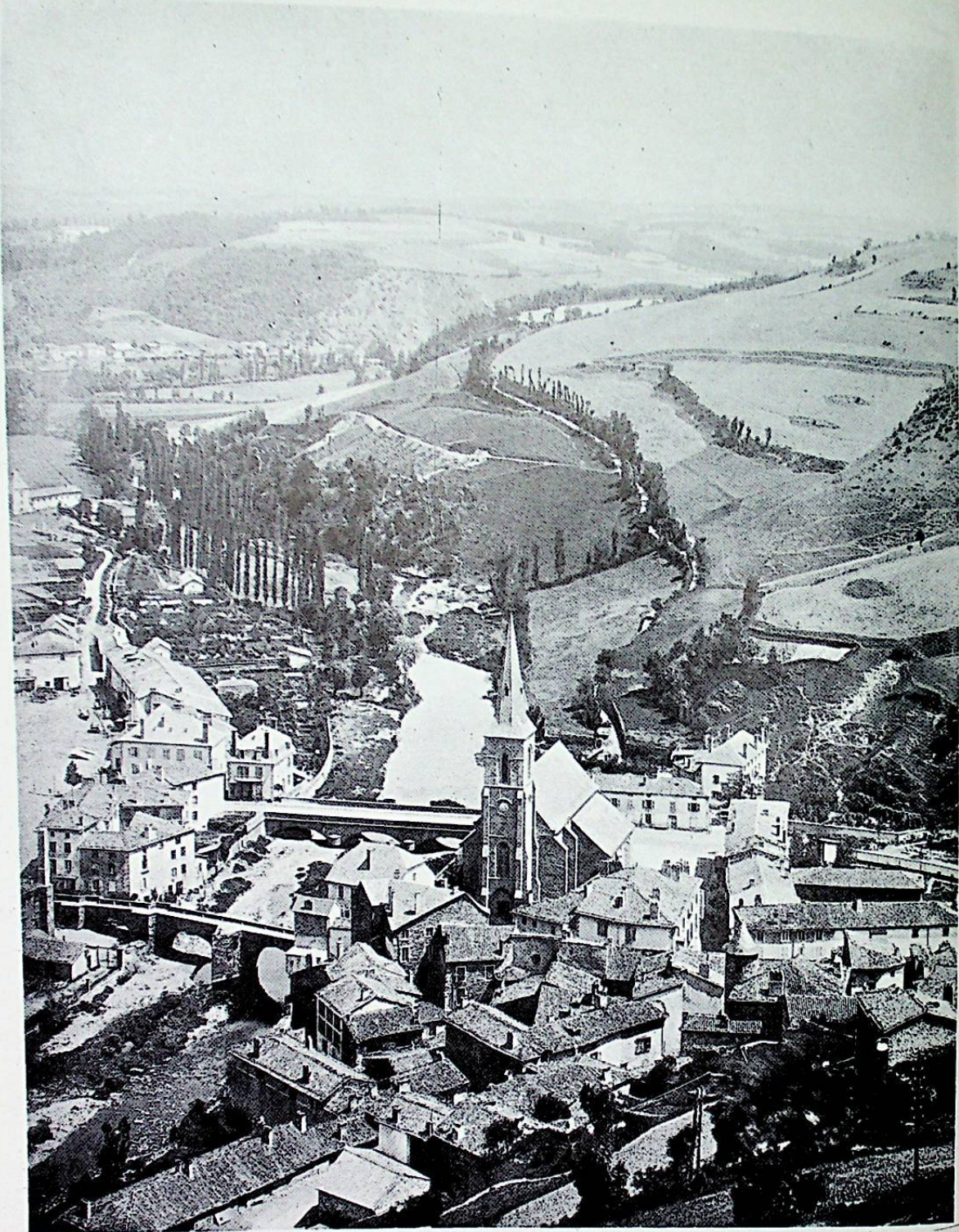
Une petite ville de France: SAINT-FOUR.