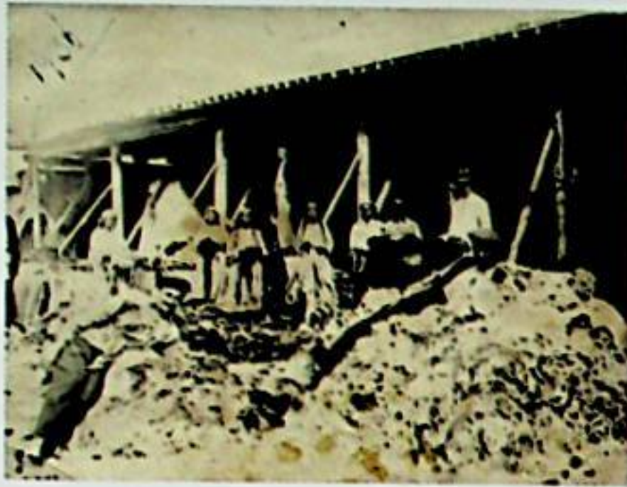
سالخ ۋەلىپىق ئەفەندىنىڭ (ئەڭ ئارقىدا ئۆرە تۇرغان قارا كاستوملىق ئادەم) قاراشەھەر سودا شىركىتىنى قۇرۇپ چىققاندىن كېيىن يۈڭ سورت- لىغۇچى ئىشچىلار بىلەن بىر- لىكتە چۈشكەن رەسىمى.