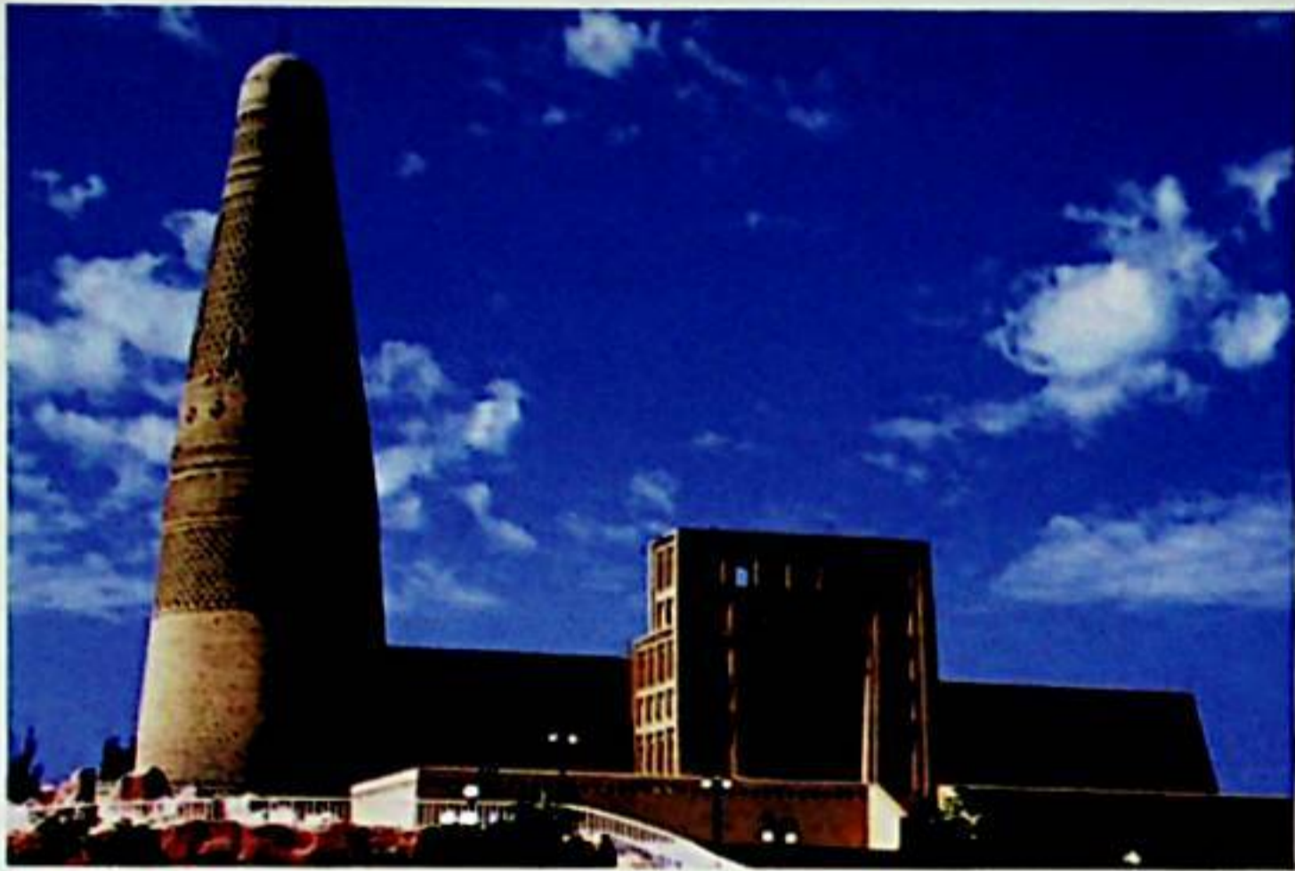
تۇرپان شەھىرىدىكى ئىمىن ۋاڭ مۇنارى.