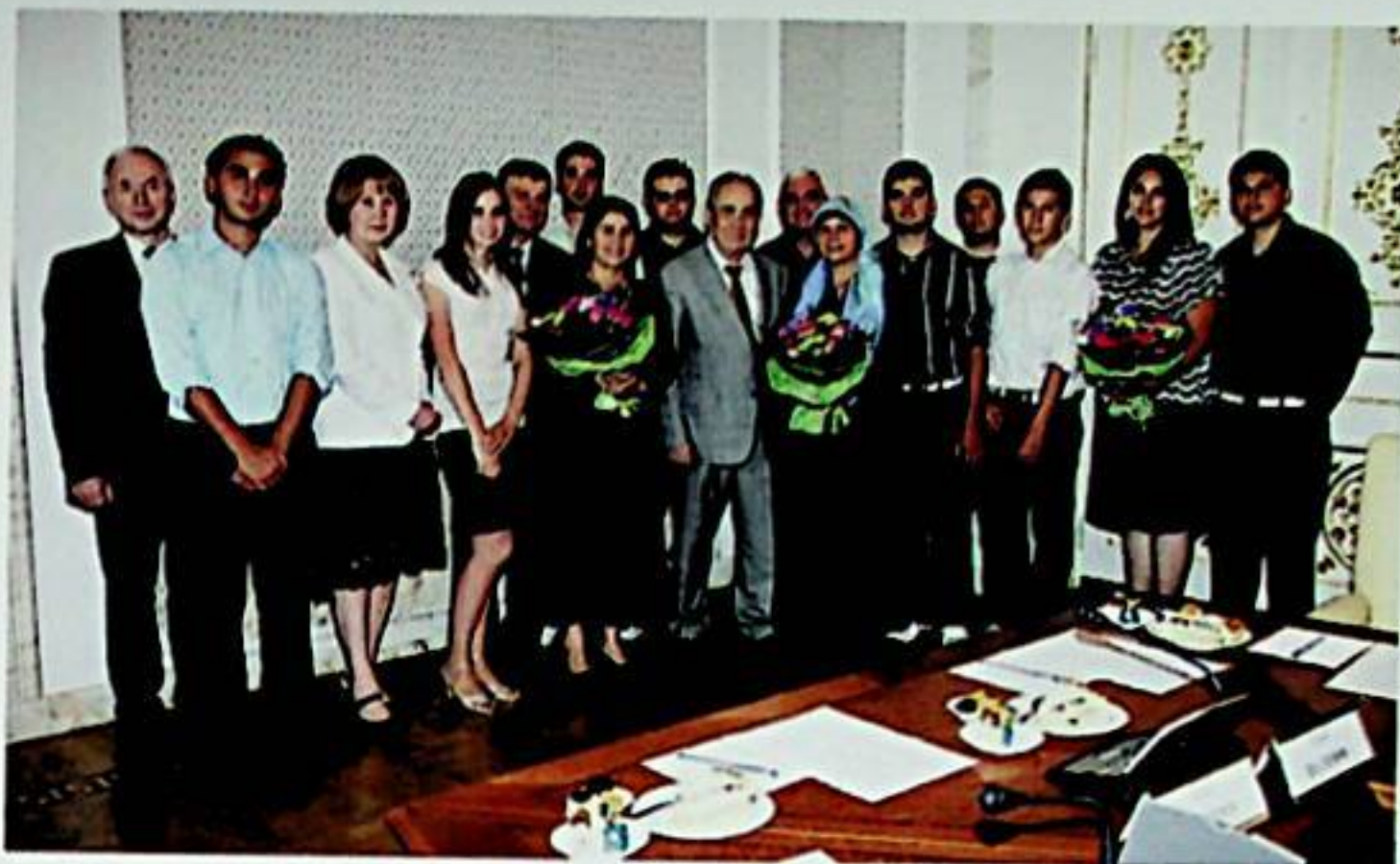
ئىبراھىم ۋەلىيېقى ھەم ئەخمەت نەجىب ساقىن ئەفەندىلەرنىڭ نەۋرە - چەۋرىلىرى تاتارىستاننىڭ پىرزىدېنتى ھۆرمەتلىك مىنتىمىر شەيمىيېقى ئەفەندى (ئوتتۇرىدا ئۆرە تۇرغان ئادەم) بىلەن بىللە. 2008 - يىلى قازان، تاتارىستان.