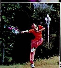
هدية هذا العدد