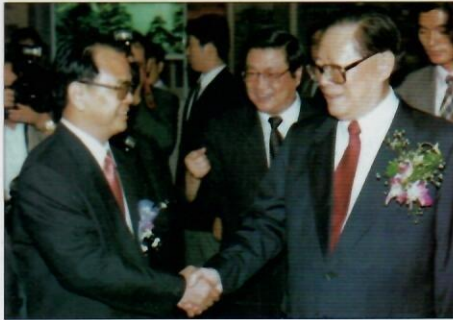
4 غمخورلۇق ۋە ئىلھام

قاتناشنى تازا راۋاجلاندۇرۇپ، كەڭ غەربىي جەنۇبتىكى رايونلارنى تۇتاشتۇرۇش