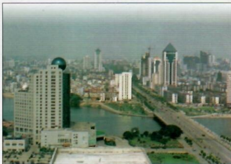
18 مەركەز شەھەر—نەننىڭ