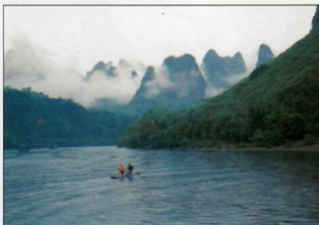
30 گۈيلىن مەشھۇر خەلقئارا ساياھەت شەھىرى بولۇشقا قاراپ قەدەم تاشلىماقتا

36 يۈكسىلىۋاتقان ئىستىقبالىق مۇنبەت تۇپراق