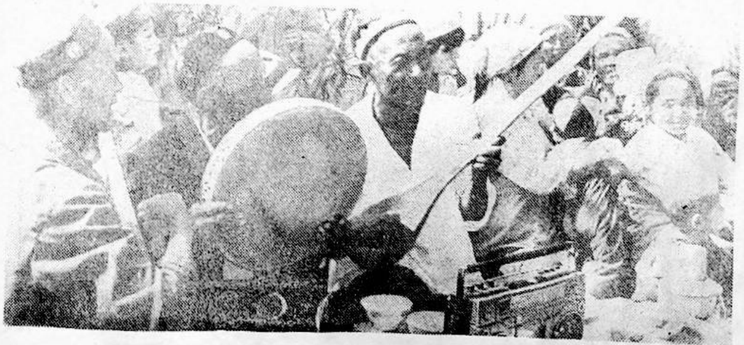
چىمەن 1 - دادۇيىنىڭ نەغمىكەشلىمى