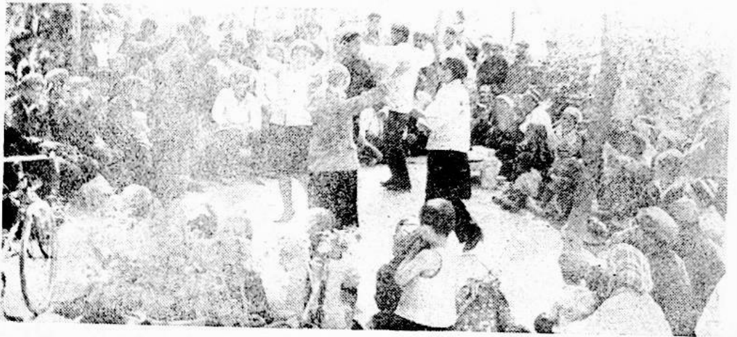
كۇچار توي مەشرىمىدىن بىر كورۇنۇش.