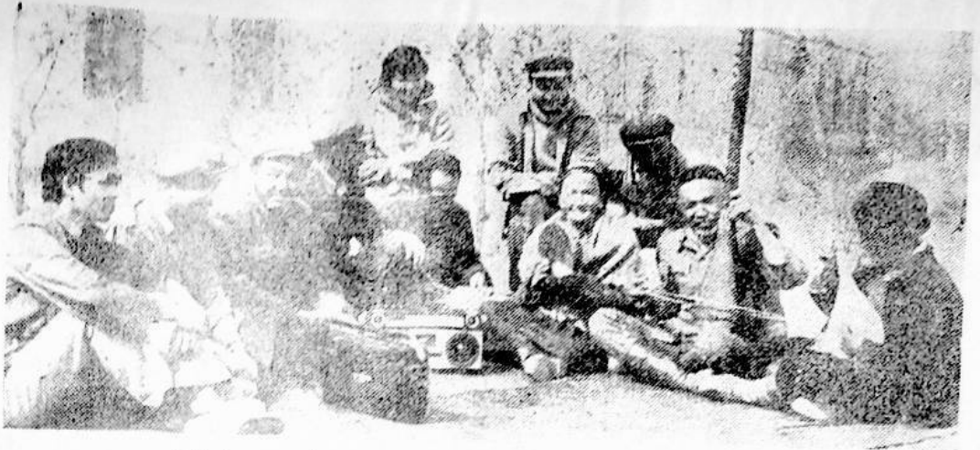
خەل ناختمىرىنى ئويۇش، رەنەس ئىلىمىنى ئىلىم ئېرىلىماقتا.