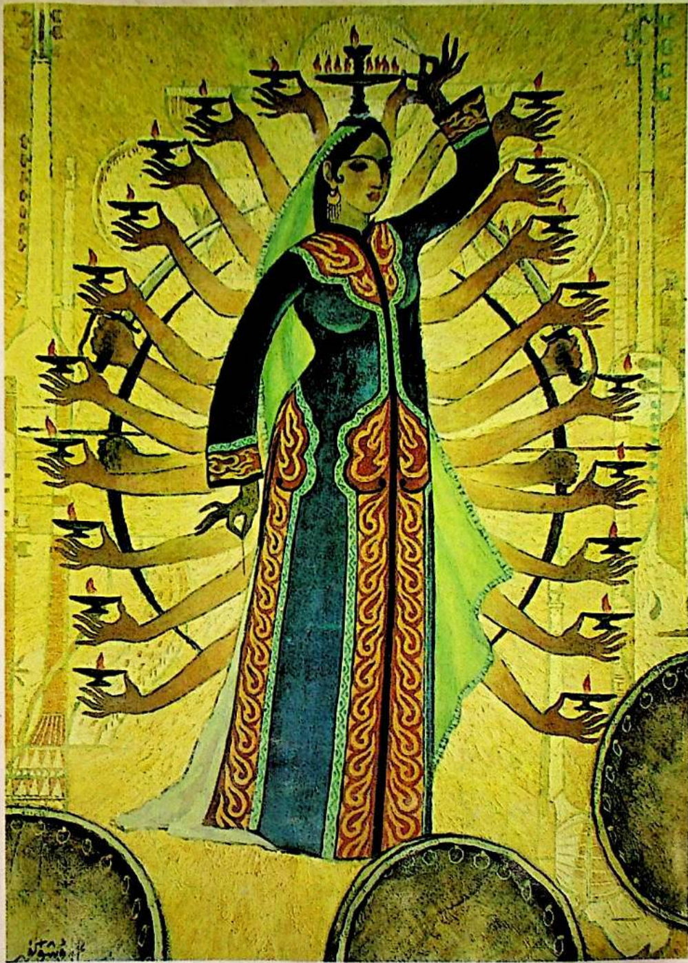
ئابدۇشۈكۈر كېرەم سىزغان