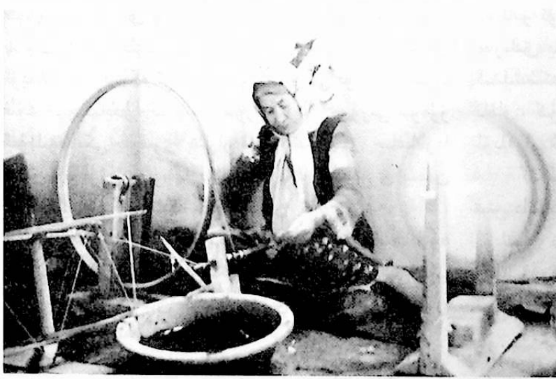
نازىڭنى ئەر كۆتۈرەر، ئەر كۆتۈرمىسە، ئەل (كۆتۈرەر)

ياغاچ جۇۋاز مەخسۇس جۇۋاز ياسايدىغان ياغاچچى ئۇستىلار تەرىپىدىن دىيامېتىرى 70 سانتىمېتىر، ئۇزۇنلۇقى 2.50 مېتىر ئەتراپىدىكى ئۆرۈك، ياڭاق ياغاچلىرىدا ياسىلىدۇ. بۇ ئىككى خىل ياغاچتىن باشقا ياغاچلاردا جۇۋاز ياشاشقا بولىمايدۇ، مەيلى تاش جۇۋاز ياكى ياغاچ جۇۋاز بولسۇن، ئۇلارنىڭ مايلىق دان قويدىغان كاتتىكىنىڭ ئويۇشى ئوخشاش بولۇپ، ئۈستى كەڭ، ئوتتۇرىسى تار، ئاستى يۇمىلاق ئۈچ خىل شەكىلدە. يەنى، جۇۋاز كۆتكەننىڭ كەسمە يۈزى 70 سانتىمېتىر بولغاندا ئۈستى كاتتىكىنىڭ ئېغىزى (كونۇس شەكىلدە) دىيامېتىرى 40 سانتىمېتىر ئوتتۇرا (بوغماق) قىسمىنىڭ 25 سانتىمېتىر، ئاستى قىسمىنىڭ