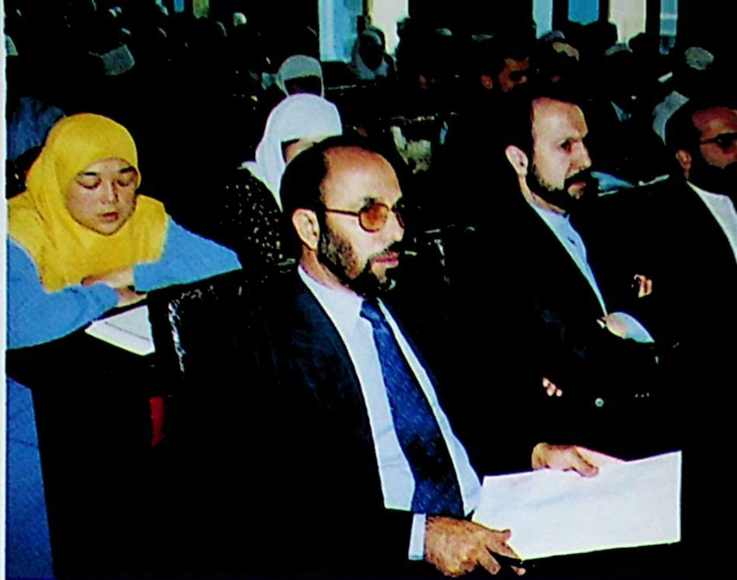
بۇ يىل 5-ئاينىڭ 11-كۈنىدىن 14-كۈنىگىچە بېيجىڭدا مەملىكەتلىك نوۋەتلىك قىرائەت مۇسابىقىسى ئۆتكۈزۈلدى. سۈرەتتە مۇسابىقىنىڭ ئاخىرقى نۆتىدىكى مەيداندىن بىر كۆرۈنۈش.