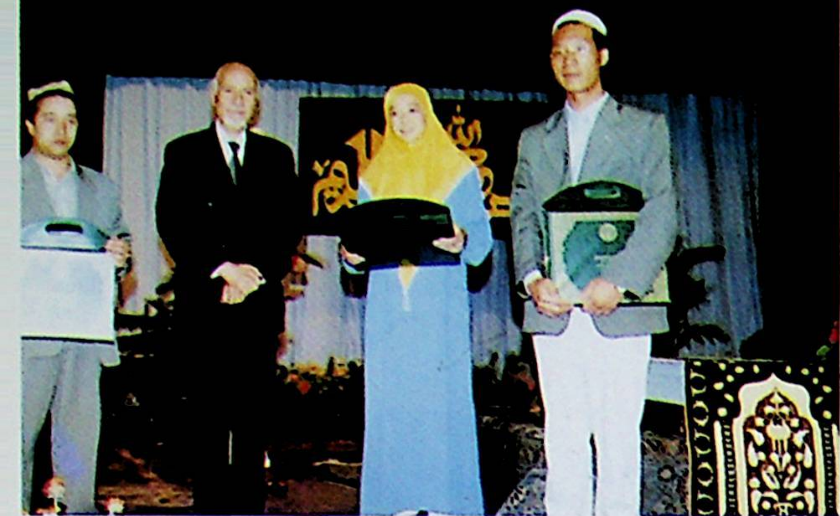
سەئۇدى ئەرەبىستاننىڭ جۇڭگودا تۇرۇشلۇق باش ئەلچىسى يۈسۈپ مۇھەممەد ئەل مەدانى مۇسابىقىدە نەتىجە قازانغانلارغا سوۋغات ئاتىدى ۋە ئۇلار بىلەن بىللە سۈرەتكە چۈشتى.