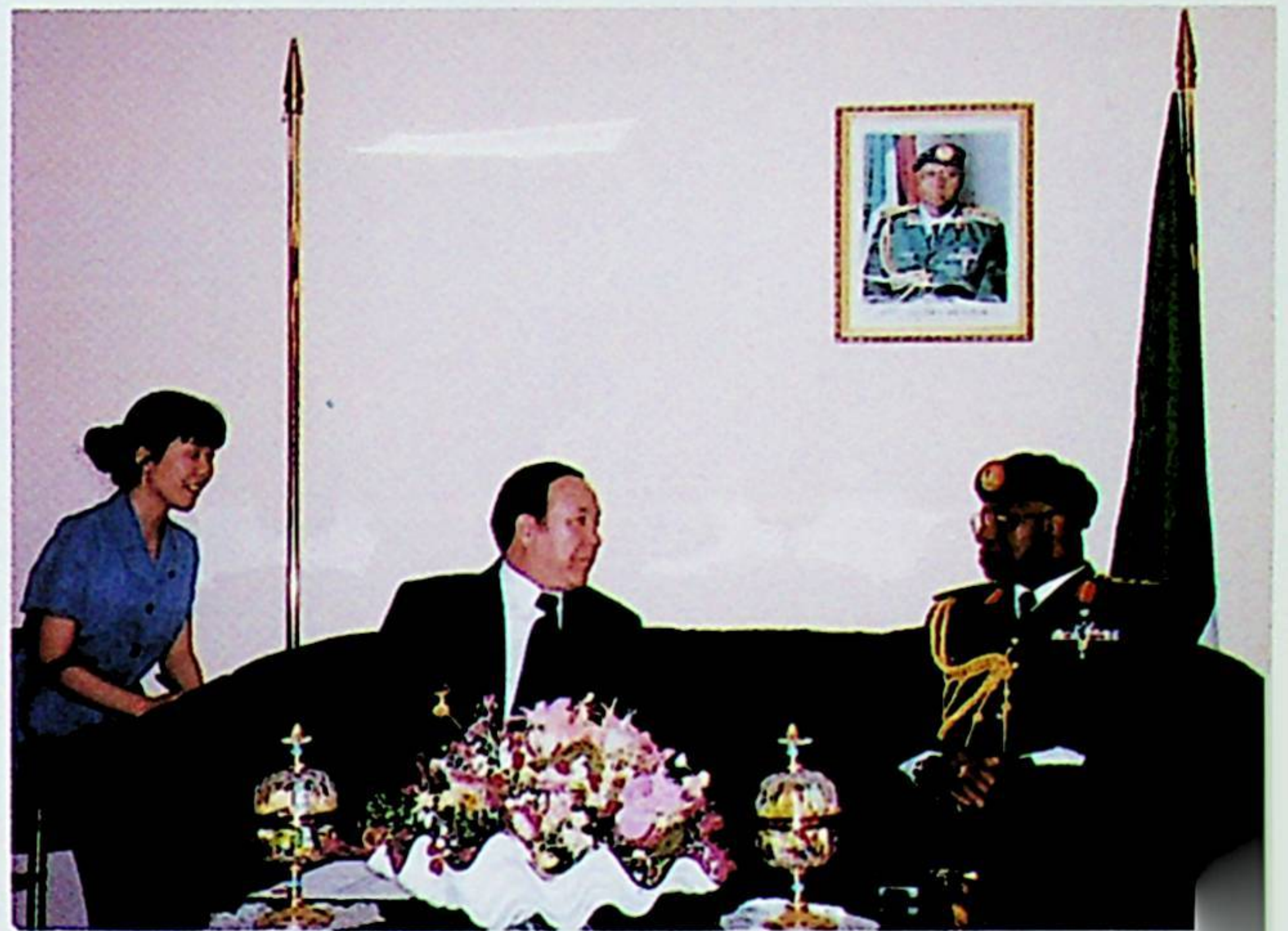
ئىسمائىل ئەھمەد نىگىرىيەنىڭ سابىق دۆلەت باشلىقى ھاجى ئابدۇسالام ئەبۇبەكرى بىلەن سەمىمىي سۆھبەتلەشتى ۋە رەئىس جياڭ زېمىننىڭ ئۇنىڭغا ئۆز قولى بىلەن يېزىپ يوللىغان مەكتۇپىنى تاپشۇرۇپ بەردى.