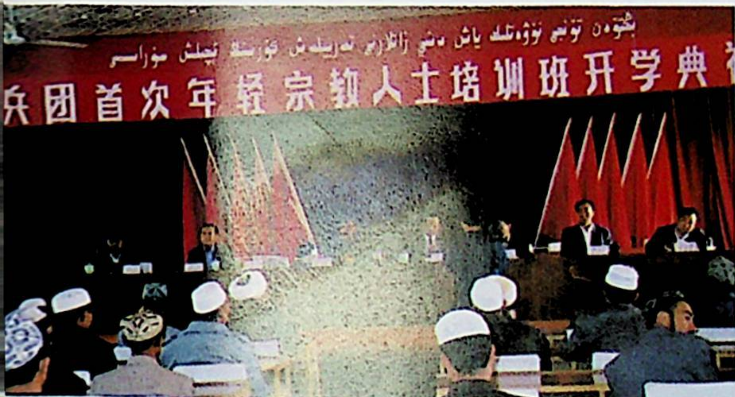
بىڭتۇەن بويىچە تۇنجى قېتىم ئېچىلغان 40 كىشىلىك ئۈچ ئايلىق دىن زاتلار كۇرسىدا بۇ يىل 5-ئاينىڭ 15-كۈنى دەرس باشلاندى. روزى ئىبرا قاتارلىق رەھبەرلەر مۇراسىمغا قاتناشتى ۋە سۆز قىلدى.