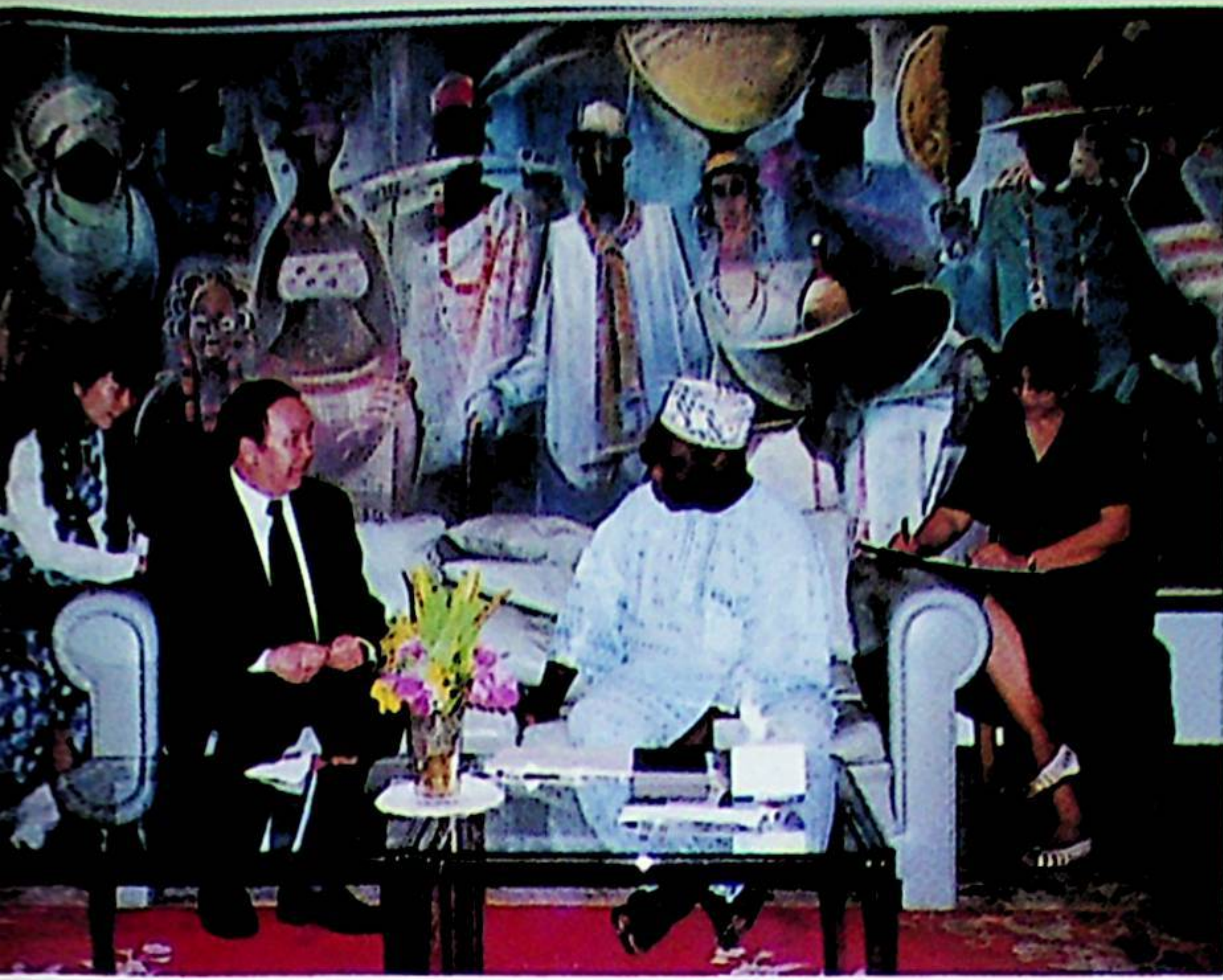
ئىسمائىل ئەھمەد نىگىرىيەنىڭ يېڭى زۇڭتۇڭى ئولۇسېگۇن ئوكىئولا ئار ئوباسانجونى زىيارەت قىلىپ قىزغىن تەبرىكلىدى ۋە ئۇنىڭغا رەئىس جياڭ زېمىننىڭ ئۆز قولى بىلەن يېزىپ يوللىغان مەكتۇپىنى تاپشۇرۇپ بەردى