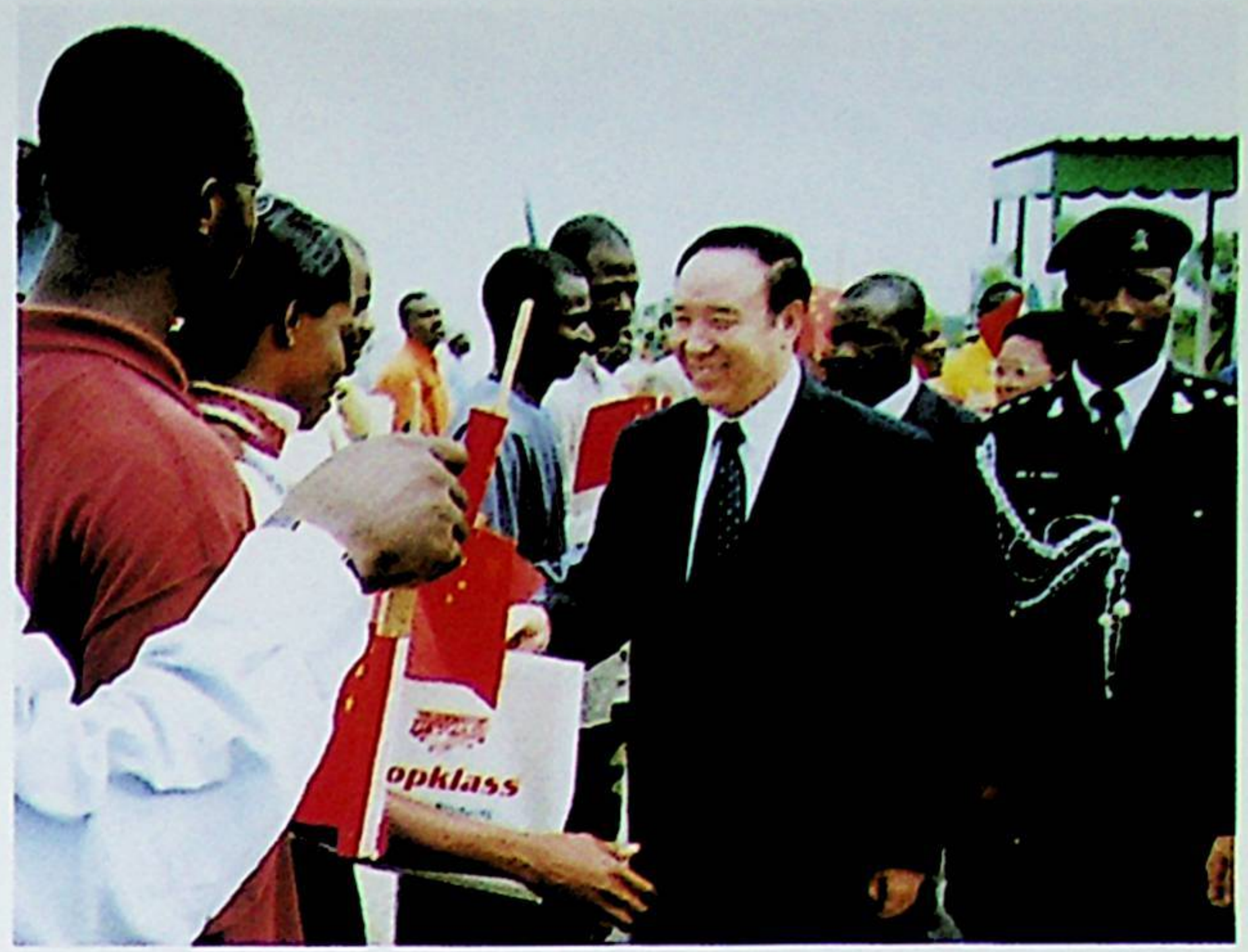
نىگىرىيە پايتەختى ئابۇجا شەھىرىنىڭ باشلىقى داغدۇغىلىق مۇراسىم ئۆتكۈزۈپ ئىسمائىل ئەھمەدنىڭ شەھەرگە قەدەم تەشرىپ قىلغانلىقىنى قارشى ئېلىپ ئۇنىڭغا: "ئابۇجا شەھىرىنىڭ شەرىپلىك پۇقراسى" دېگەن نامنى بەردى ۋە شەھەرنىڭ "ئالتۇن ئاچقۇچى" نى ئىنتام قىلدى.