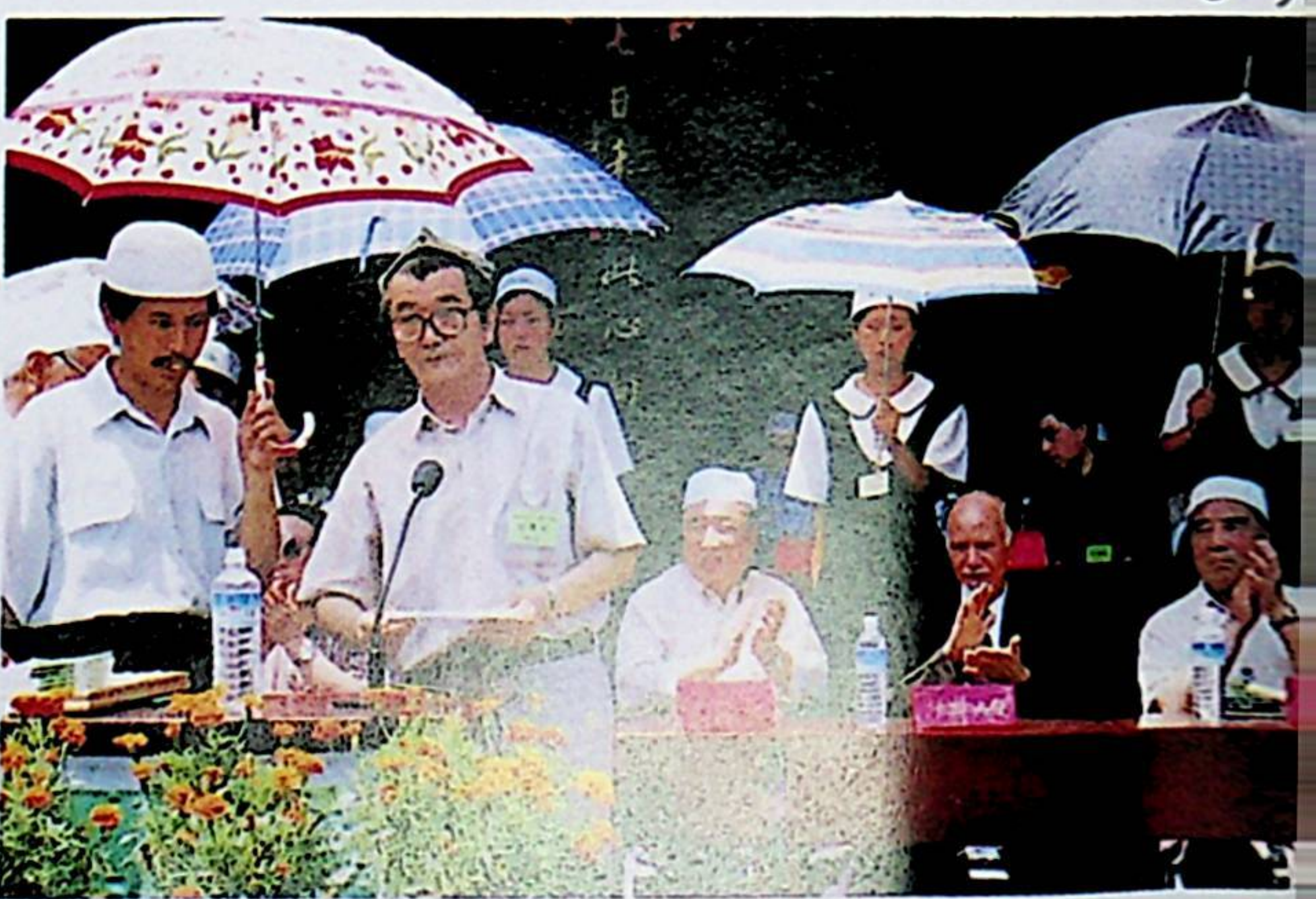
سەئۇدى ئەرەبىستاننىڭ جۇڭگودا تۇرۇشلۇق باش ئەلچىسى يۈسۈپ مۇھەممەد ئەل مەدانى، رەب ئەللىرى بىرلەشمىسىنىڭ جۇڭگودا تۇرۇشلۇق ئىشخانىسىنىڭ مۇدىرى مۇھەممەد ئەل ساكىت ۋە جۇڭگو ئىسلام جەمئىيىتىنىڭ مۇئاۋىن رەئىسى شەمشىدىن ھاجى قاتارلىقلار 1993-يىلى 7-ئاينىڭ 16-كۈنى (جۈمە كۈنى) چىندې شەھىرىدىكى چىندې مەسچىتىنىڭ كىيىملىكى قۇرۇلۇشىنىڭ مۇراسىمىغا قاتناشتى ۋە سۆز قىلدى.