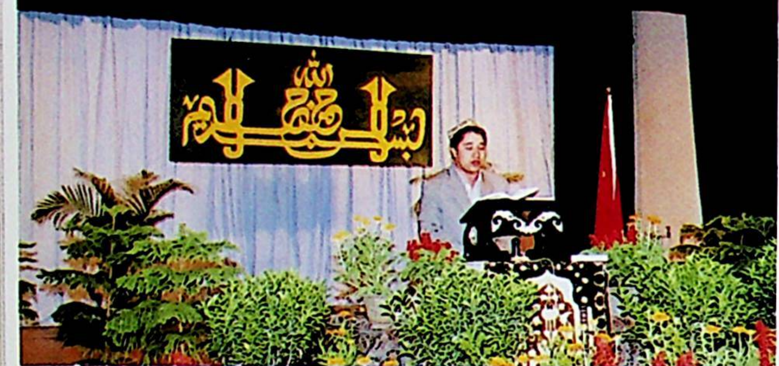
شىنجاڭ ئىسلام دارىلفۇنۇنىنىڭ تالىپى، قارامايلىق ئابدۇشۈكۈر قارى مۇسابىقىدە 2-لىكىنى ئالدى. سۈرەتتە ئۇ قىرائەت قىلىمىقتا.