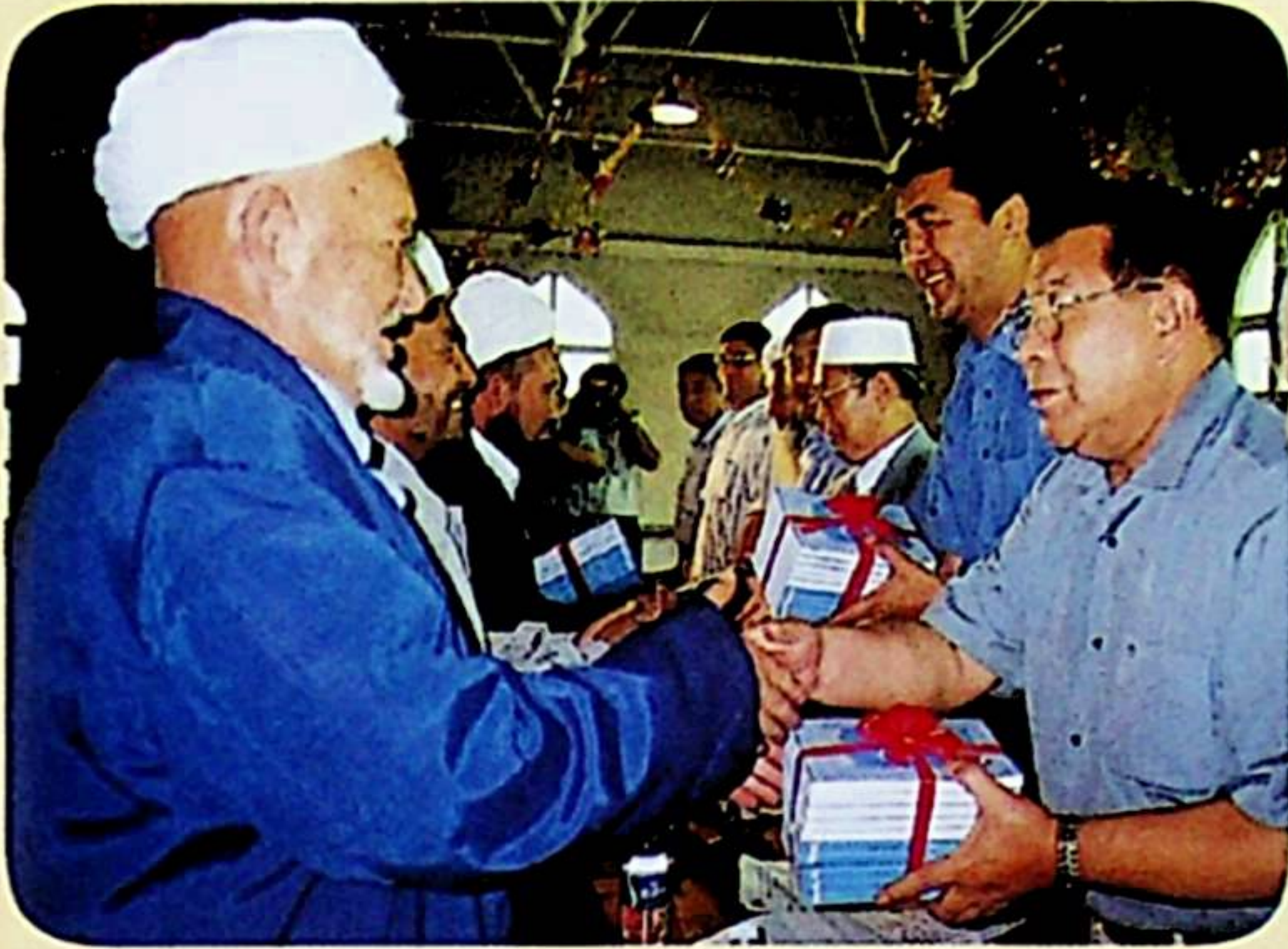
مۇراسىمدا رەھبەرلەر «يېڭى ۋەز-تەبلىغەن» كىتابىنى ھەدىيە قىلماقتا.