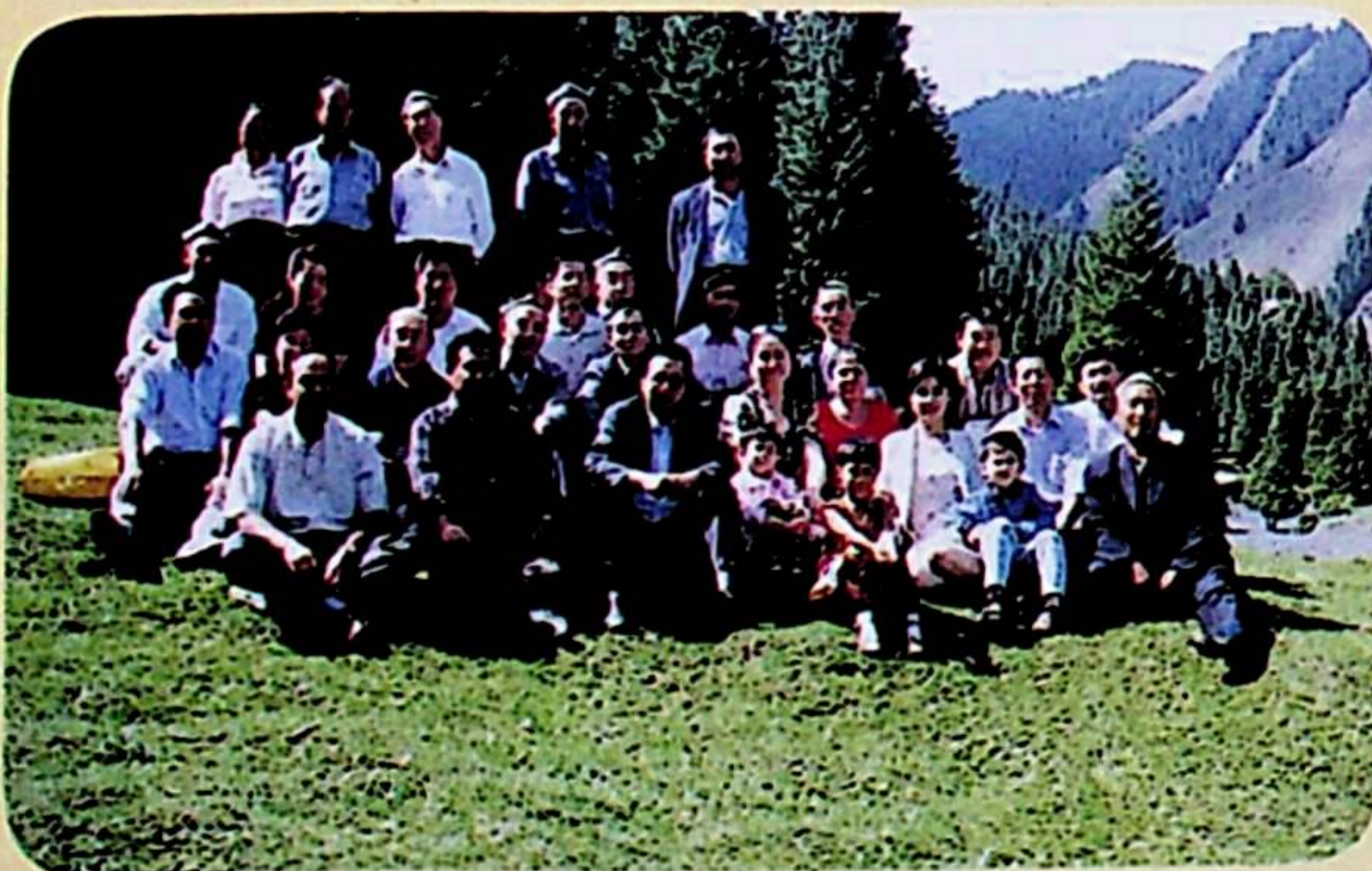
يىغىن قاتناشچىلىرى نەنسەن ساياھەت رايونىدا