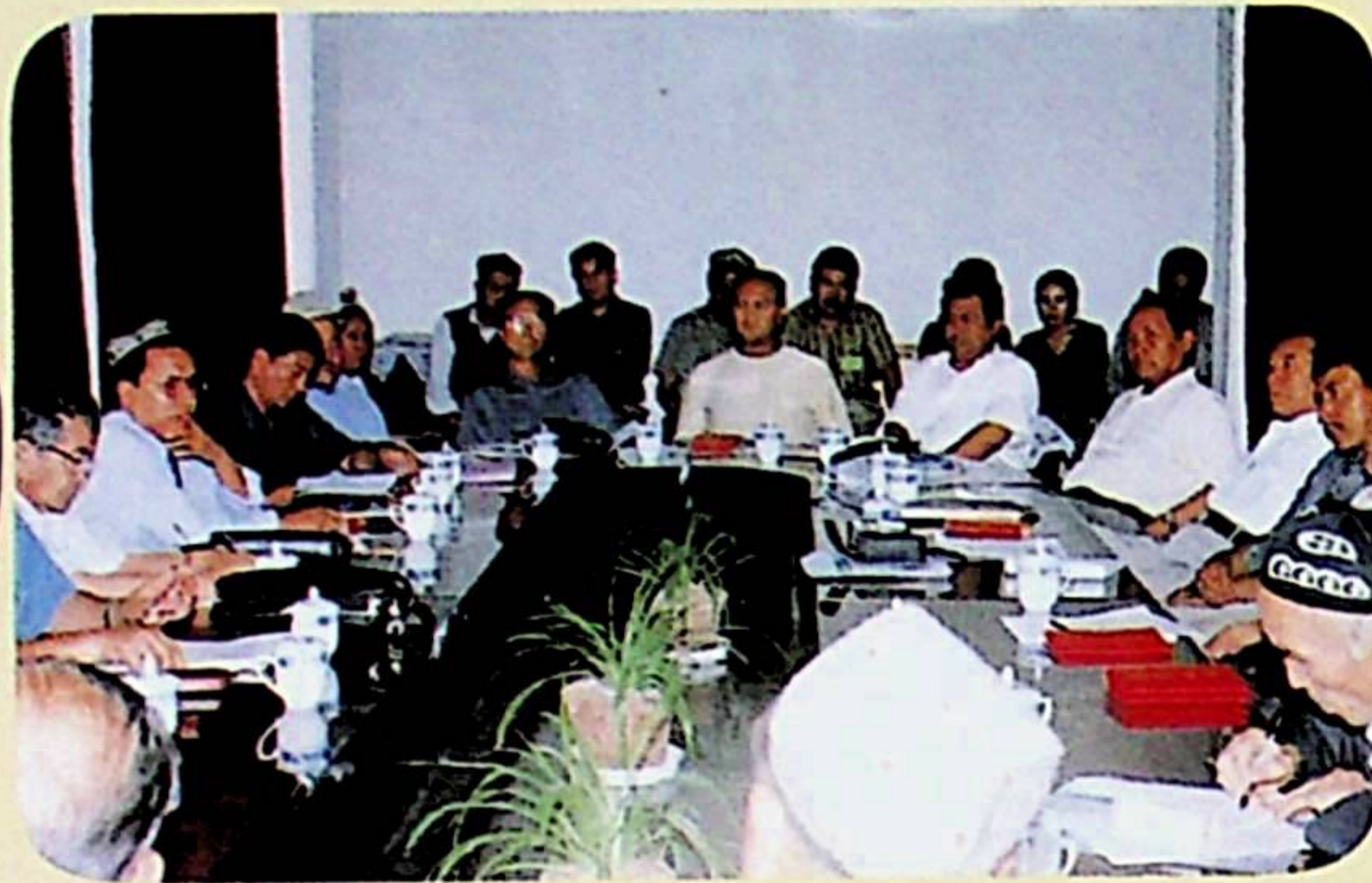
يىغىن مۇزاكىرىسىدە ۋەكىللەر قىزغىن پىكىر ئالماشتۇرماقتا.