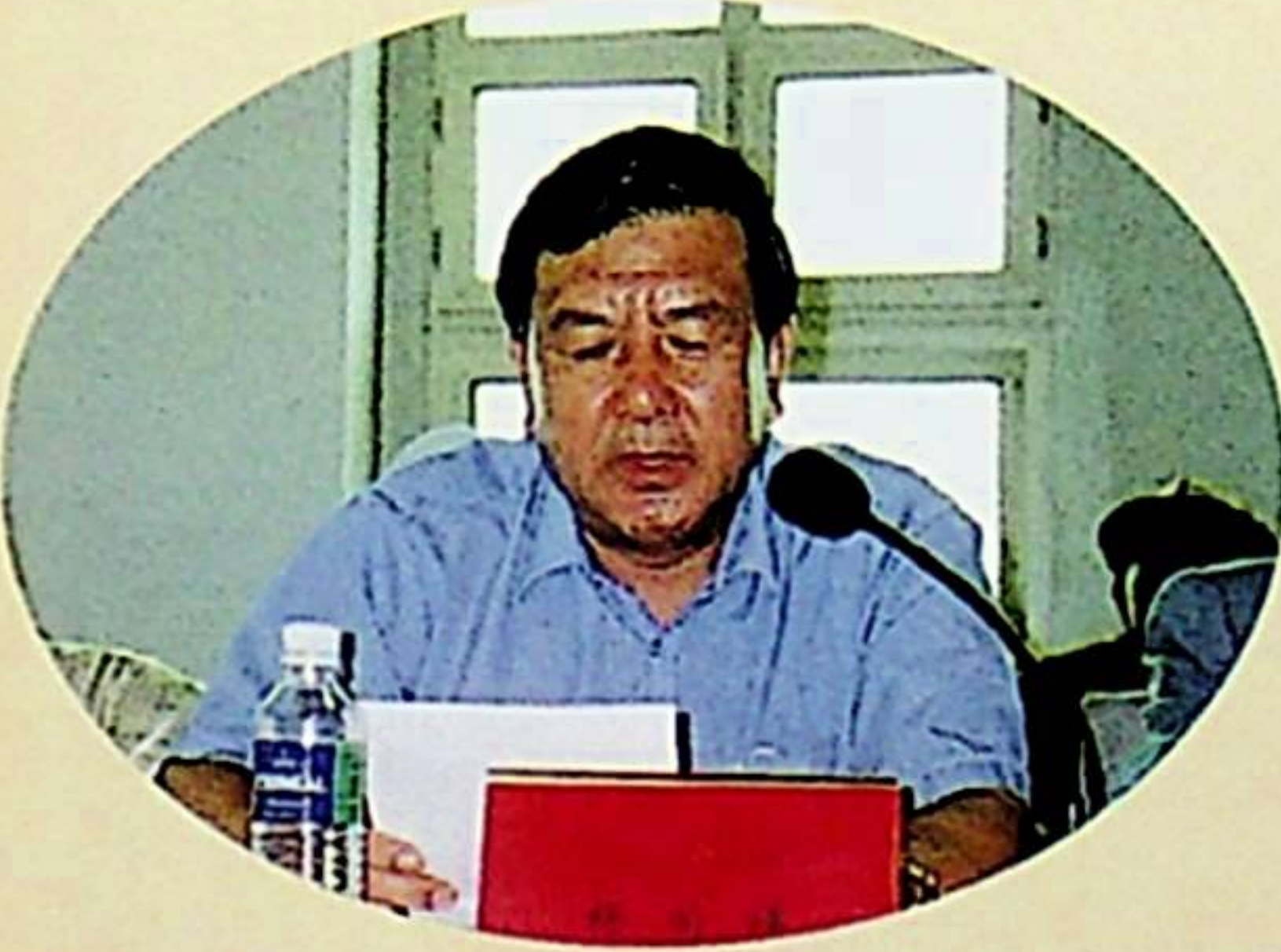
دۆلەتلىك دىن ئىشلىرى ئىدارىسىنىڭ مۇئاۋىن باشلىقى ياڭ تۇڭشياڭ سۆز قىلماقتا.