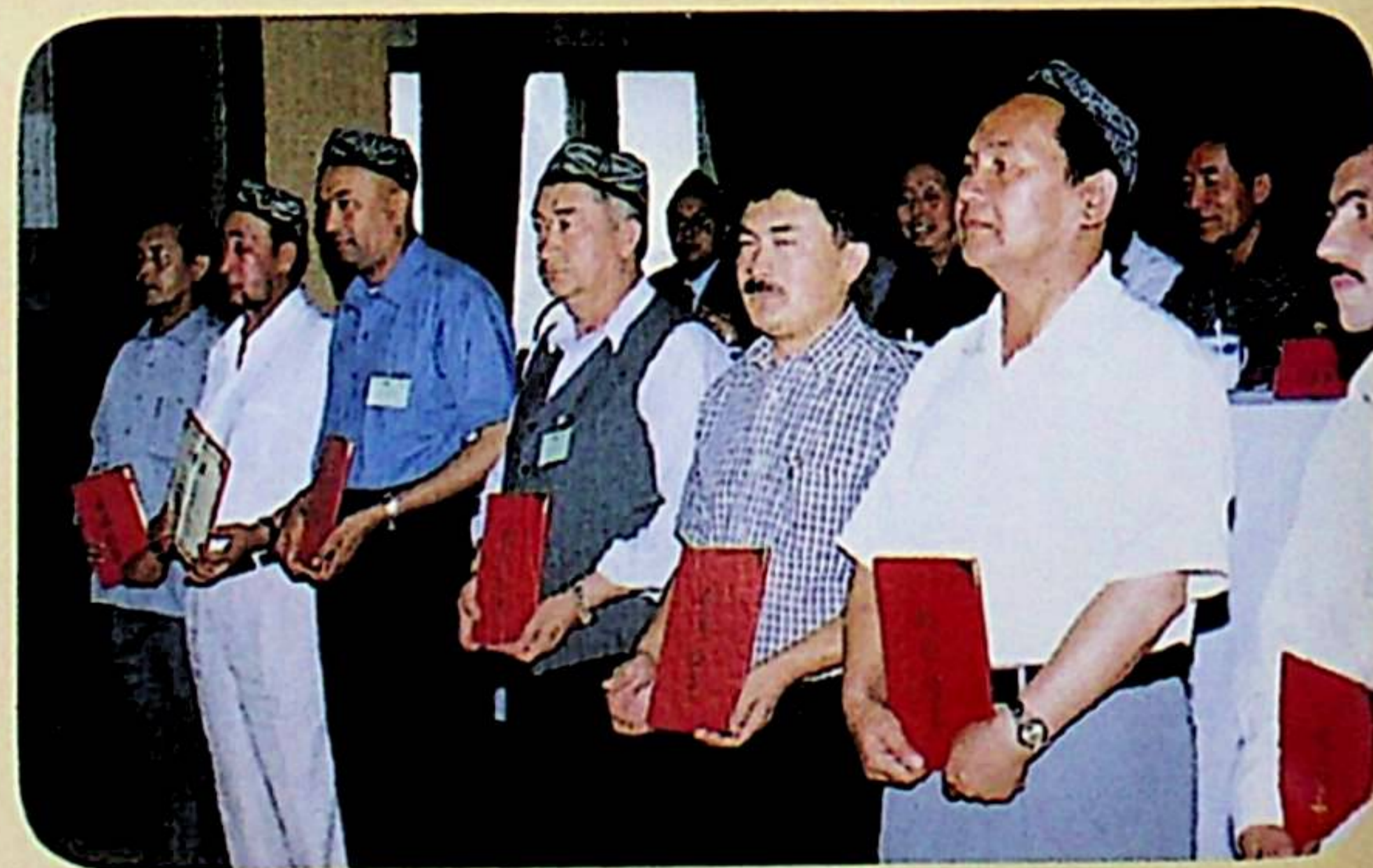
ژۇرنال تارقىتىشتىكى ئىلغار شەخسلەر