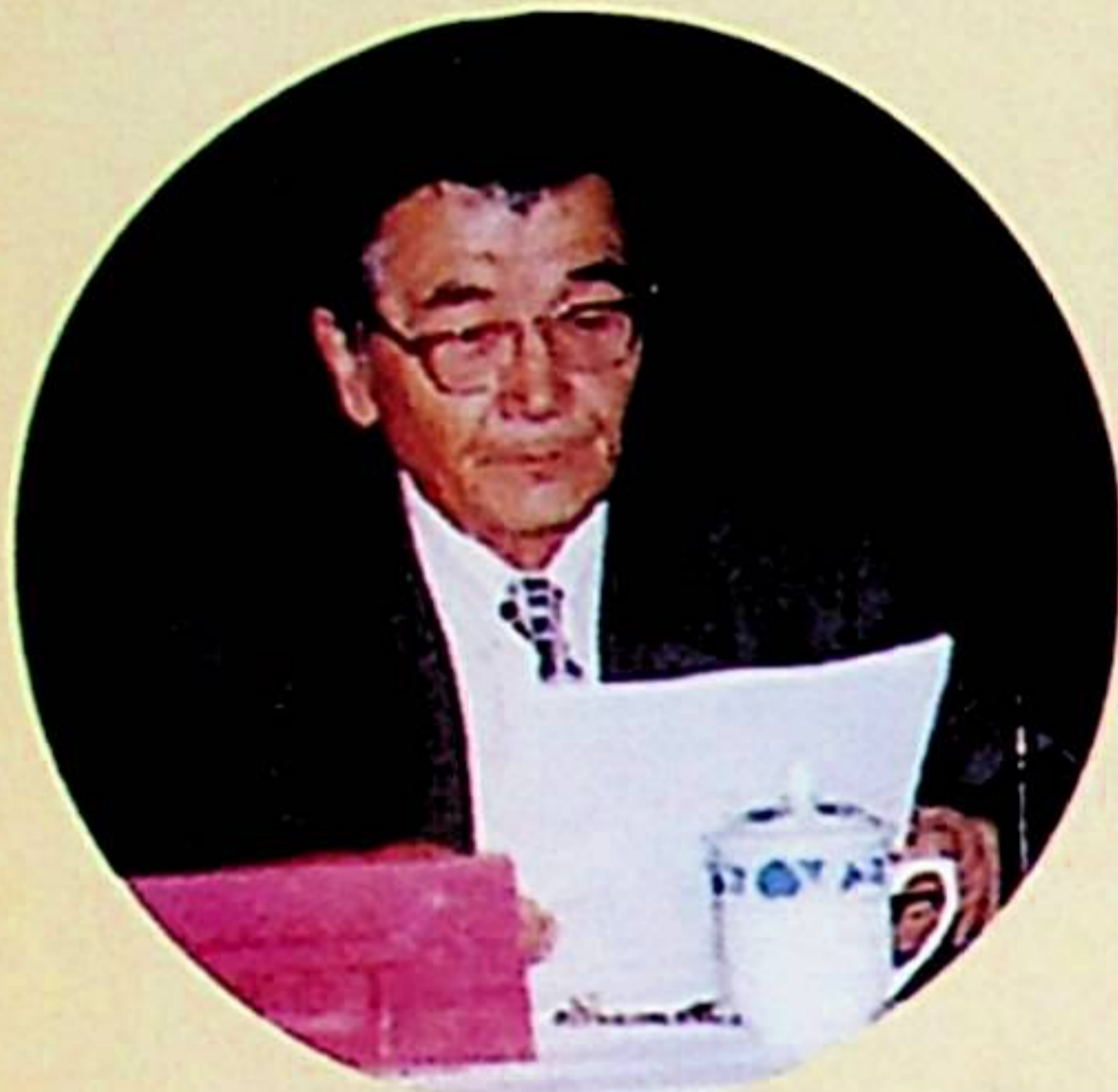
مۇئاۋىن رەئىس، باش مۇھەررىر شەمشىدىن ھاجى يىغىندا ئوكلات بەرمەكتە.