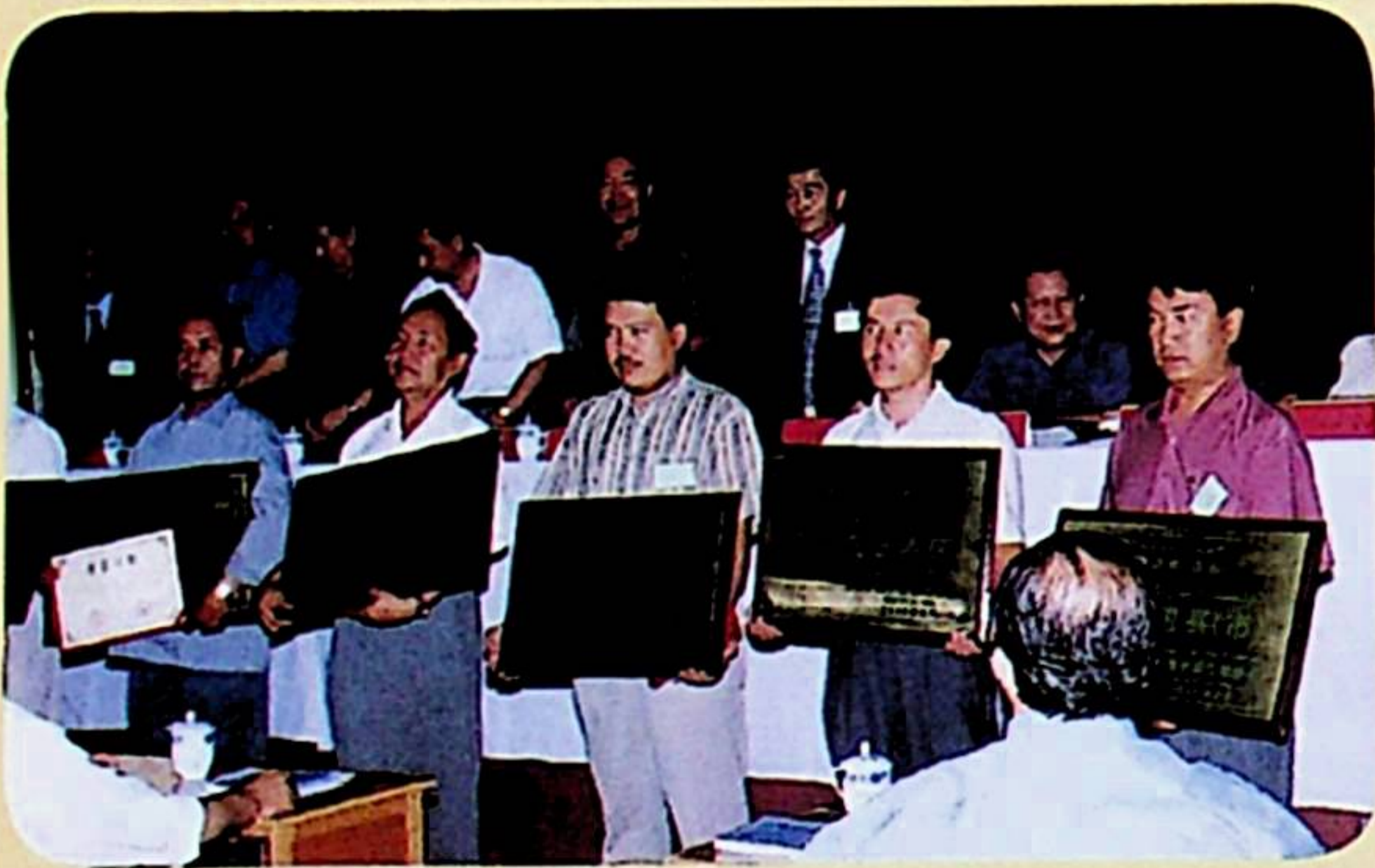
ژۇرنال تارقىتىشتىكى ئىلغار ئورۇنلار ۋەكىللىرى