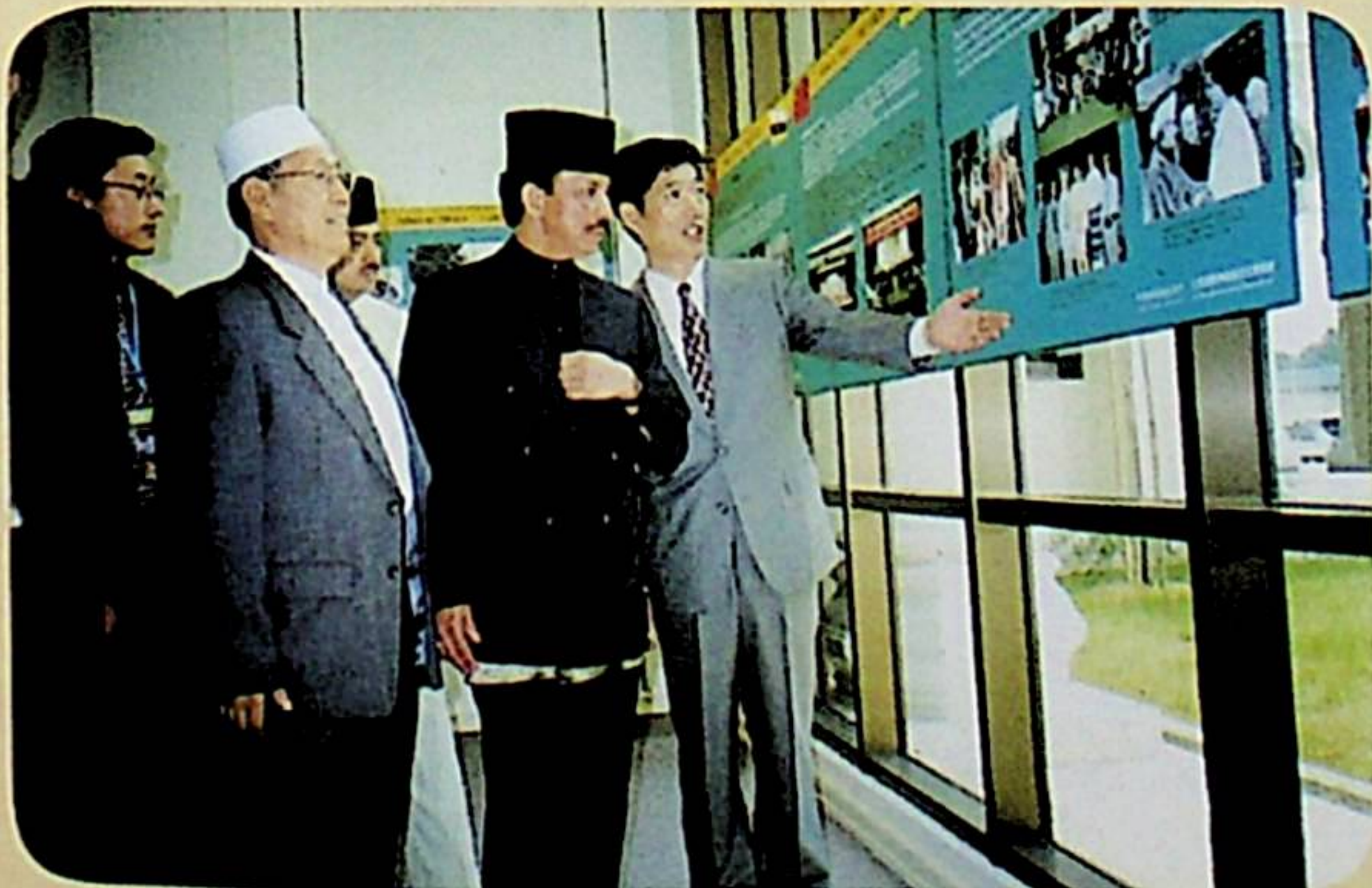
جوڭگو ئىسلام جەمئىيىتى ۋەكىللىرى بىرۋاقىت دارۇسسالامدا خەلقئارالىق ئىسلام مەدەنىيىتى كۆرگەزمىسىگە قاتناشتى.