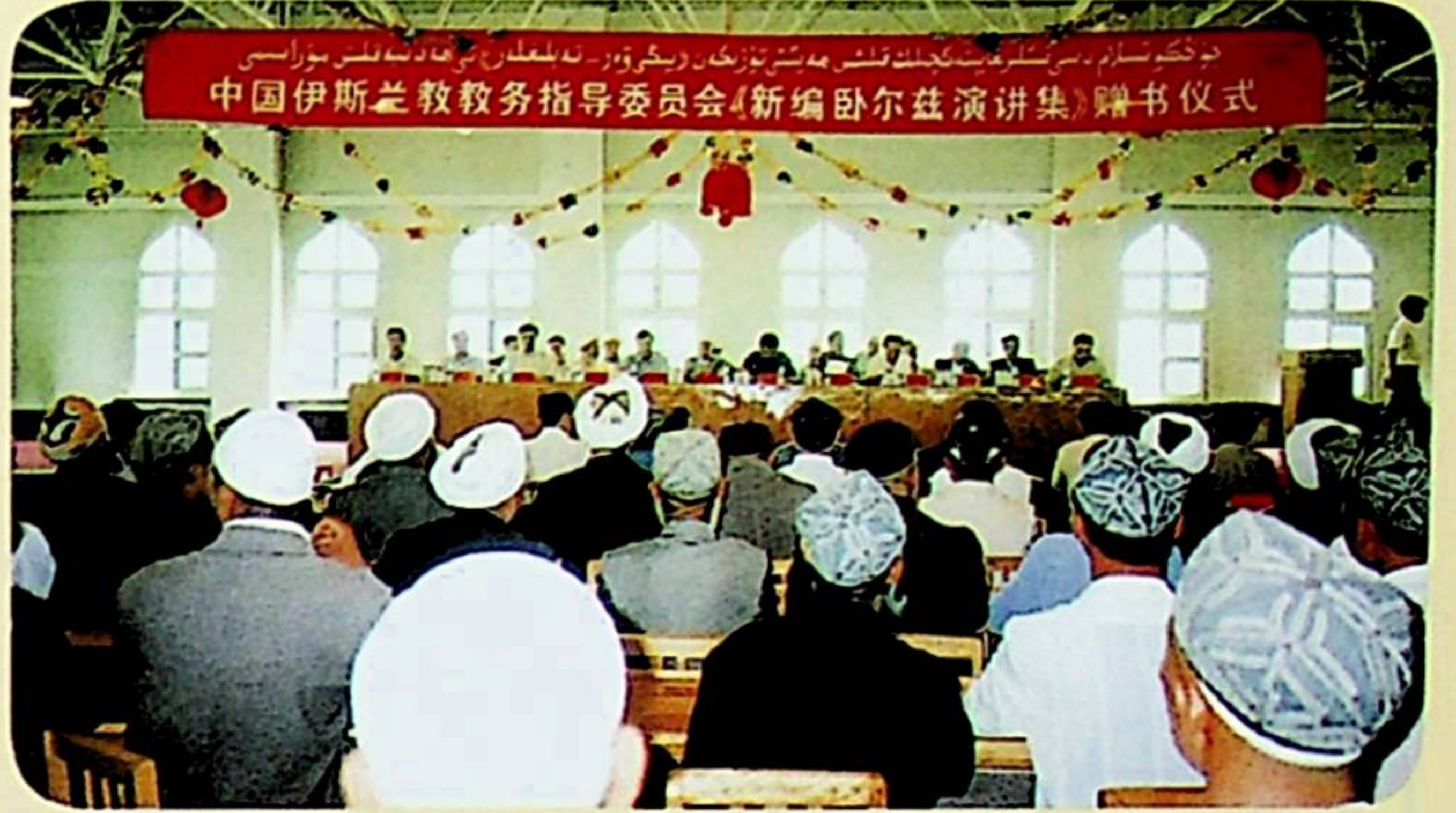
مۇراسىمغا مۇناسىۋەتلىك رەھبەرلەر ۋە ئېتىقادچى ئامما ۋەكىللىرى بولۇپ 300دەك كىشى قاتناشتى.