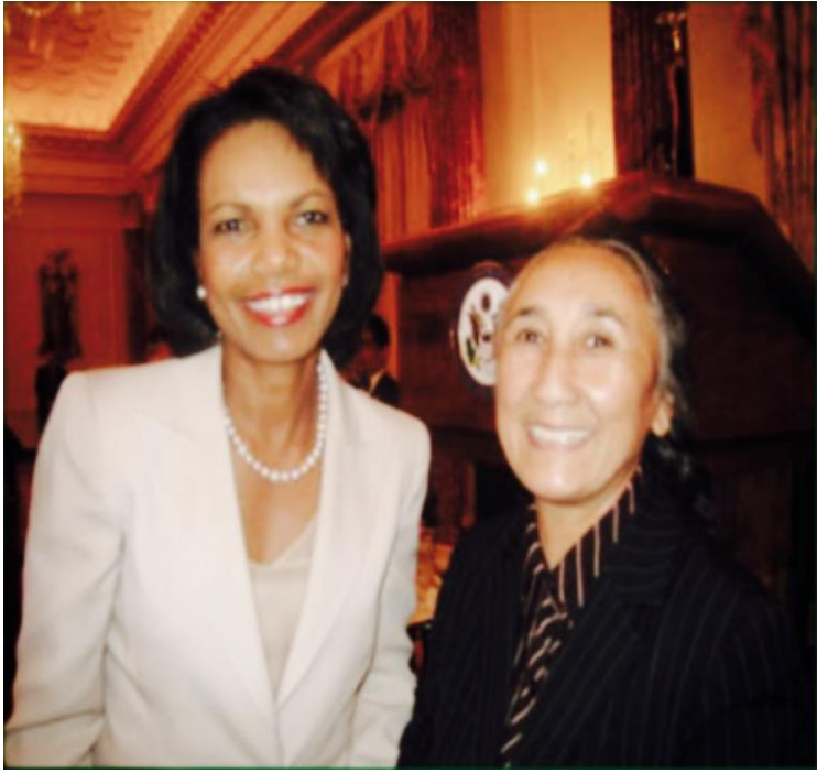
رابعه خانم تامبرکا سابقہ تاشقی ئشلار منستى رايى خانم بله ن بلله