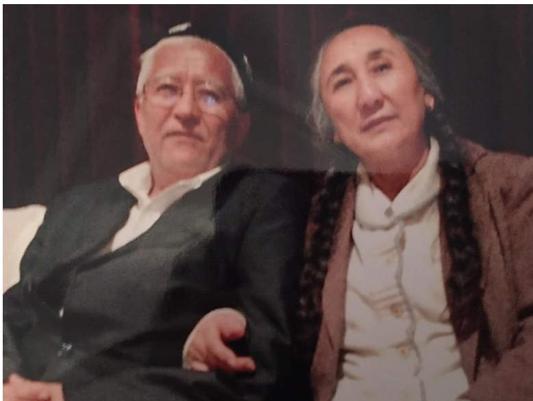
يازغۇچى سەنەقھاجى روزى رەپىقسى رابىيە خانىم (ئوڭدا) بىلەن بىللە