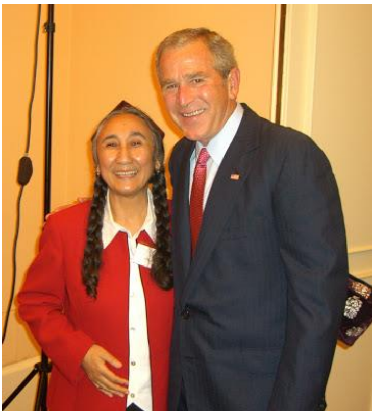
رابعه خانم ئامېرىكا سابو رهئسى بوش بلهه 26/06/2006