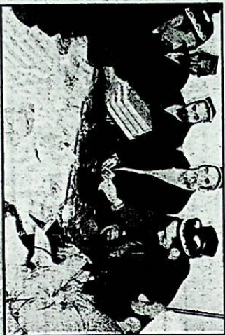
في تركستان الشرقية ممنوع الصيام!

ولا بد ان يشعر كل مسلم بأنه مسؤول بشكل او باخر عن مأساة مسلمي تركستان الشرقية ان استطاع عن طريق كلمة بعض طلابهم الذين يدرسون في جامعات اسلامية او يتبعون بما جاءت للفهم من اموال لضعفهم او لضعاء لهم بالصبر واللبارة حتى النصر في النهاية حتى تعود دولة الاسلام كما كانت ان الله تامل من يصوم.