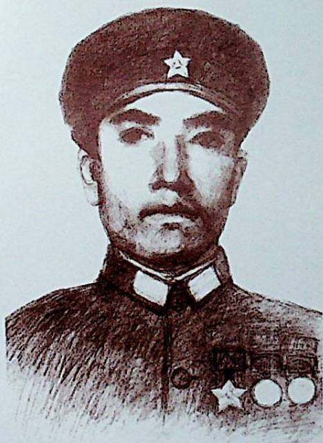
ئۇرۇش قەھرىمانى زىخۇرۇللام نادىر ئاخۇن ئوغلى