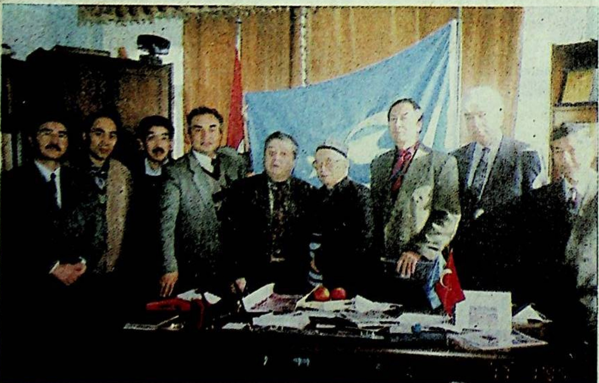
داۋامى 3 - بەتتە

ئۇيغۇرلارنىڭ دۆلەتلەر ئارا ئىتتىپاقى ۋە كىلىلىرى ئىستامبولدا