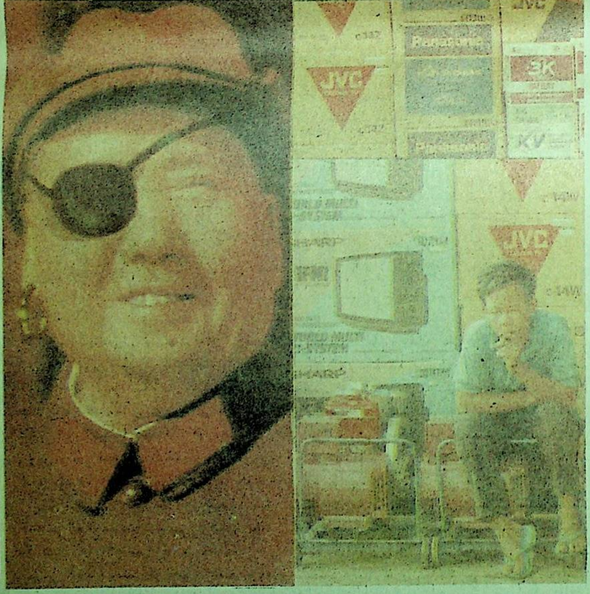
ما ۋۇ دېڭنىڭ ساختا ۋار سودىسىغا قارشى چىقىشى . بەلكىم ئۇ ئەۋرىلىرىنىڭ بىرى . ئۇنىڭ مېلىنى بۇنىڭغا ، بۇنىڭ مېلىنى ئۇنىڭغا سېتىشتا بۈگۈنكى ھالغا چۈشۈپ قېلىشىنى ئويلىمىغان بولمىشى كېرەك .

ئامېرىكا مۇنداق دەپ قارايدۇ : خىتايىنىڭ ئامېرىكا بىلەن تاقاب تۇرۇشى بۈيۈك ئادىمى دېڭ شياۋپىڭنىڭ ئۆلۈمىنىڭ يېقىنلاشقانلىقى . ئۇنىڭ ئورنىغا ئامېرىكا كوممۇنىست جياڭ زېننى ئولتۇرۇپ ، يۈزۈن سىياسى ، ھەربى ھوقۇقىنى قولغا ئېلىپ ، خەلقنى دېموكراتىيە ئىشلىتىش بولغۇپ ، تەشكىللىنىش ، سۆزلەش ھوقۇقى بولمىغاچقا ، 1989 - يىلى ئوقۇغۇچىلار ھەرىكىتى قايتا يۈز بەرسە ، تېخىمۇ دەشەتلىك قىرىپ تاشلايدىغانلىقى ، خىتاي ھەربى ھاكىمىيەت يۈرگۈزۈپ ، ئامېرىكىنىڭ ئىشەنچىدىن يىراقلاپ كېتىۋاتقانلىقىدىن دۇر . بۇنىڭدىن كېيىن ، ئامېرىكا ھەربى ، سىياسى ، ئىقتىسادى تاۋار سودىسى ۋە ئىنسان ھەقلىرى ھوقۇقى جەھەتتە ، خىتايغا يۈز بەرمەيدۇ .