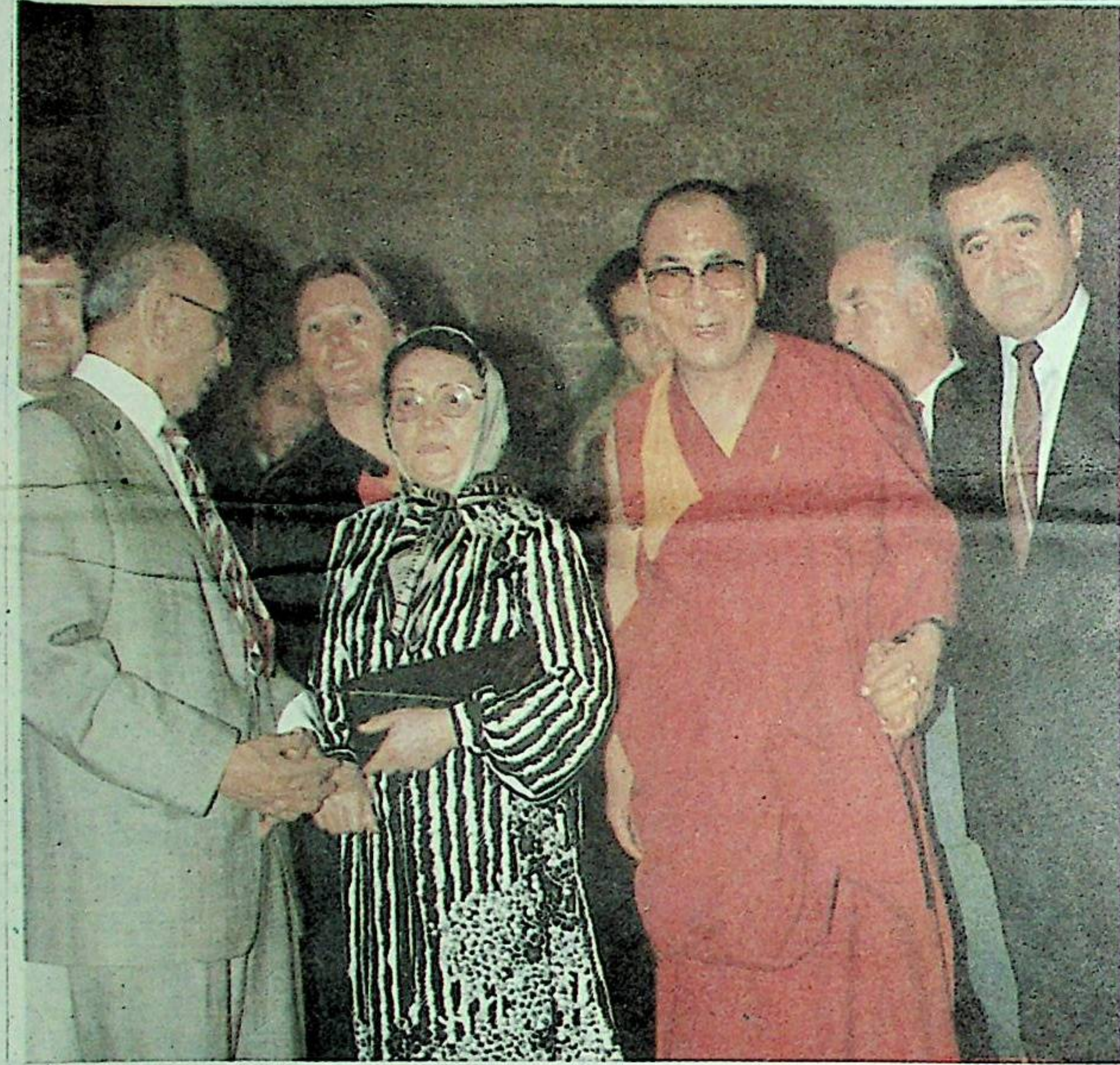
ئەيسا ئەفەندىم ، فاما خا نىم دالاي لاما بىلەن بىرگە

شۇ كۈنى ، تۈركىيە تېلېۋىزىيە ئىستانسىسى ، تۈركىيە رادىيو - تېلېۋىزىيە - گېزىتى ، تېلېۋىزىيە ئىستانسىسى ، تۈركىيە گېزىتى ، فرامان گېزىتى ، ئوتتۇرا شەرق گېزىتى قاتارلىق تۈركىيىدىكى ھەرقايسى جاي - كىچىك ئاخبارات ئورۇنلىرى فاما خا نىمنىڭ ۋاپاتى ئەتكەنلىك خەۋىرىنى تەپسىلى خەۋەر قىلدى .