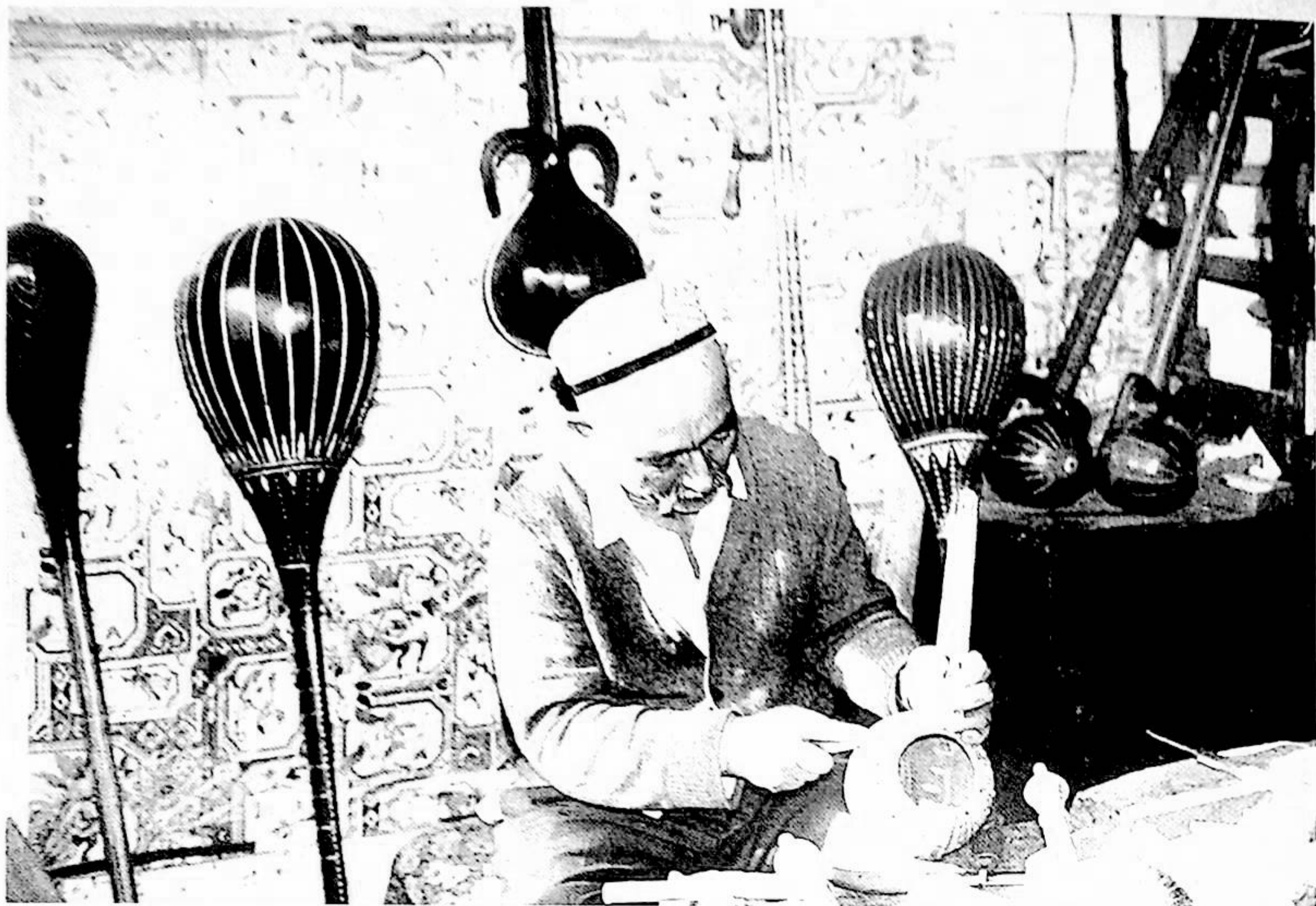
ئاتاغلىق مىللىي جالغۇ ئەسۋابلىرى توستىسى ئەيساخان