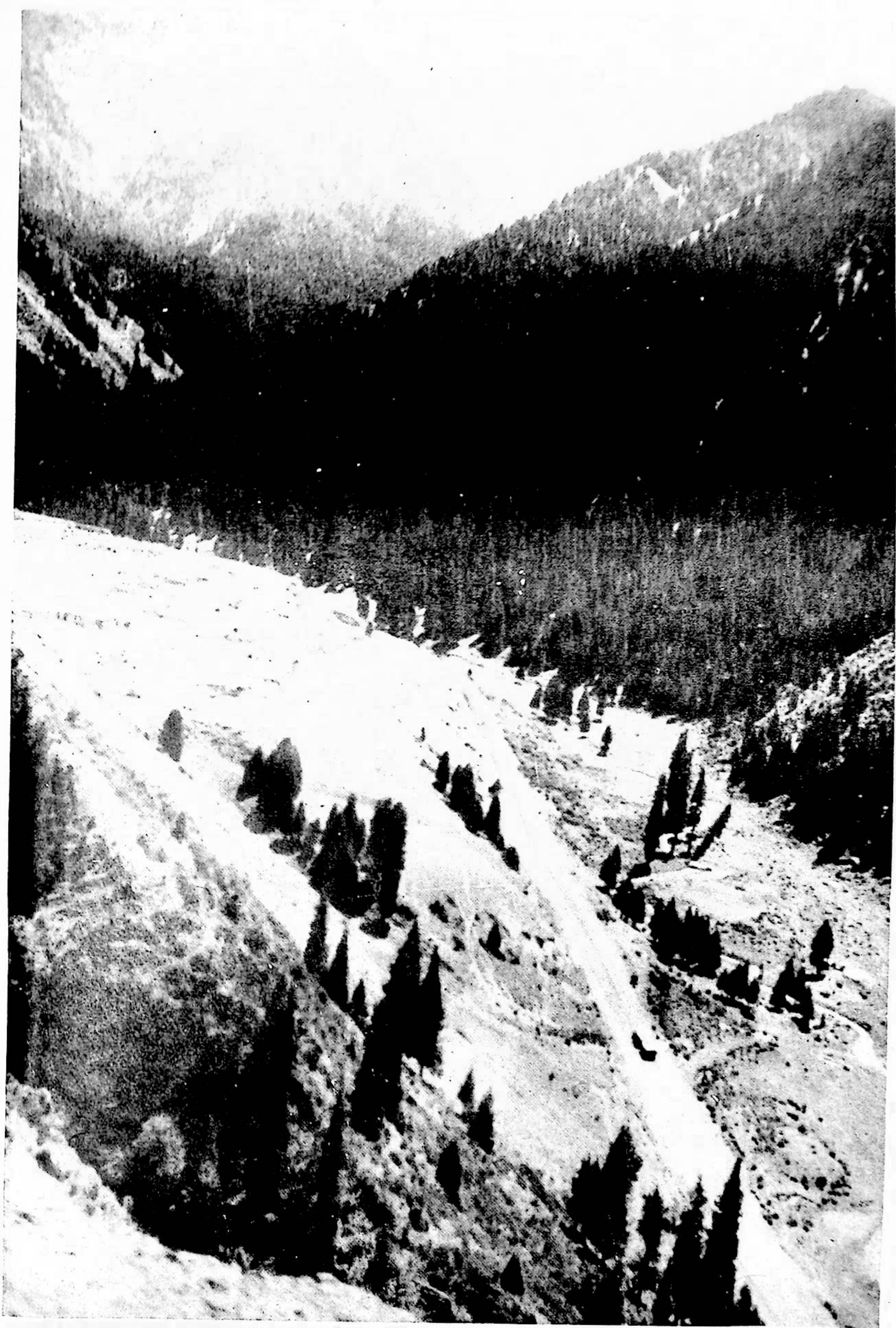
تورکەش جاپيار فوتوسی