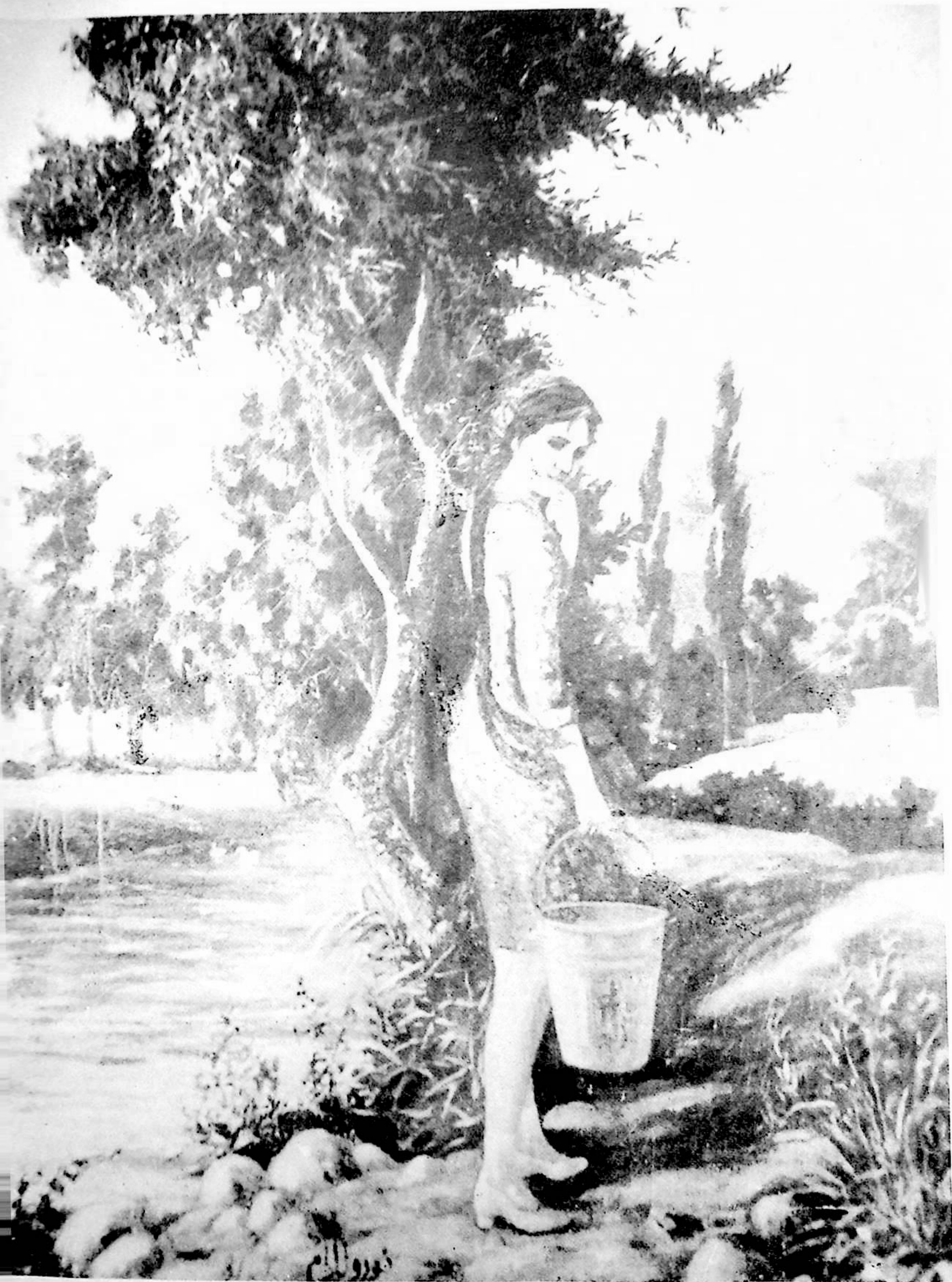
تورۇللام ئىبراھىم سىزغان